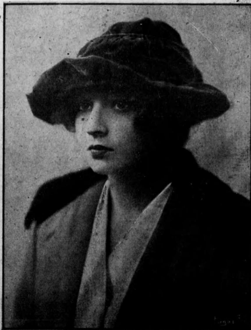
Sombrero de terciopelo «azul horizonte».