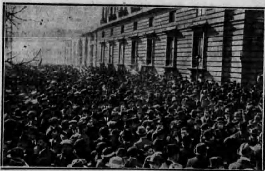
El público congregado en los alrededores de Palacio durante la grandiosa manifestación de simpatía que tributó a nuestro Monarca el día de su fiesta onomástica.

«Goyescas» (intermedio), Granados. «Las nueve de la noche» (jota), Caballero.