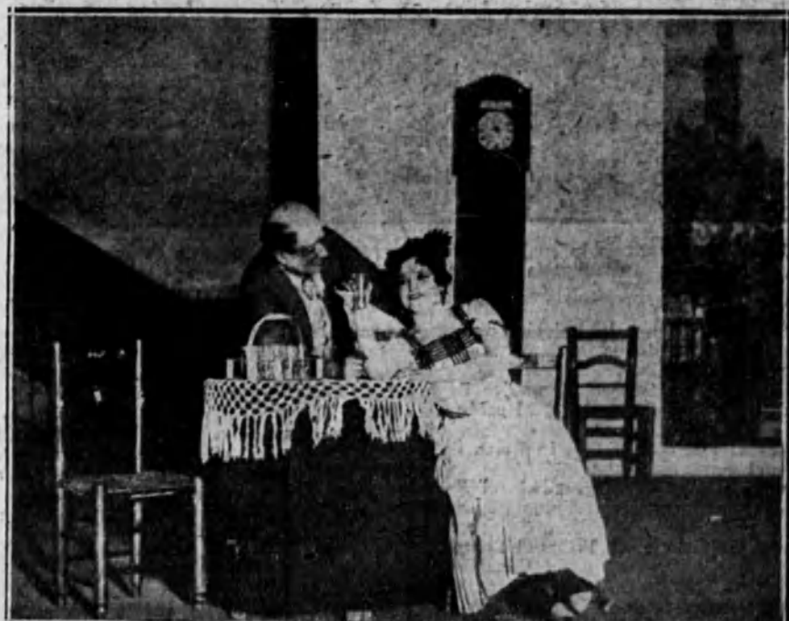
MADRID.—Una escena de la zarzuela titulada «Tripanerías», estrenada con buen éxito en el teatro de Apolo.