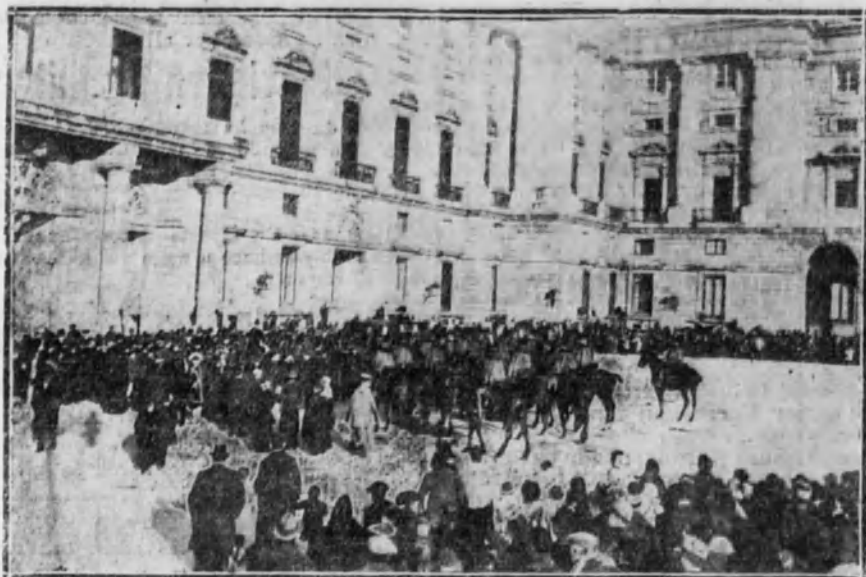
Aspecto de la plaza de la Armería durante la recepción celebrada ayer en Palacio con motivo del santo de S. M. el Rey.

Igualmente llegó el presidente del Sena-