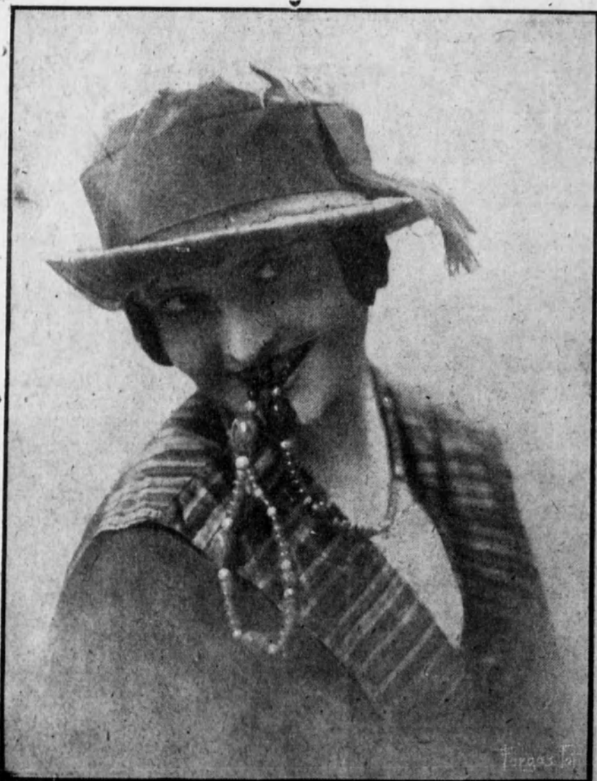
Sombrero de terciopelo hoja seca, adornado sencillamente de cinta deshinchada color cereza.