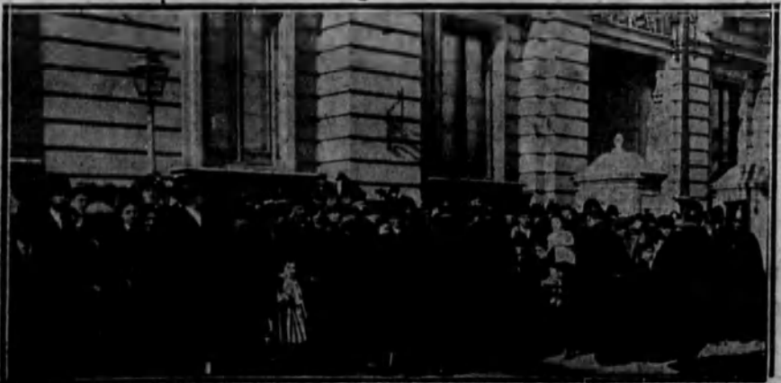
El público esperando vez en la puerta de Palacio para firmar en las listas de Mayordomía.

Los grandes de España que estuvieron presentes fueron: los duques de Híjar, Montellano, Seo de Urgel, Gor, Lécera, Arión, Bivona, Conquista, Infantado, Tetuán, Victoria, Luna, Unión de Cuba, Maqueda, Vista hermosa, Aliaga, Medinaceli, Zaragoza, San Pedro de Galatino, Vega, Torres, Castillejo, Sotomayor, Alburquerque, Osuna, Dúrcal, Arco y Aveyro; marqueses de Aranda, Santa Cristina, Salar, Hoyos, Rafal, Escala, Cenia, Vendera, Guad-el-Jelú, Narros, Romana, Someruelos, Quirós, Portago, Fontalvo, Távara, Bondad Real, San Juan de Piedras Albas, San Vicente, Viesca de la Sierra, Santa Marta, Martorell, Perijá, Albolote, Canillas de los Torneros, Squilache, Benaméjil, Guadalcázar y Santa Cruz; condes de Torono, Santa Coloma, Heredia Espinola, Agui-