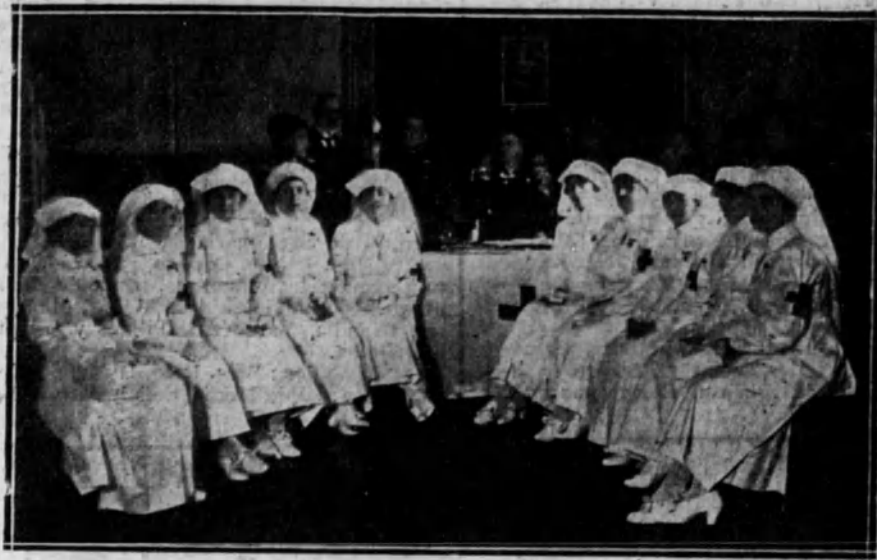
La excelentísima señora de Aizpuru, que, en representación de la Reina, impuso en los salones de la Comandancia general los brazaletes a las damas enfermeras.