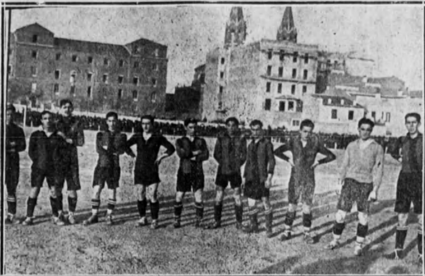
El equipo del Racing Club, vencedor ayer y probable campeón del Centro.