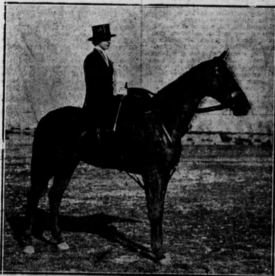
Condesa de San Martín de Hoyos.