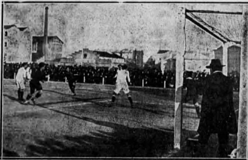
Una fase interesante del partido Racing-Madrid.