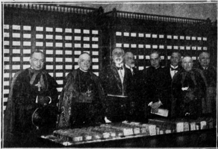
MADRID.—Toma de posesión del nuevo académico D. Miguel Asín Palacios en la Real Academia Española.