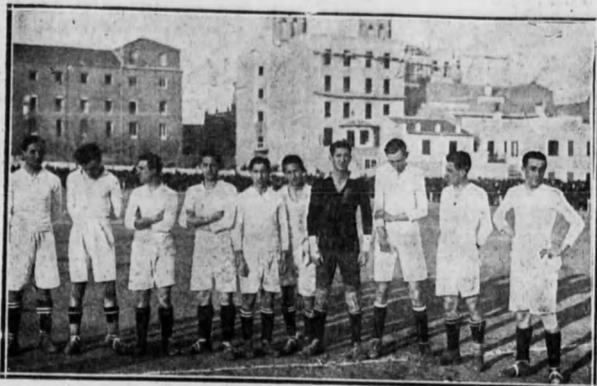
El equipo del Madrid F. C., probable vencedor en el segundo lugar del campeonato.