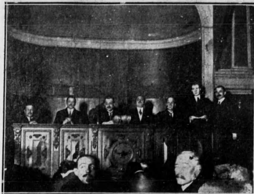
MADRID.—Sesión inaugural del Congreso de Sanidad civil, presidida por el alcalde, en el Ateneo.