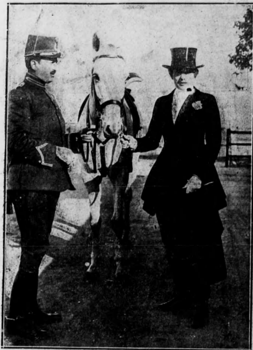
Su Majestad la Reina con su caballerizo, después de correr un gamo.