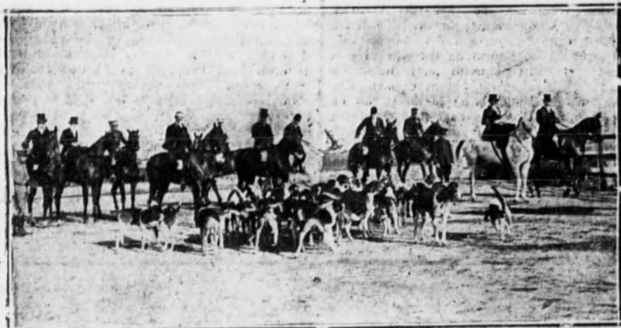
Grupo de cazadores dispuestos a correr una liebre.