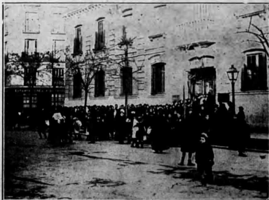
El público esperando turno para someterse a la vacuna.