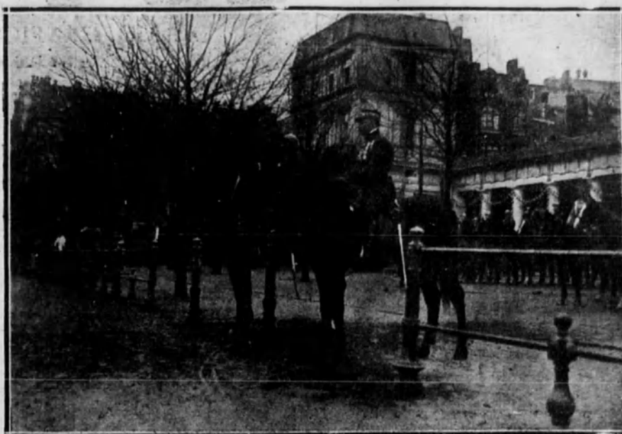
El general Michel, jefe del Ejército belga de ocupación, acompañado del general francés Desgouttes, en Colonia.