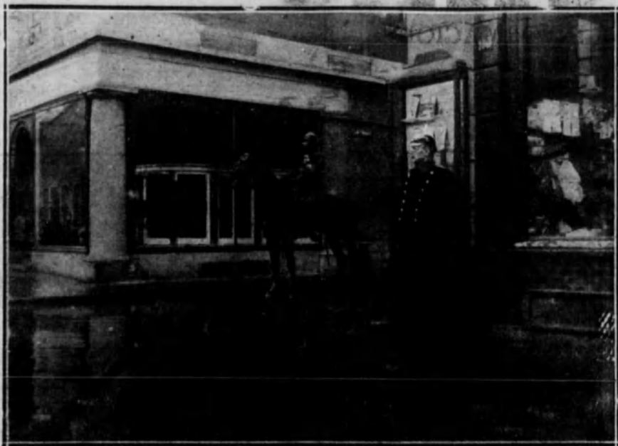
El general Michel presenciando el desfile de una división belga desde «Loh-Strasse», en Colonia (Alemania).