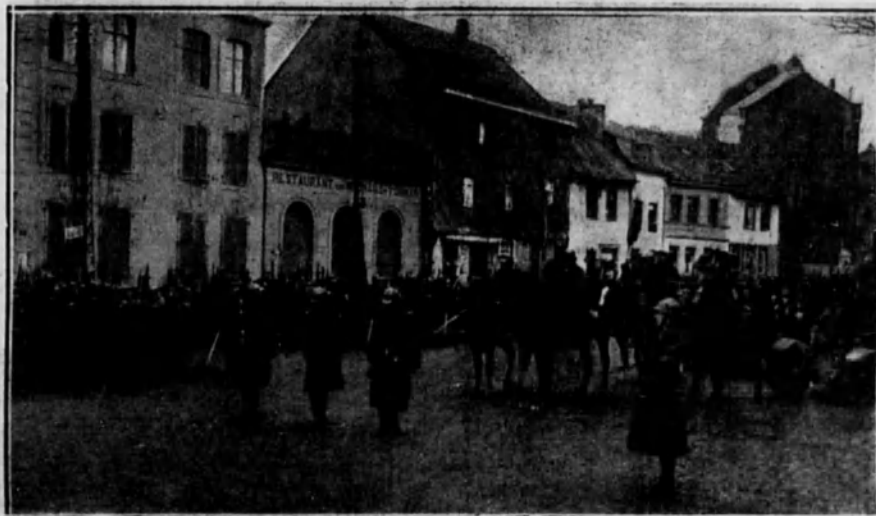
Saludo a la bandera belga por el Ejército de ocupación en la ciudad de Colonia.