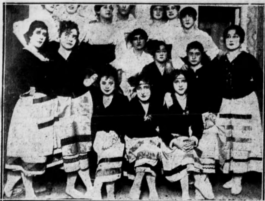
EN EL REAL.—Grupo de señoritas que bailaron el «Zorcico» en «La Bruja», en la función de la Prensa.