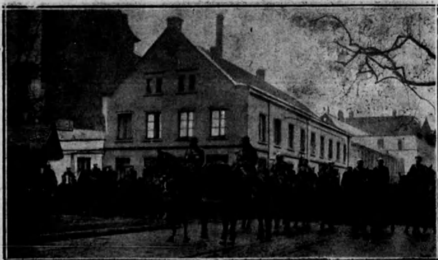
El general Michel presenciando el desfile de una división belga en Colonia.