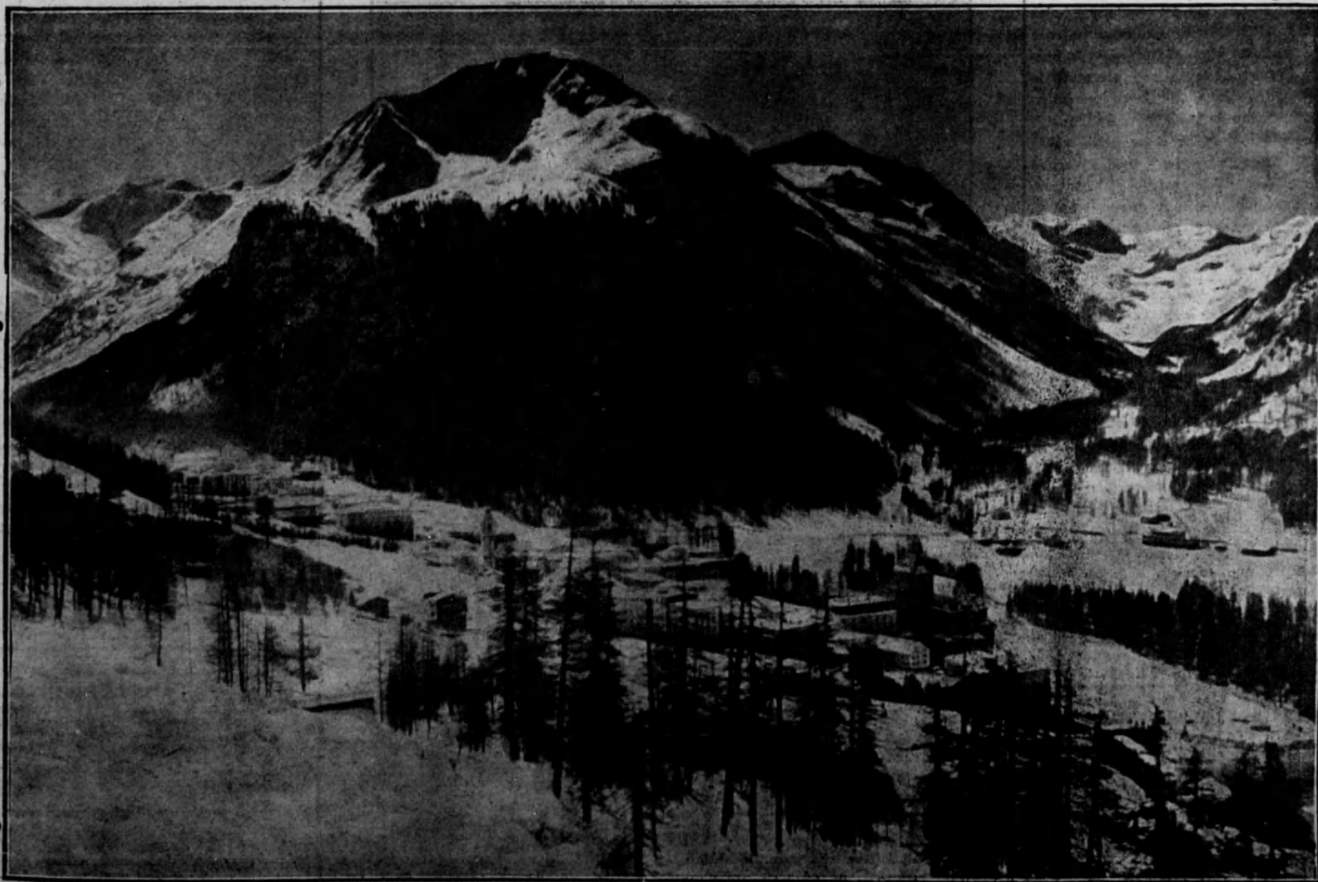
SUIZA PINTORESCA.—Vista de Pontresina, bello aspecto del paisaje de invierno en Suiza.