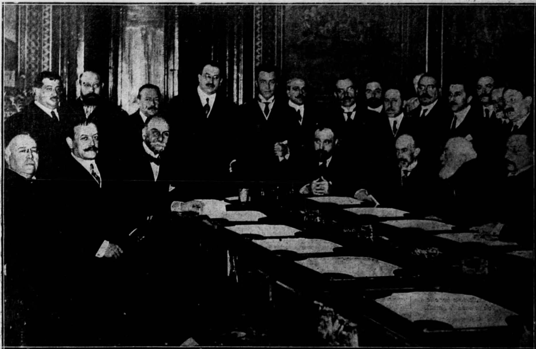
El presidente de la Diputación de Madrid, con los de las Diputaciones de Valencia y Cuenca, el alcalde de Madrid y otras personalidades, reunidos en el Senado para tratar del ferrocarril directo Madrid-Valencia.