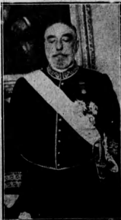
El Excmo. Sr. D. Fermín Calbetón, ex ministro de la Corona y académico de la de Ciencias Morales, que ha fallecido anoche en Madrid.

La enfermedad que aquejaba al ministro de Hacienda, D. Fermín Calbetón y Blanchón, ha tenido, por desgracia, un fatal desenlace, y aunque éste había sido previsto desde hace algunos días, la noticia ha producido general sentimiento entre los correligionarios del ilustre hombre público y los numerosos amigos y admiradores con que contaba entre todas las clases sociales, especialmente en Guipúzcoa, de donde era oriundo.