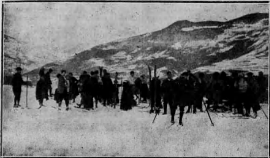
Grupo de alpinistas en plena montaña, preparando los «skis» para bajar en la nieve.

tar cuantas veces lo estime conveniente y en los días que desee, siempre que tenga por testigos a tres socios de Peñalara, uno de los cuales habrá de estar incluido en la lista de jurados para esta prueba.