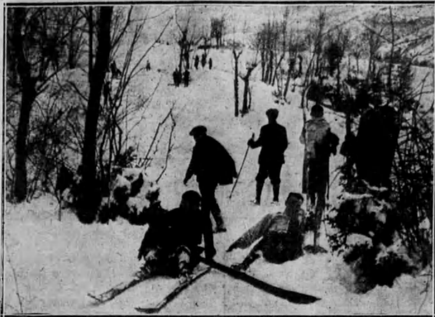
Los alpinistas descendiendo por las pendientes nevadas.

Concurso de saltos.—Premios: Una medalla de oro de campeonato para el que al cabo de la temporada obtenga el salto de mayor longitud en las condiciones fijadas, y dos medallas de plata. Cada concursante podrá sal-