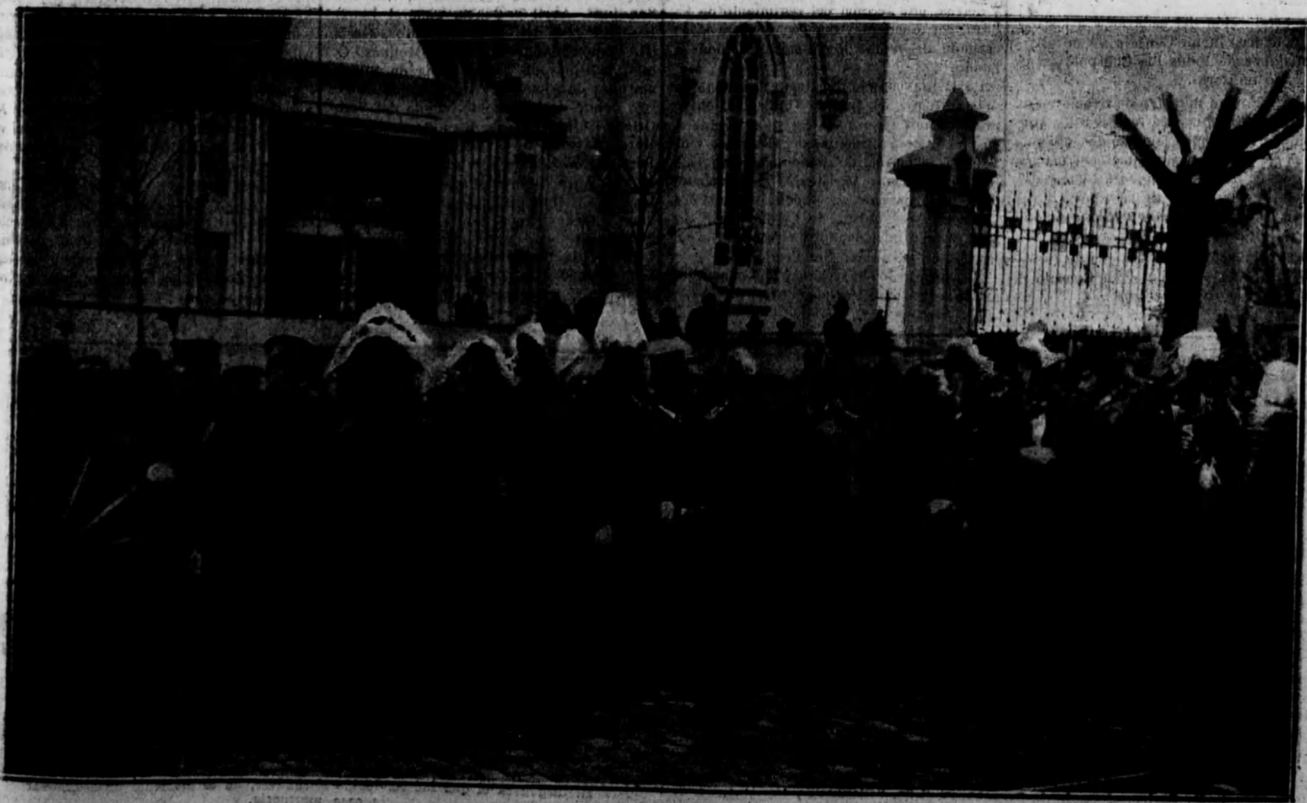
El Infante D. Carlos, el Gobierno, el Nuncio de Su Santidad, monseñor Rago-esi, y autoridades civiles y militares, que formaron la comitiva del duelo, frente a la iglesia de la Concepción, calle de Goya.