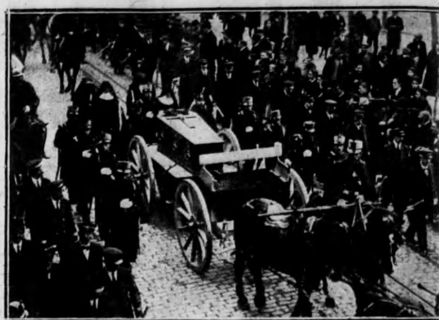
El furgón de artillería conduciendo los restos.