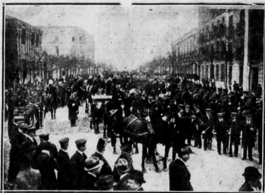
Aspecto de la calle de Lista al paso de la comitiva.