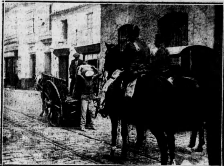
La Guardia civil custodiando en los mercados la descarga de géneros.

SEVILLA 5.—Se ha celebrado una reunión de obreros que componen los gremios no fe-