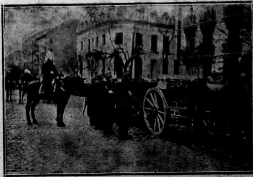
El furgón en el que fué conducido el cadáver, en el momento de abandonar la casa mortuoria.