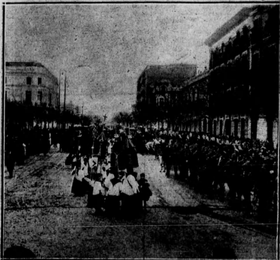
El Infante D. Carlos, el Gobierno y las autoridades civiles y militares, que formaron la cabecera del duelo. — Los escuadrones de Húsares y fuerzas de Ingenieros, que cubrieron la carrera al salir el duelo de la calle de Lista.