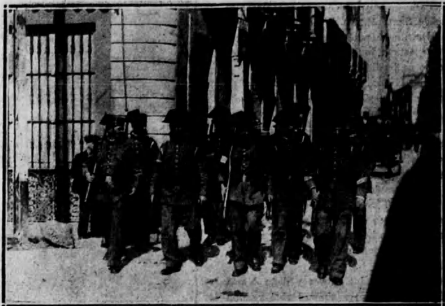
La benemerita patrullando por las calles.

derados, y en la cual han acordado persistir en la huelga hasta lograr el excarcelamiento de los detenidos y la solución del conflicto. Se nombró una Comisión para que marche de acuerdo con los gremios federados. Mañana tendrá lugar un mitin, en el que tomará parte Barriobero.