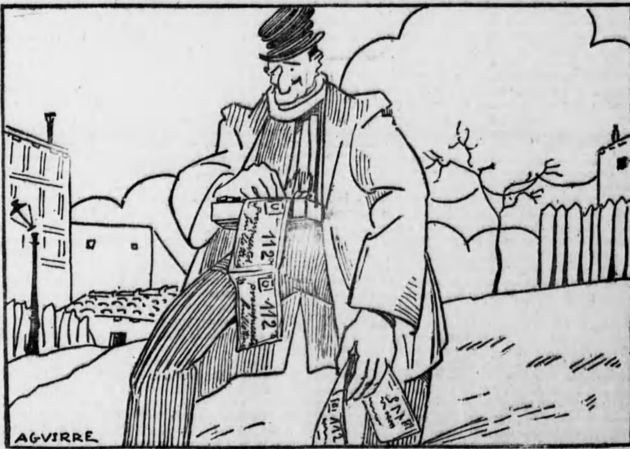
¿A quién le doy la suerte?