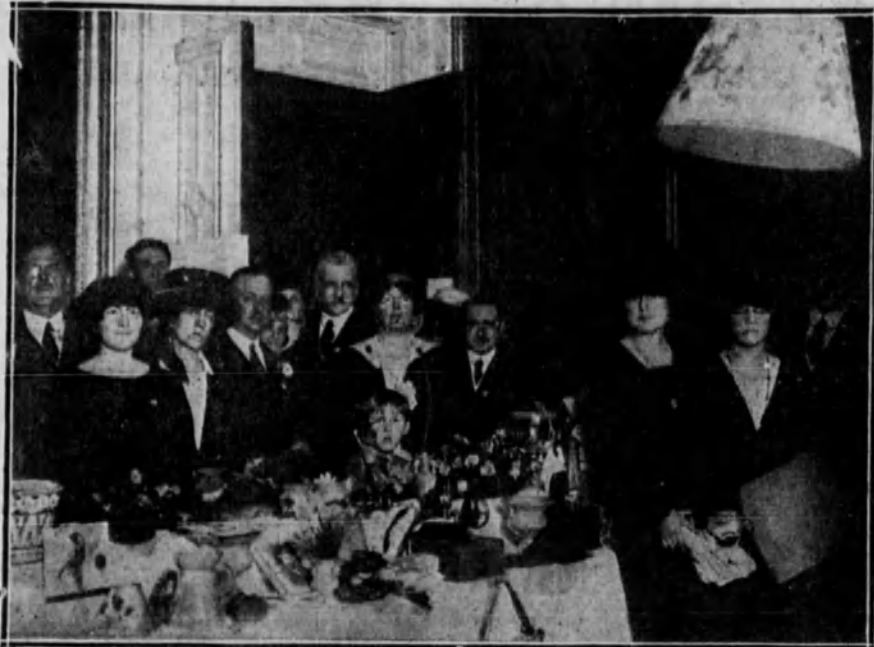
Los embajadores de Inglaterra en la sala de la tómbola, rodeados de los invitados y diplomáticos que asistieron al festival celebrado en dicha Embajada a beneficio de los heridos de la guerra.

¡Ved ya salir del agua los cantiles de esa Isla noble, Reina de los mares, porque es Madre de pechos varoniles!