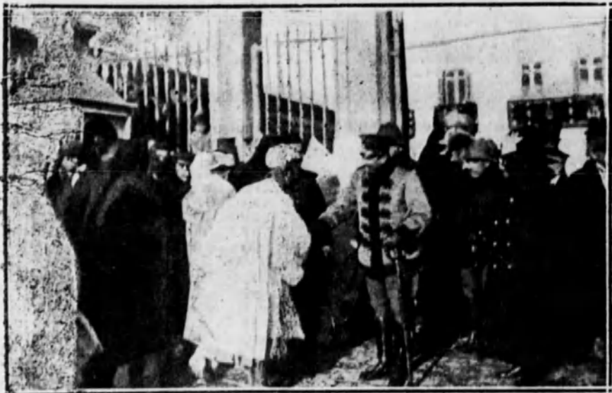
El general Berenguer recibiendo la bienvenida de las autoridades moras del Magzen.