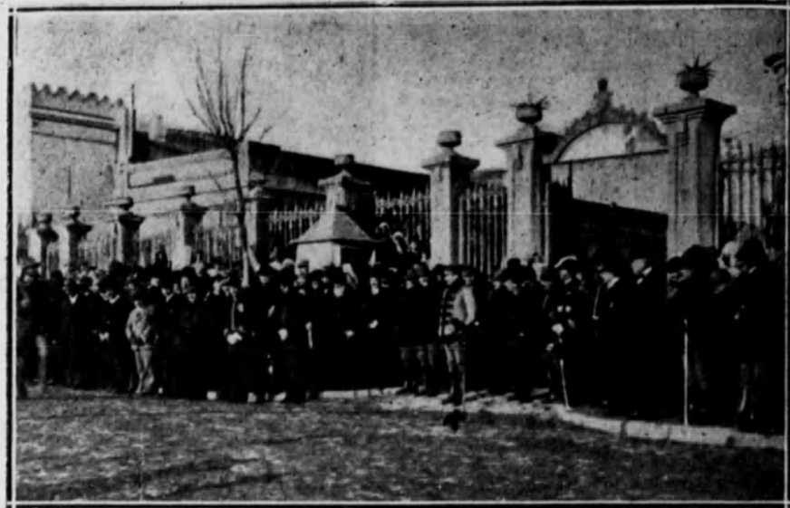
El general Berenguer acompañado de las personalidades civiles y militares, presenciando el desfile de las tropas en la puerta de la Residencia de Tetuán.