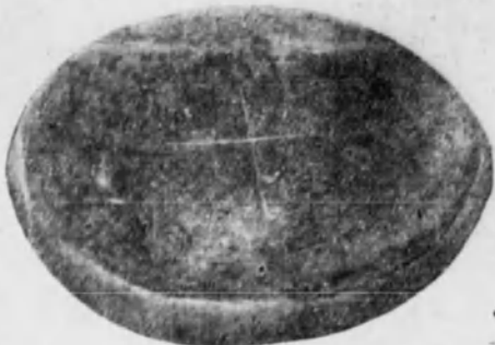
Pan de opio laborado y refinado como lo presenta el comercio a los fumadores de opio.

Los espectros de Verlaine, de Wilde y de Poe han abandonado sus tumbas, y por las no-