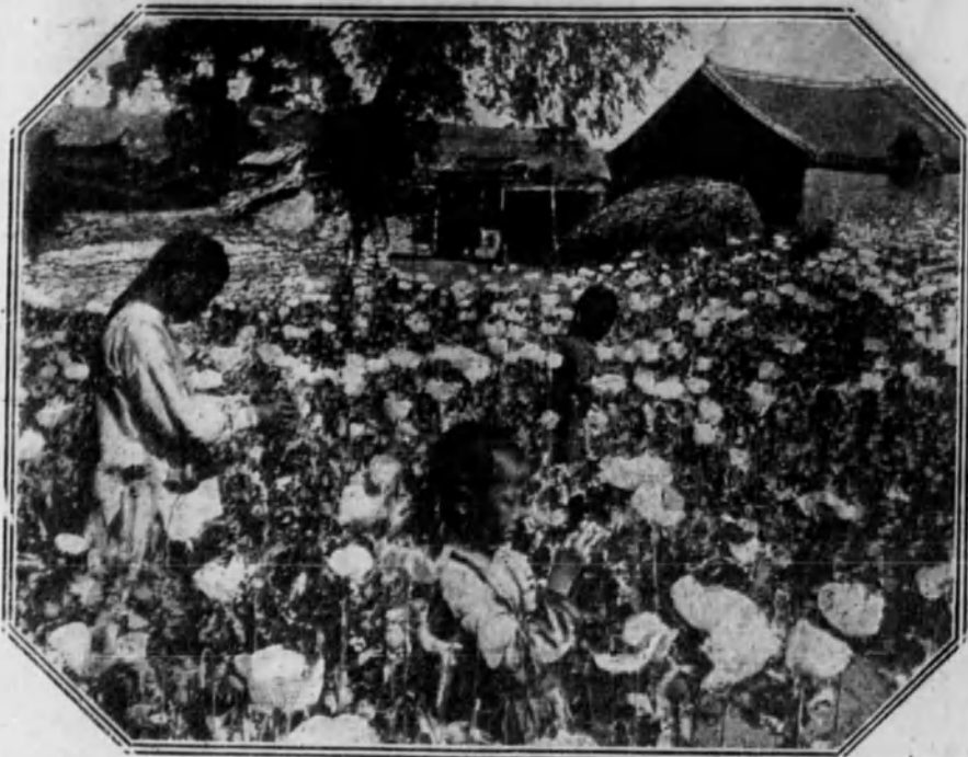
Casa china y campo con plantación de adormideras, en la época de la recolección del zumo.

Porque la joven diosa Razón se ha converti-