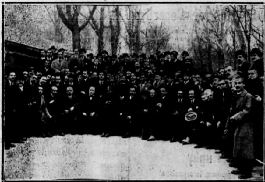
El alcalde y los concejales rodeados de los asistentes al banquete de Funcionarios Municipales, para conmemorar el primer aniversario de la fundación de dicha entidad.