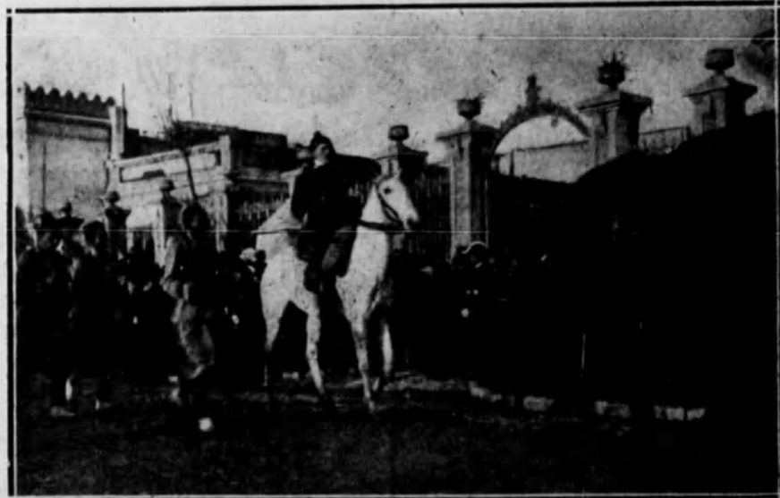
Las tropas moras de Regulares desfilando ante el general Berenguer, fundador y organizador de este Cuerpo.