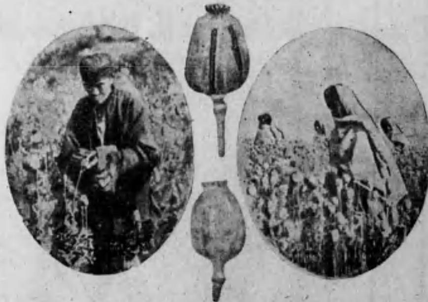
Recolector chino haciendo la incisión en la cápsula verde de las adormideras. Cápsula verde de adormidera mostrando la cisura por donde se le exprime el jugo.—Cápsula seca de adormideras, en cuyo interior contiene los granos de la simiente.—Jóvenes chinas haciendo la recolección en un campo de adormideras.

Ni místicos, ni héroes, ni piratas, ni locos, ni poetas, ni rebeldes. El dios Mediocre anatematiza todo lirismo, toda ensoñación, toda es-