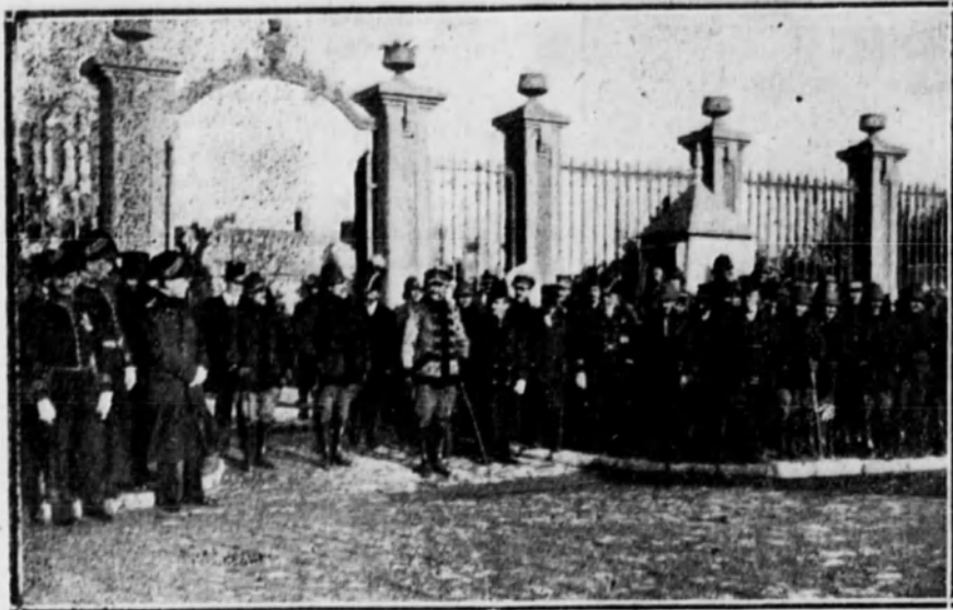
El general Berenguer con su Estado Mayor, diplomáticos y autoridades civiles de la plaza, durante la revista militar celebrada en su honor en Tetuán.