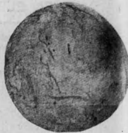
Bola de opio sin refinar ni preparar, de que se surte el comercio en gran escala.

piritalidad: los lunáticos, los románticos, los visionarios son condenados a morir en la «Gloria de los ahorcados». La Humanidad tiene que convertirse a la fuerza en un gran rebaño sano y pacífico. La Ciencia quiere la higiene para hacer razas fuertes, pero eunucos; para que no haya nunca en la manada-reses que se