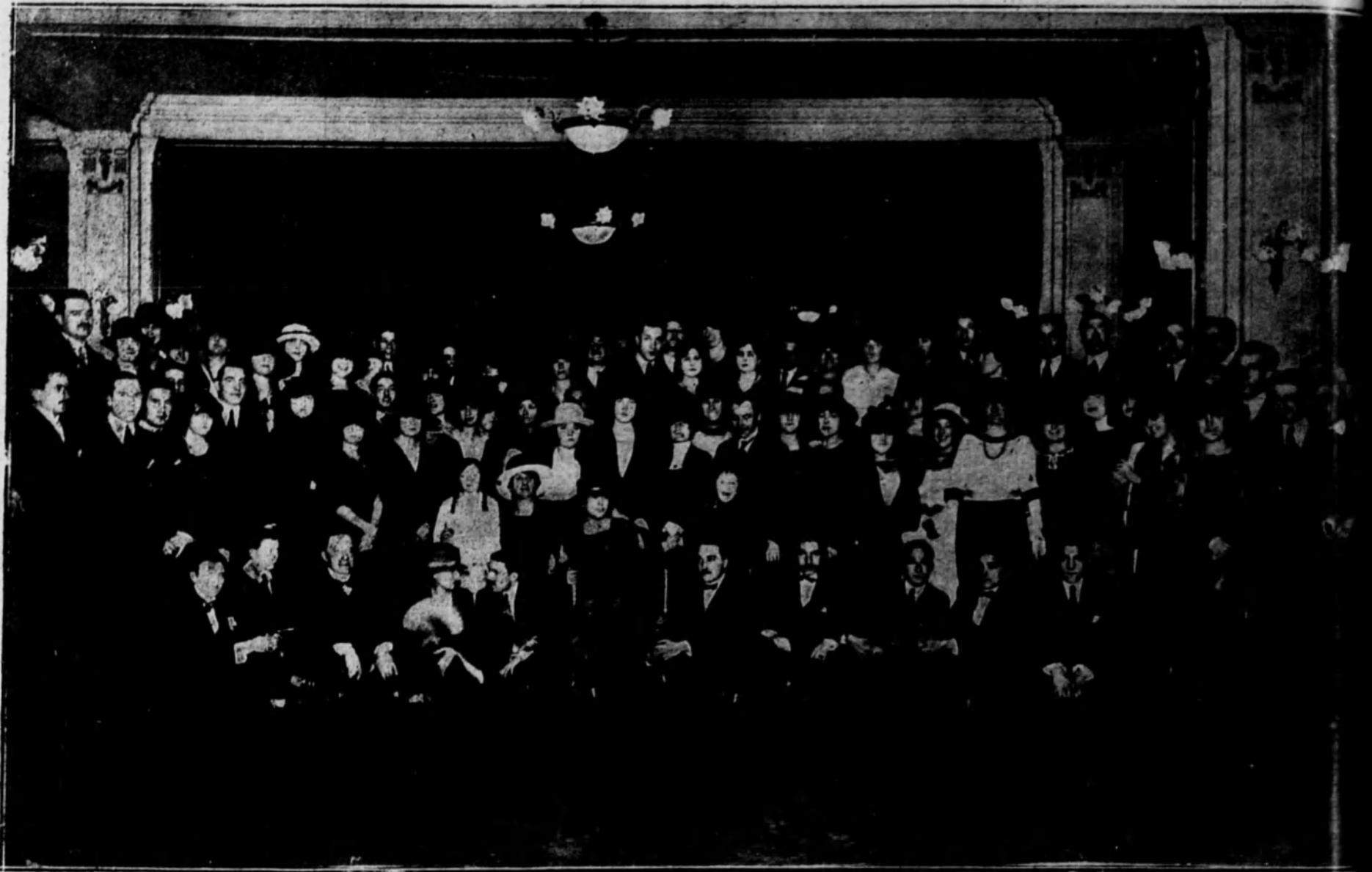
Grupo de asistentes al té de la Sociedad Francesa, celebrado ayer en el Palace Hotel.