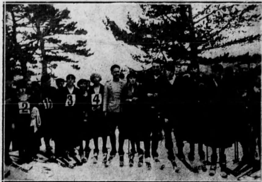
Algunas de las parejas que tomaron parte en la carrera de «skis».