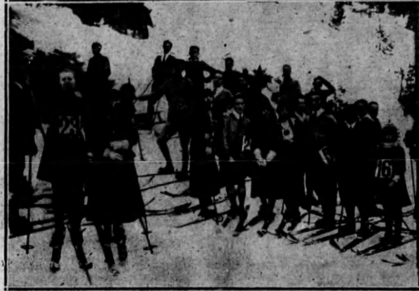
Otro grupo de corredores momentos antes de empezar las carreras.