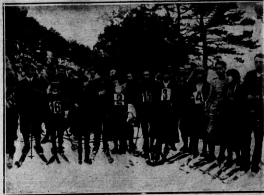
Los corredores momentos antes de la salida.