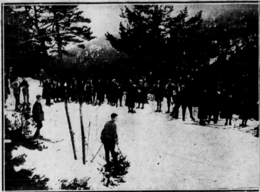
El publico esperando en la meta la llegada de los corredores.