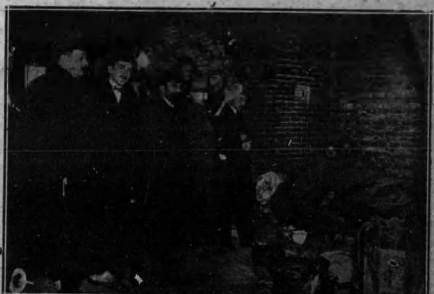
El gobernador con los señores médicos y periodistas en el interior del antiguo horno «La Tinaja».