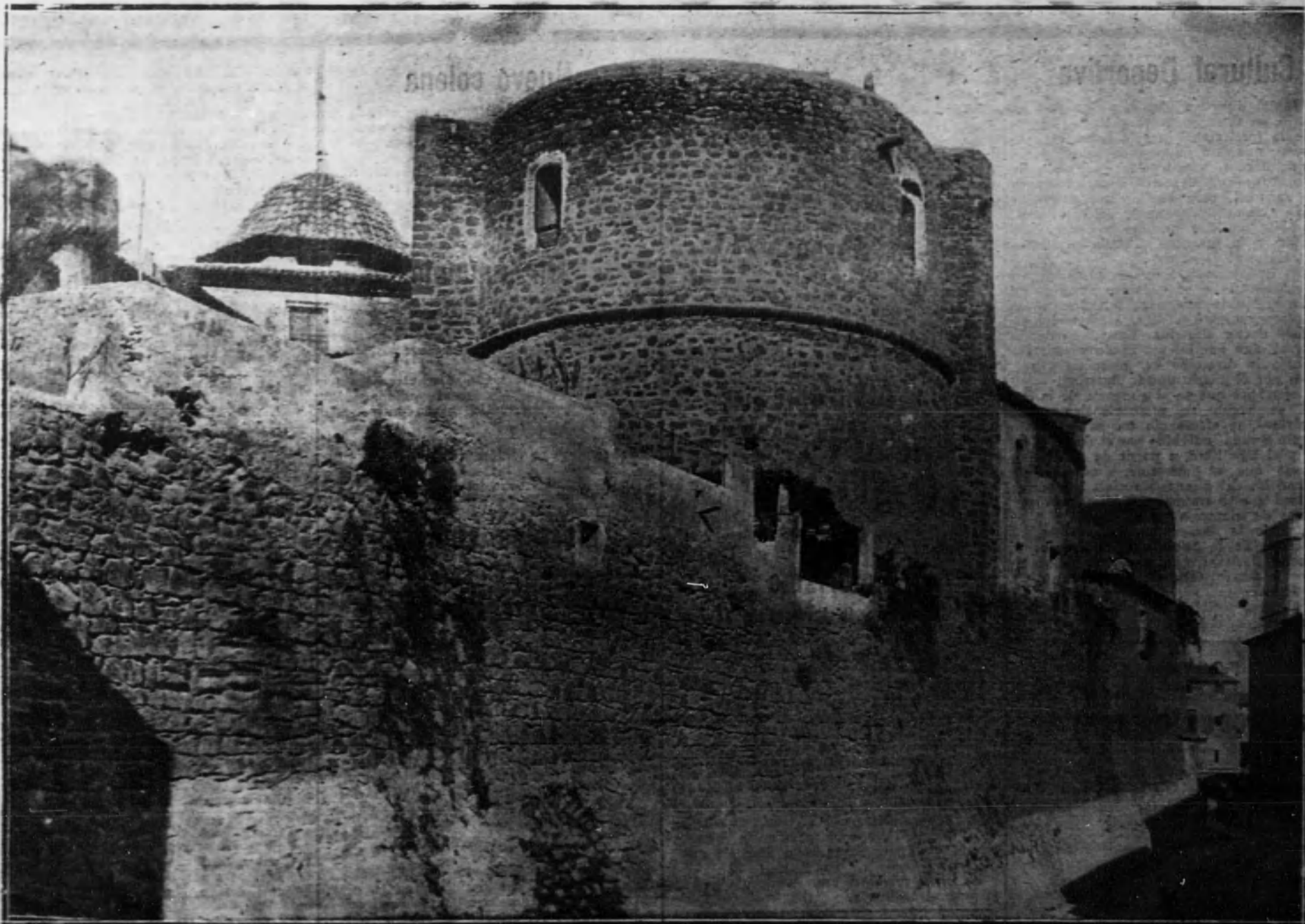
Aspecto de la muralla de la calle del Mar y vista del ábside de la iglesia parroquial de Villajoyosa (Alicante).