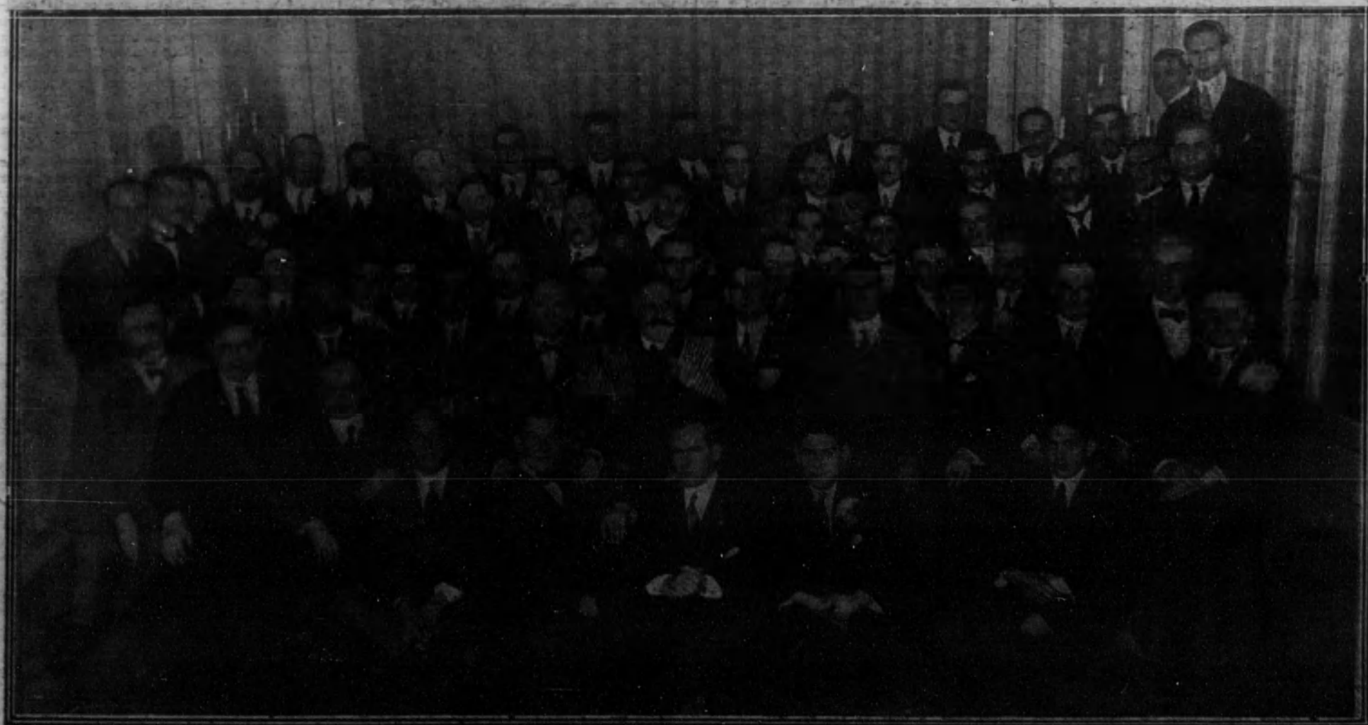
Personal de la Misión.