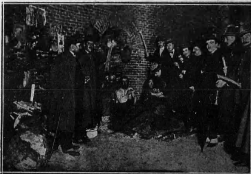
Los médicos vacunando, en presencia del gobernador, a una de las familias instaladas en «La Tinaja».