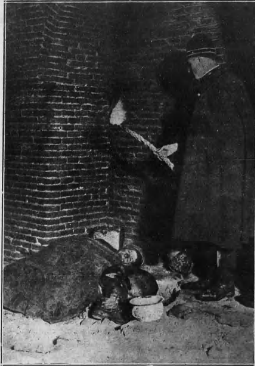
Una pordiosera que fué vacunada durante la excursión nocturna.

Para ello, y con el propósito de que los que allí duermen no pudieran huir burlando el