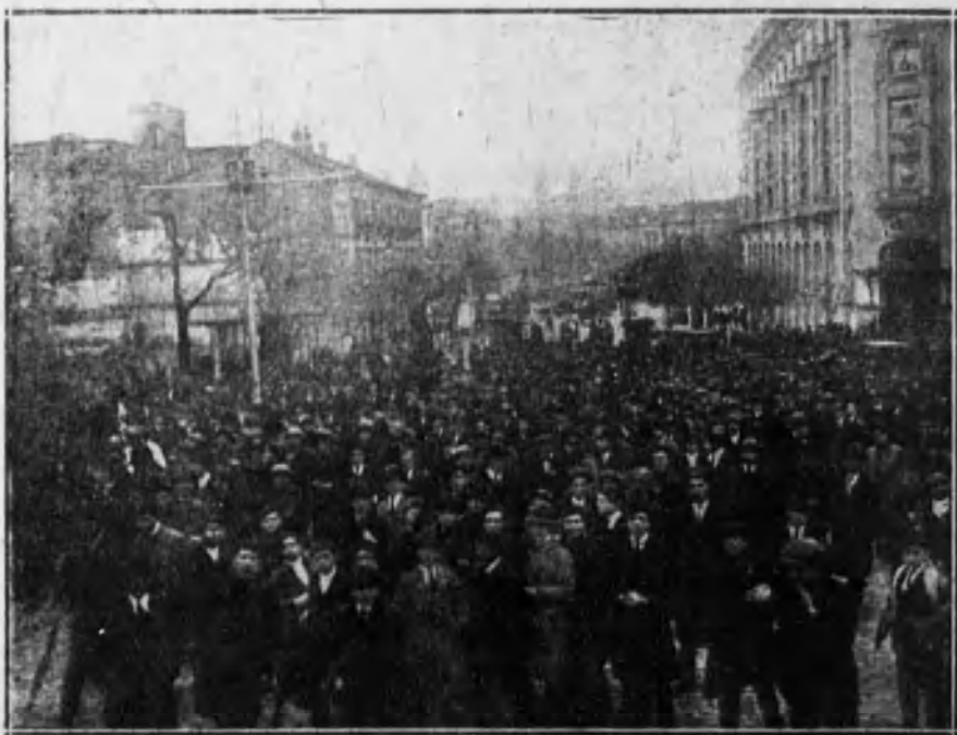
La manifestación estudiantil detenida en los alrededores del Congreso.