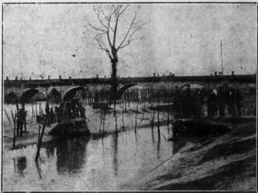
Restos del pequeño Puente Verde, que también este año, como en anteriores inviernos, ha sido arrasado por la crecida de las aguas del Manzanares.

La necesidad de dedicar esta crónica al concurso de carteles, nos obliga a demorar hasta el próximo jueves el homenaje que debemos a la obra del gran artista sueco Carl Larsson, fallecido estos días.