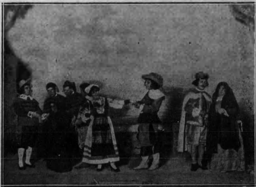
Una escena del drama cómico titulado «El pintor flamenco», estrenada con buen éxito en el teatro Cómico.