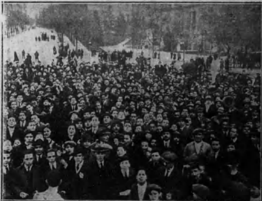
La manifestación al pasar por la plaza de Neptuno.

Los estudiantes de la Universidad de Madrid pidieron ayer permiso a los respectivos catedráticos para abandonar las aulas en señal de protesta por los sucesos de Granada y sentimiento por la desgracia ocurrida a algunos escolares.