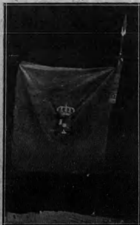
Bandera que por suscripción popular de los jefes de Asturias fué regalada al regimiento del Príncipe, número 3, cuya entrega solemne fué verificada en la Catedral Basílica.