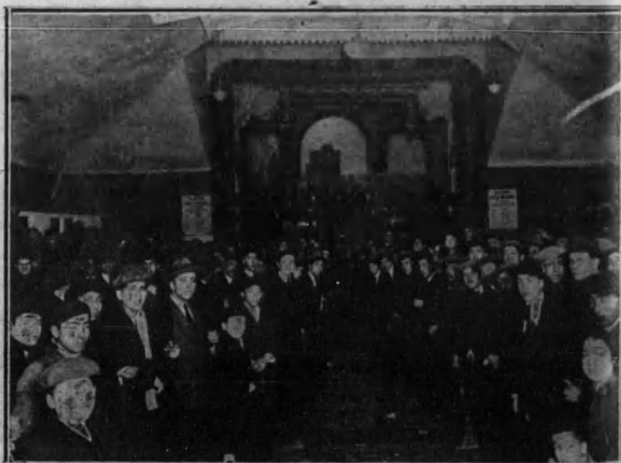
Aspecto de la sala del teatro Madrileño durante el sorteo de los nuevos reclutas, celebrado ayer.