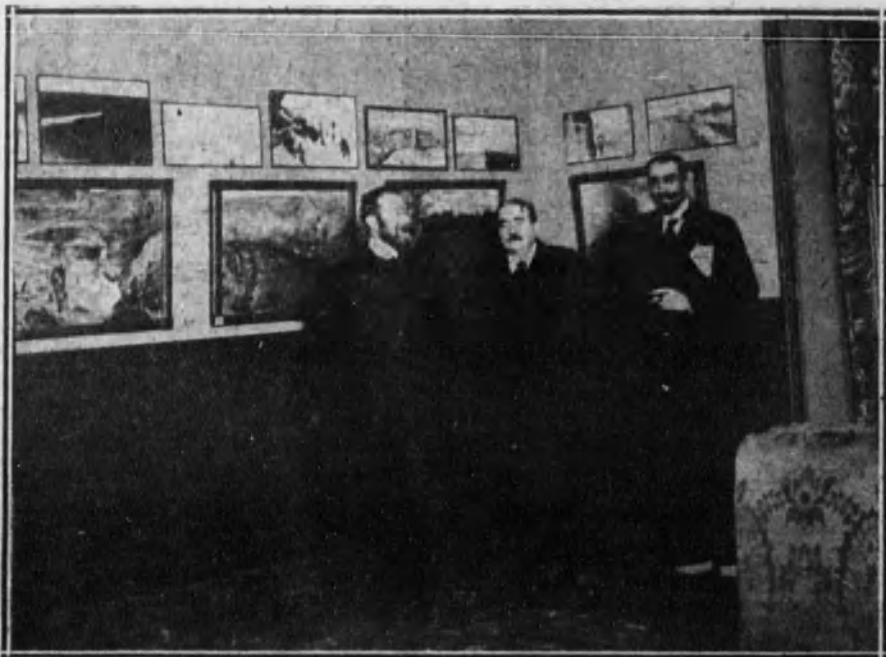
EN EL TEATRO REAL.—Exposición de cuadros y dibujos del eminente pintor italiano Sr. Aristides Sartorio.