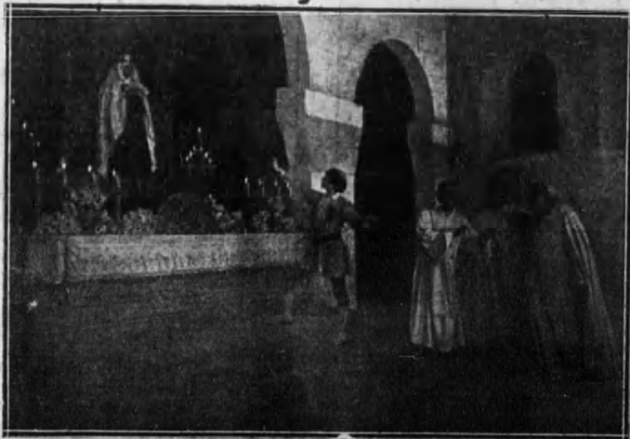
Una escena de la ópera de Massenet, que se ha estrenado recientemente en el teatro Liceo.