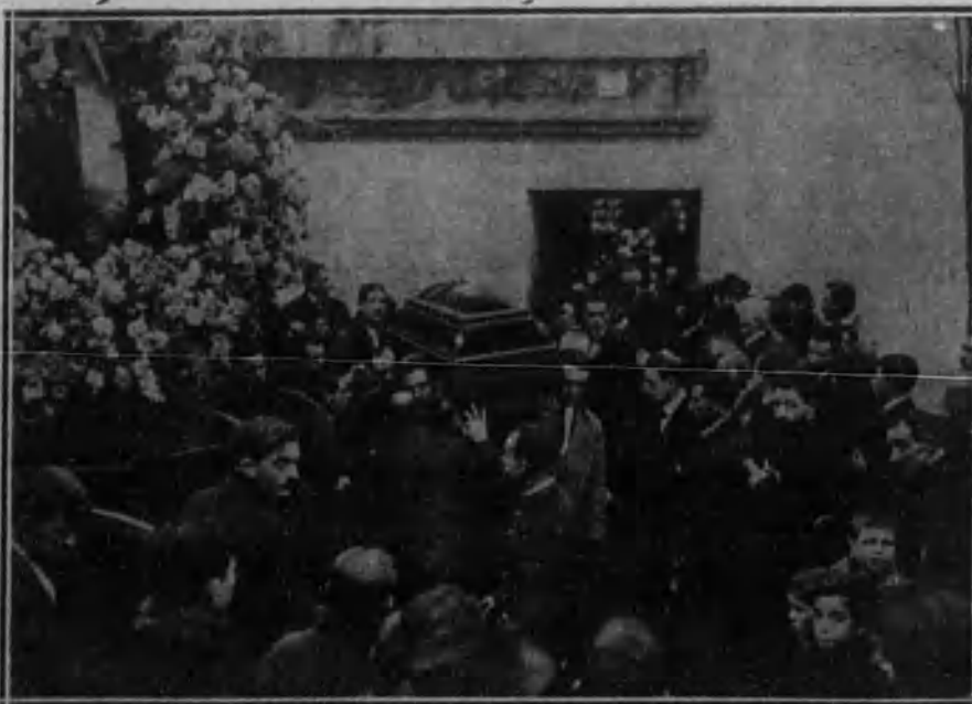
Momento de ser sacado el cadáver del Sanatorio Villa-Luz.

El entierro del genial escultor Julio Antonio ha sido una verdadera manifestación de duelo nacional.