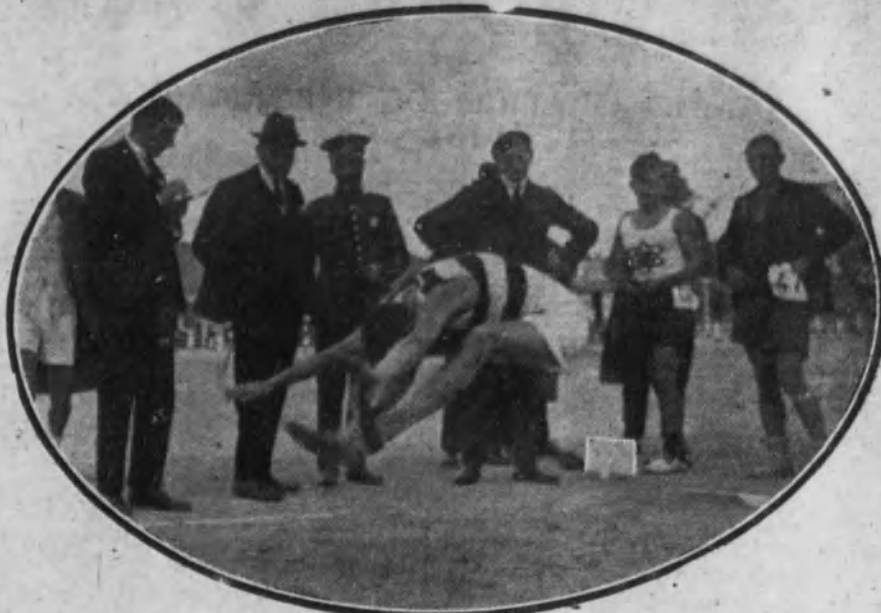
Un salto difícil.

Celosos de que el reparto de la suscripción se realice con toda exactitud, rogamos a nuestros abonados nos comuniquen cualquier anomalía que observen en el servicio, para ponerla inmediato remedio.