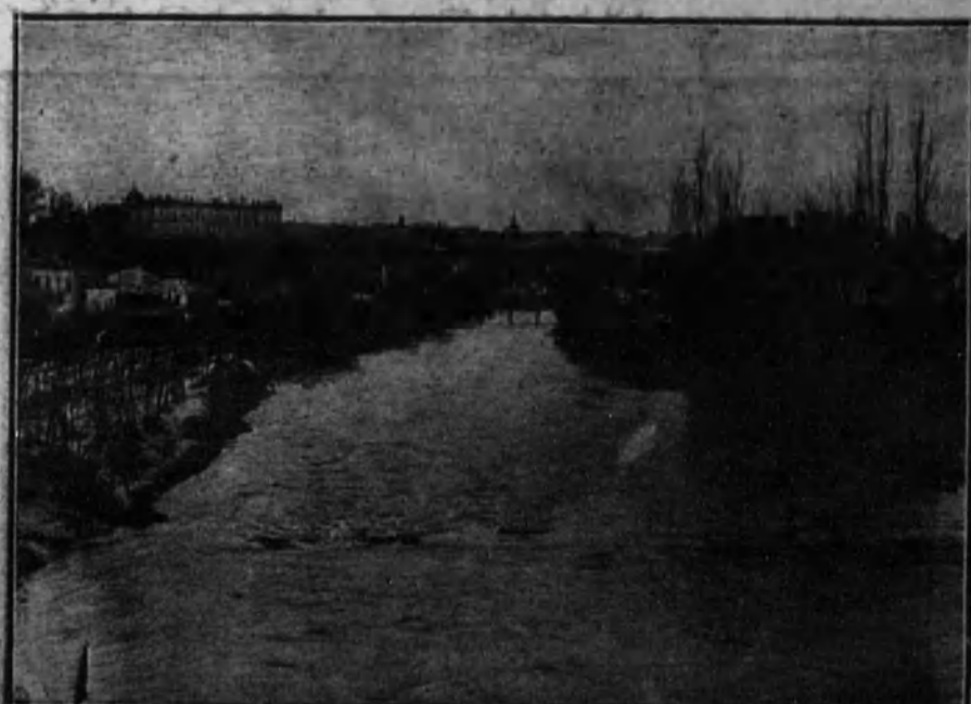
Aspecto de la crecida del río Manzanares, a causa del temporal de lluvias.