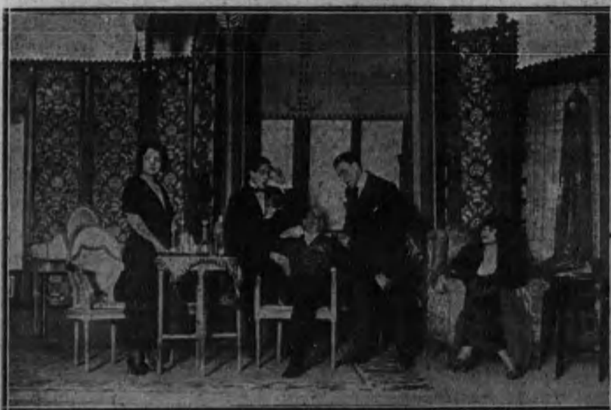
Una escena del «vodevil» «Un contrato leonino», estrenado con éxito en el teatro de Eslava.