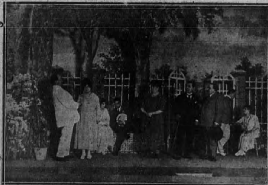
Una escena de la comedia «Tienen razón las mujeres», estrenada con buen éxito en el teatro Infanta Isabel.