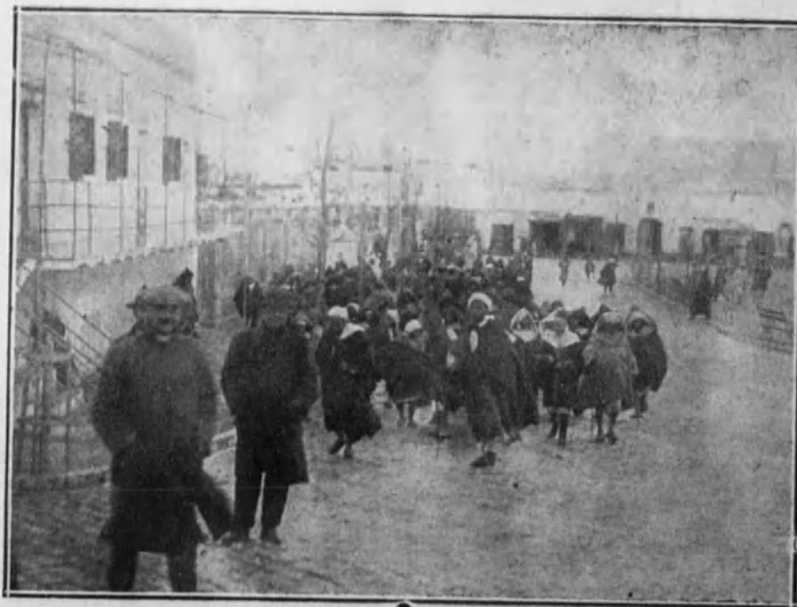
Momento de llegar la comitiva de notables a la residencia-palacio del alto comisario, general Berenguer.