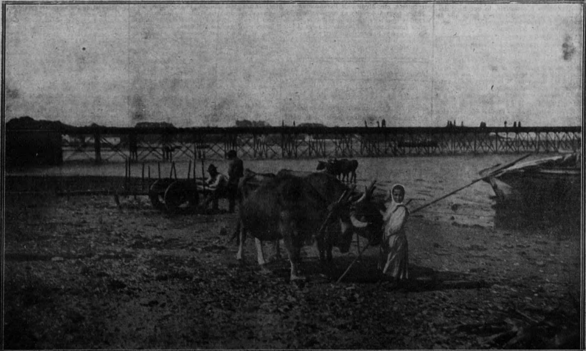
VILLAGARCIA.—Campesinos con las yuntas esperando en la playa la arribada de los barcos.