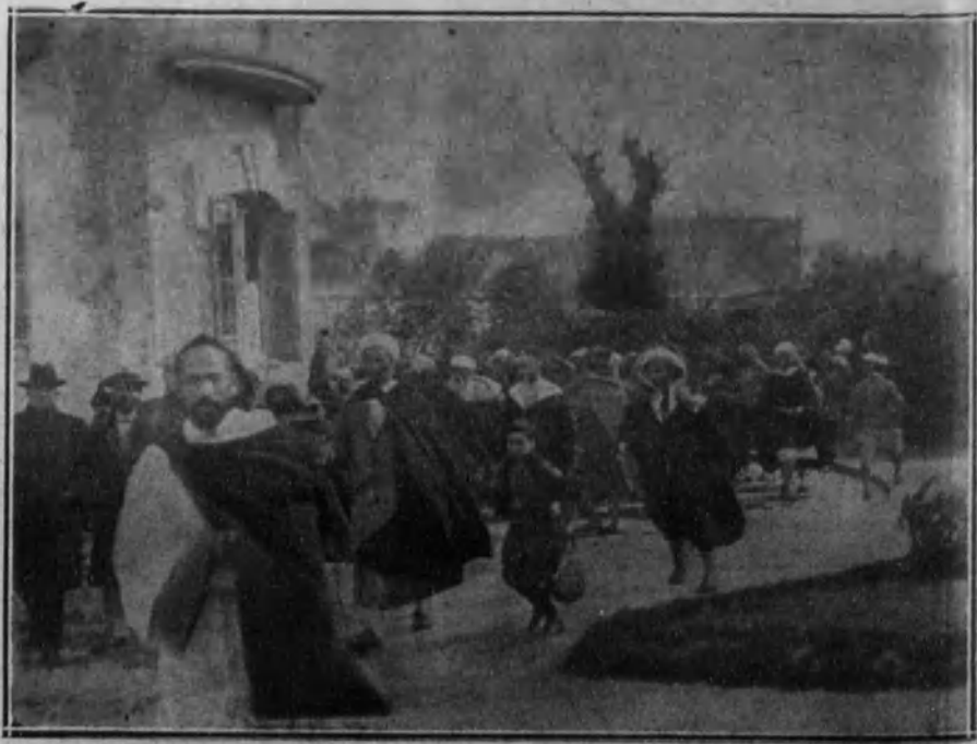
La comitiva de notables de la cabila de Rebáa-el-Gaba, dirigiéndose a presentar sus respetos al alto comisario.