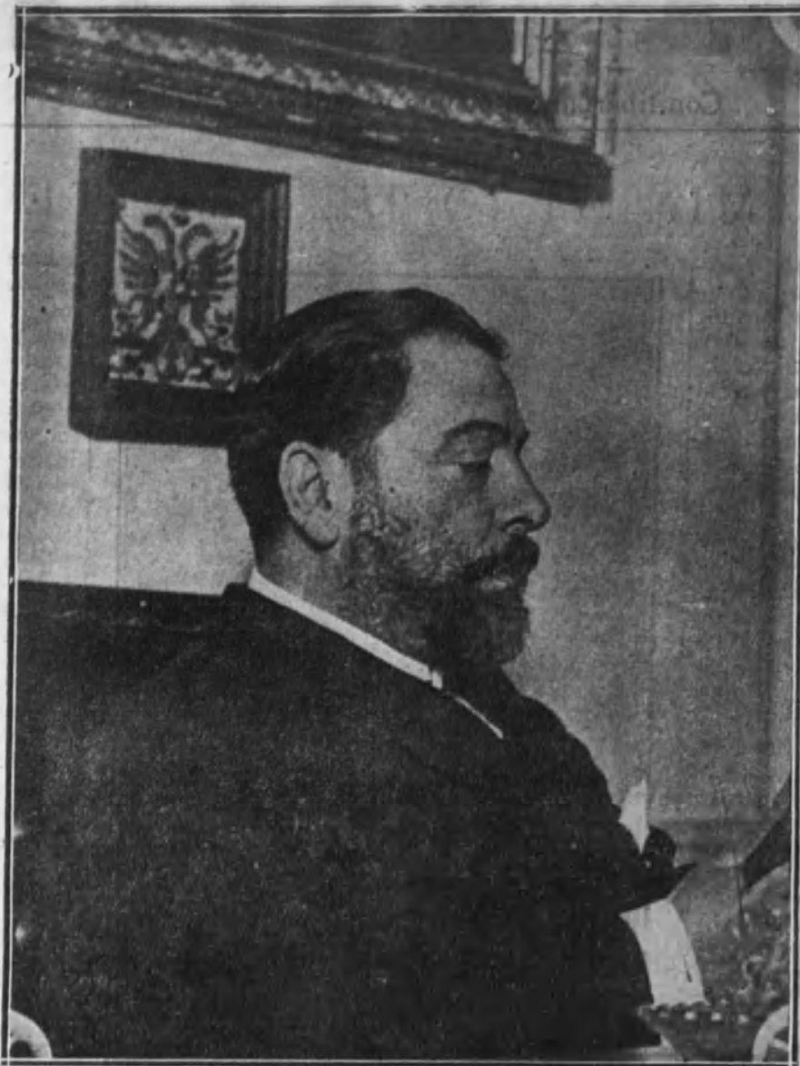
El ilustre ex ministro y periodista D. Julio Burell, que falleció ayer en Madrid.

En esta casa, en donde tanto se le quería y veneraba, el recuerdo de Burell será imperecedero. Pocos días antes de caer enfermo, el maestro había accedido a nuestros ruegos de que su firma valiosísima honrara con frecuencia la primera página de EL FIGARO. Su muerte, traidora, nos ha privado de la inmensa satisfacción de que el maestro de todos fuera nuestro asiduo compañero en la defensa de los grandes ideales y de los supremos intereses de la Patria. Su memoria, sin embargo, vivirá siempre con nosotros, al lado de la admiración y del cariño que durante largos años tuvimos para el amigo entrañable y bondadoso.