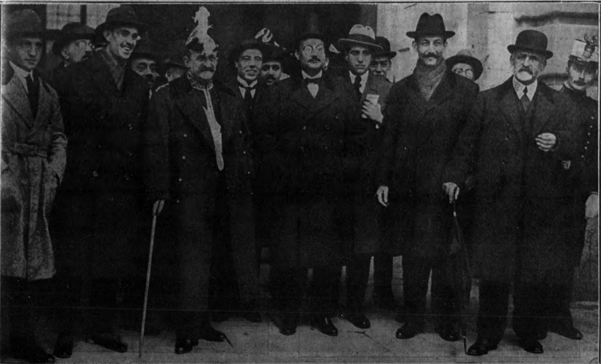
El nuevo ministro de Abastecimientos, D. Leonardo Rodríguez, al salir de Palacio, acompañado del conde de Romanones, después de haber jurado el cargo.

Tal es el hombre. El ministro aparecerá en seguida, armado de todas armas, cuyo mejor temple es la férrea voluntad de cumplir con su deber.