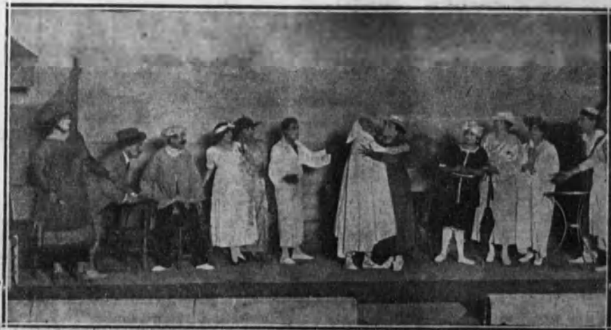
Una escena de la zarzuela «Santander Hotel», que se ha estrenado con buen éxito en el teatro de la Zarzuela.