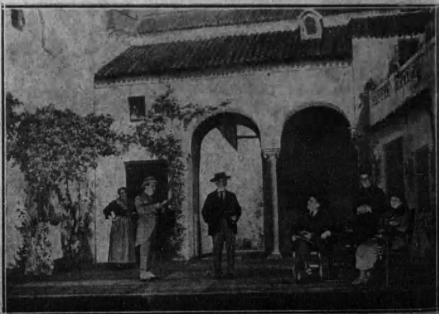
Una escena de la comedia «La calumniada», estrenada con buen éxito en el teatro de la Princesa.