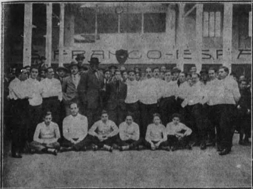
SANTANDER.—Jack Johnson acompañado de los socios de la Unión Deportiva Montañesa, en los salones de «El Alcázar».

De España, y en particular de la capital norteña, el afamado campeón lleva un grato recuerdo de afectuosa hospitalidad.