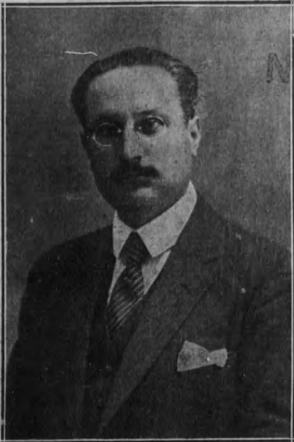
Excmo. Sr. D. Leonardo Rodríguez, nuevo ministro de Abastecimientos

El ministerio de Abastecimientos es en las circunstancias presentes el más trabajoso y el que mayores esfuerzos necesita. Los problemas y las soluciones se acumulan sobre él con el inaplazable carácter de una urgencia vital. No hay tiempo para estudiar largamente; sólo lo hay para resolver sin demora asuntos interesantísimos, de los cuales depende la vida interior del país y el funcionamiento de las energías nacionales, atacadas de una crisis agudísima, que no consiente dilaciones ni esperas: la crisis del hambre