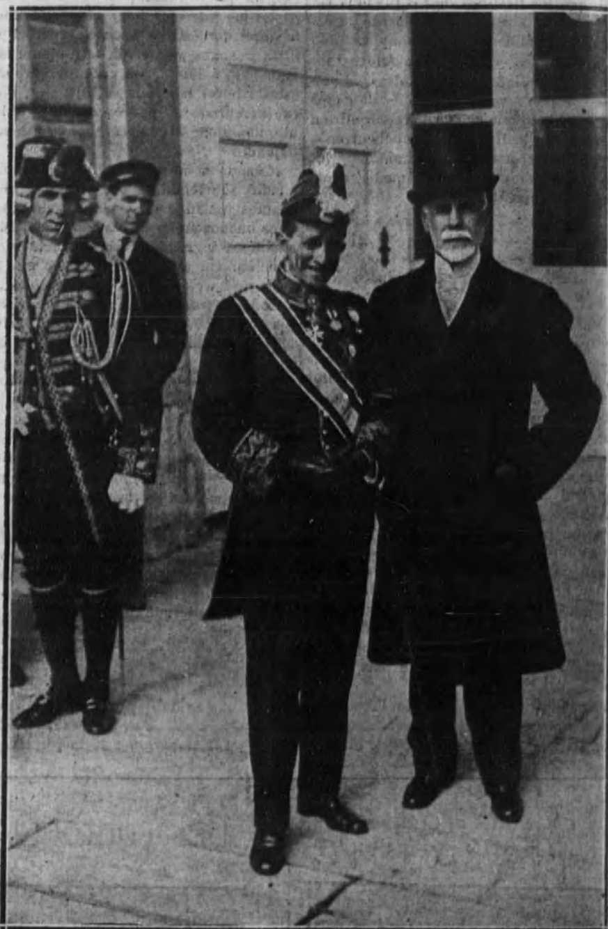
El nuevo ministro de Portugal, Sr. Teixeira, con el introductor de embajadores, al salir de Palacio, después de haber presentado sus cartas credenciales a Su Majestad el Rey.

Ayer presentó sus credenciales a S. M. el Rey, con el ceremonial de costumbre, el nuevo ministro de Portugal, Sr. Teixeira Gomes.