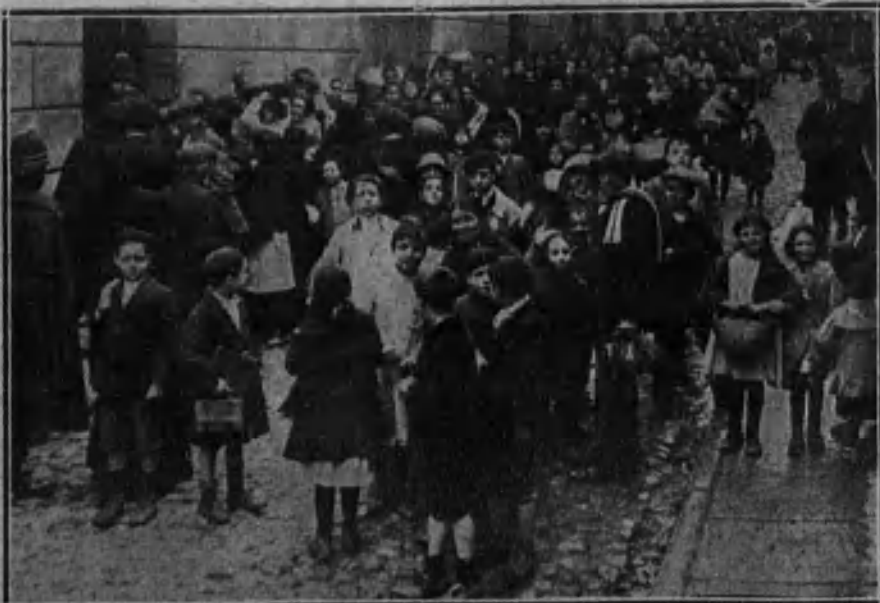
El público formando «colas» a la puerta de la tenencia de Alcaldía de la calle de la Cabeza, para adquirir el pan.