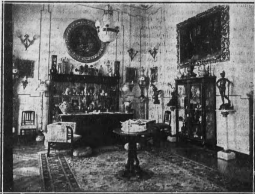
Uno de los ángulos de los salones, con la exposición de numerosísimos objetos de arte.