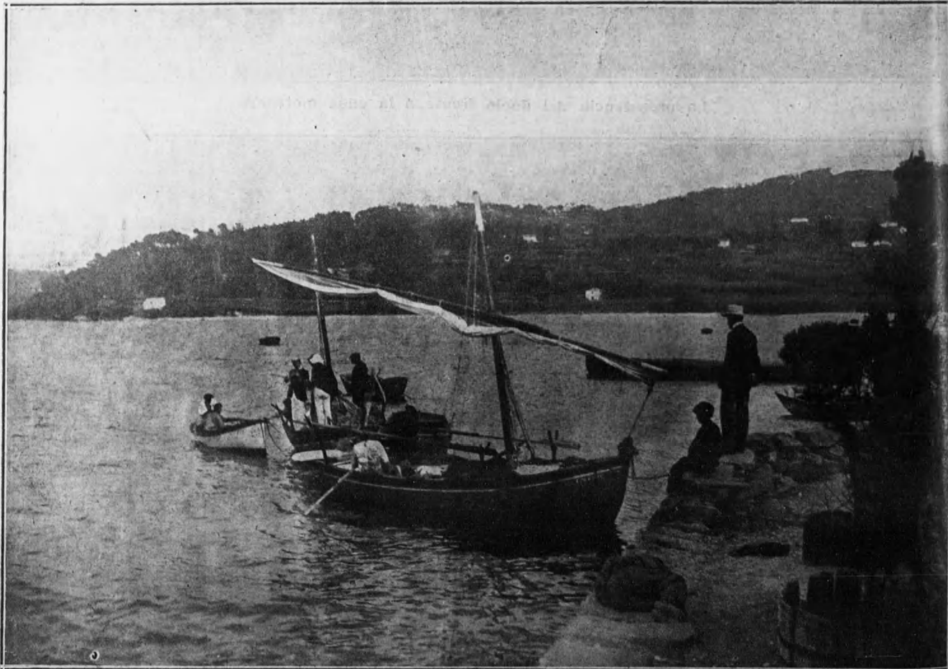
PONTEVEDRA.—Bello aspecto del paisaje a orillas de la ría.