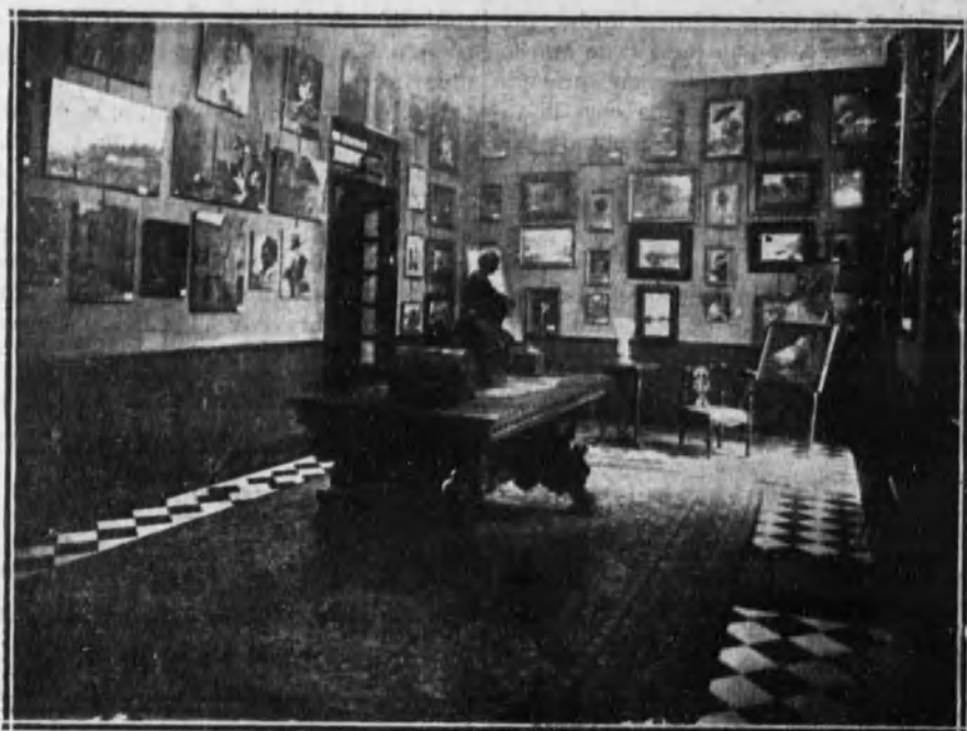
Gran sala donde se exhiben notables cuadros de prestigiosas firmas.