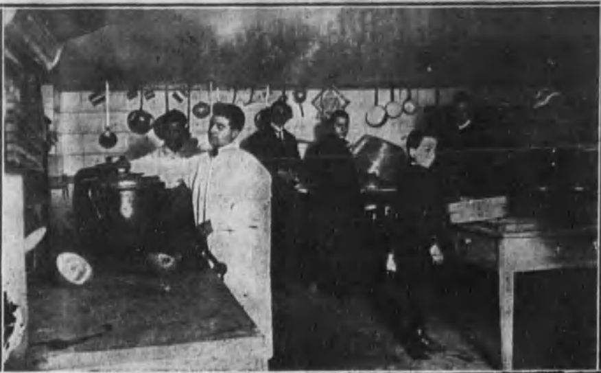
Aspecto de la amplia cocina instalada con todos los adelantos de la higiene culinaria.

Además de la sopa y del plato de legumbres secas con carne, chorizo y tocino, habrá huevos y caldo para ancianos, biberones para niños, cordiales para enfermos y carne para extenuados. En el comedor de vergonzantes