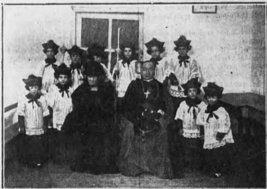
La duquesa de San Carlos con el obispo de Madrid-Alcalá y las niñas que representaron la pieza cómica «Coro de monaguillos», en la fiesta celebrada por la Caja dotal de La medalla Milagrosa.

MADRID. - En la Casa de Misericordia de San Alfonso.