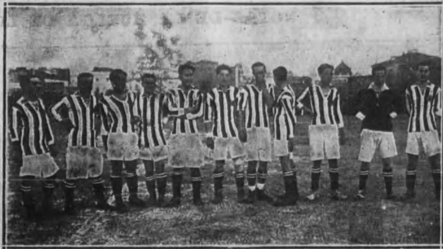
El equipo de la Gimnástica.

Muguerza, en la vuelta final al citado campo, hizo magníficamente; pero advertido