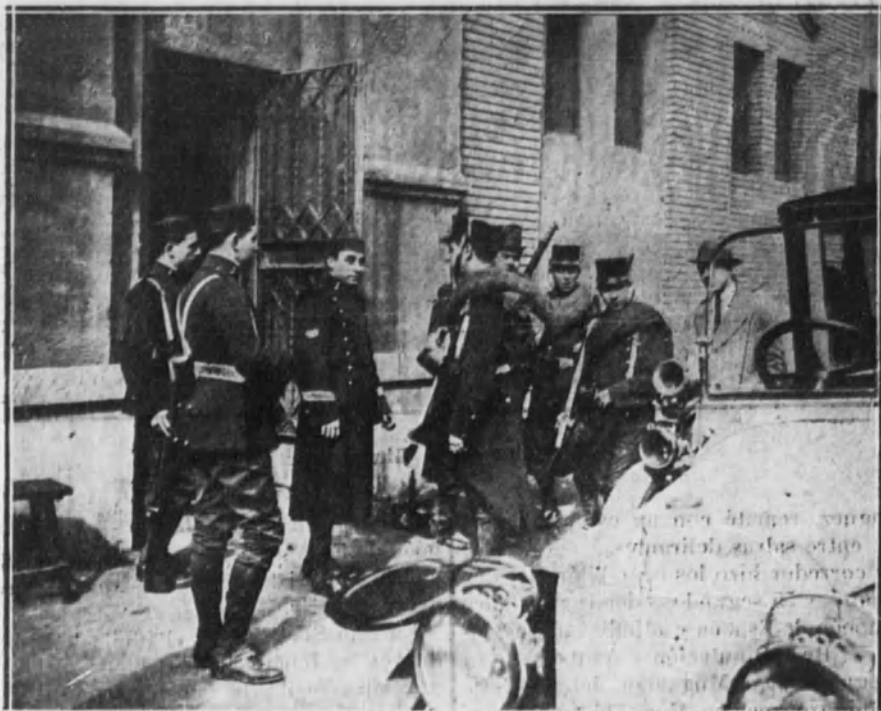
Fuerzas del Ejército custodiando la fábrica de electricidad La Barcelonesa.

NOTAS DE LA HUELGA DE LOS OBREROS DE "LA BARCELONESA"