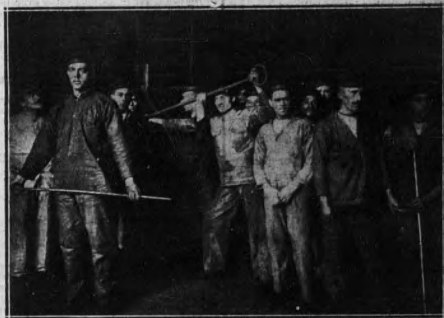
Los marineros del acorazado «Alfonso XIII» prestando servicio en las calderas de la fábrica La Barcelonesa.