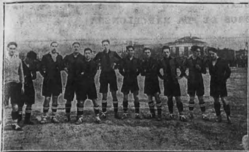
El equipo del Racing.