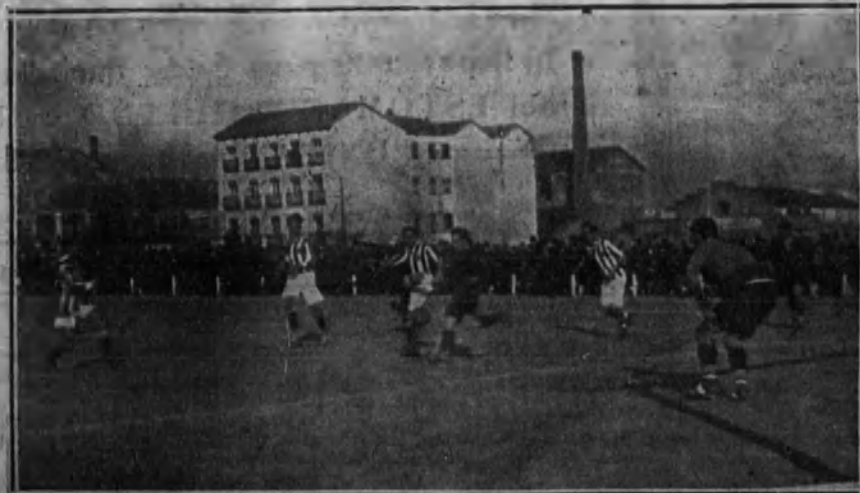
Una jugada interesante.

No hay anuncio caro si es eficaz. El anuncio más eficaz es el más caro.