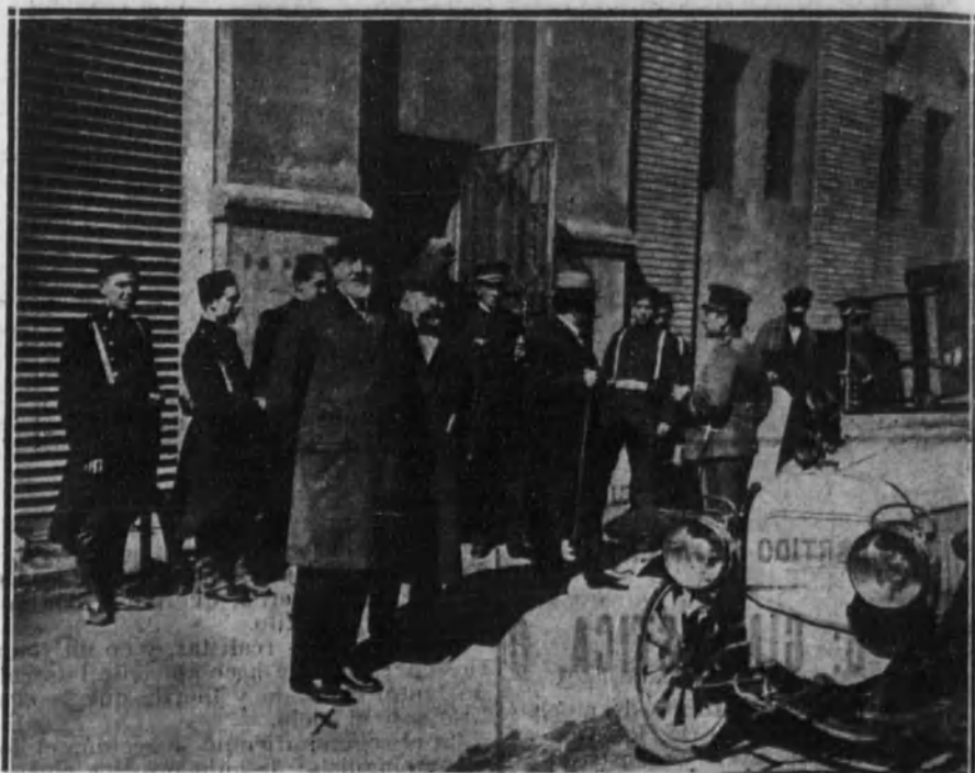
El gobernador x de Barcelona y el personal de la Compañía La Barcelonesa, después de haber hecho una inspección en las naves de las máquinas.

MADRID. - En la Casa de Misericordia de San Alfonso.