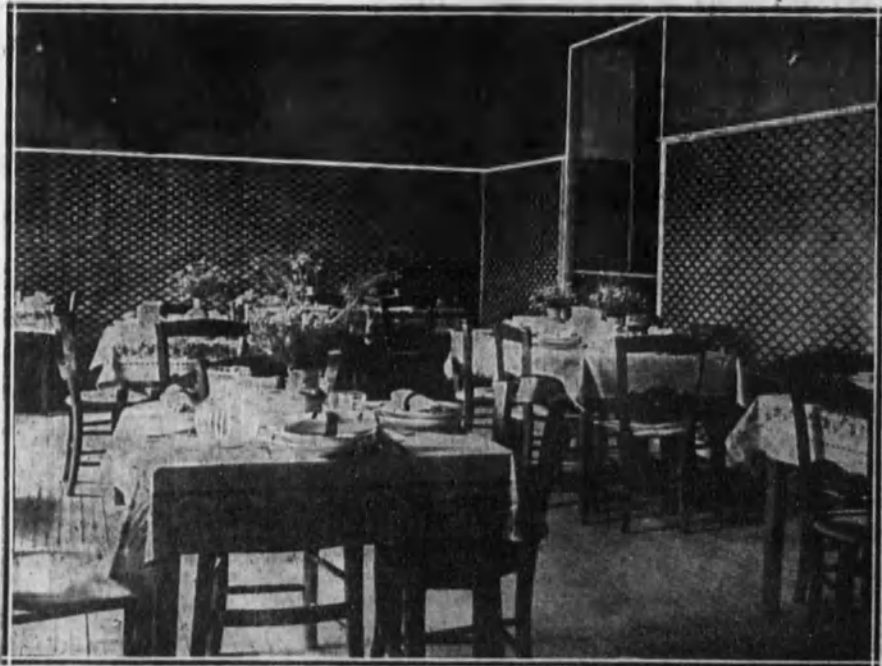
Aspecto de uno de los comedores de mesas pequeñas.

Serán inaugurados tan pronto como sea posible. Faltan pequeños detalles y tal vez pueda ser cuestión de horas.