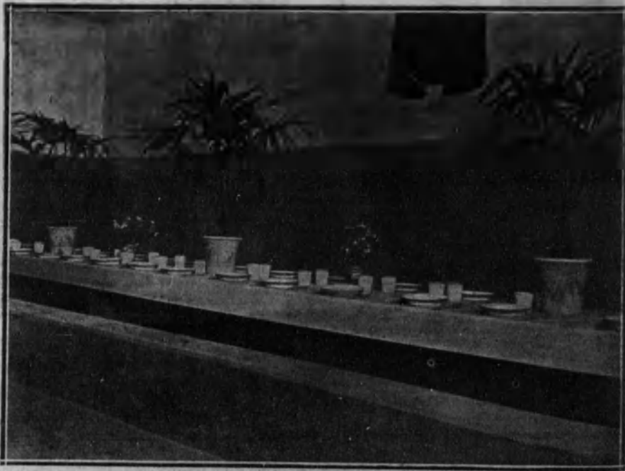
Angulo de uno de los comedores.