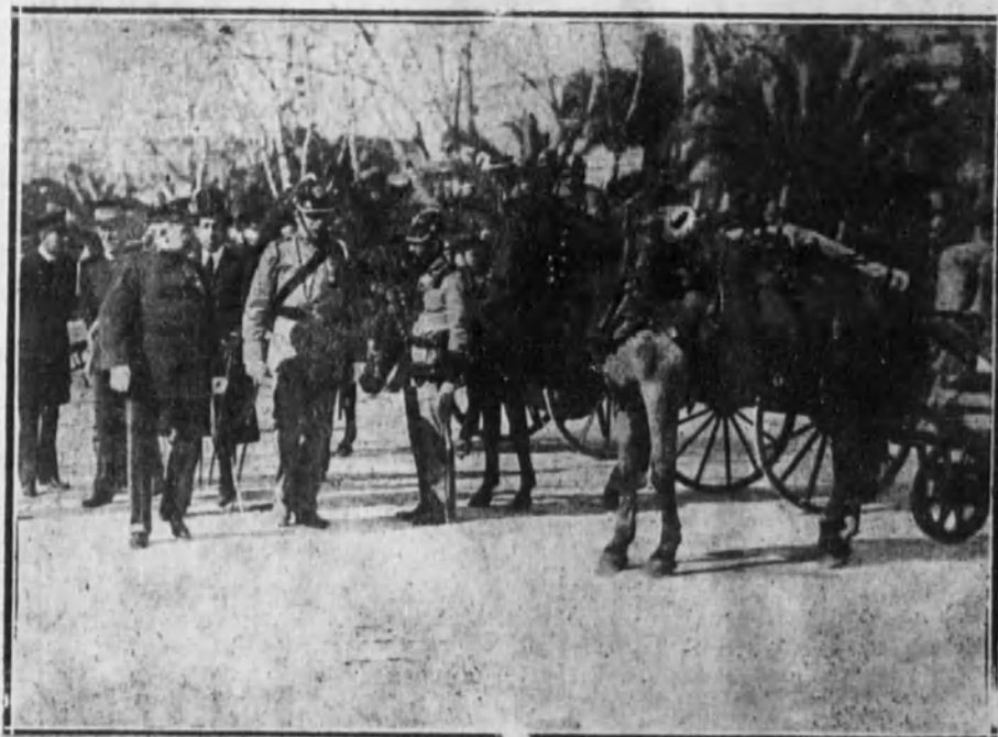
MALAGA.—El general Sr. Jiménez Pajarero con otras autoridades civiles, pasando revista al Cuerpo de bomberos y al material.