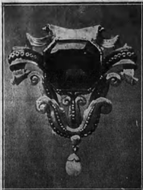
Imperdible. (Ramón Sunyer.)