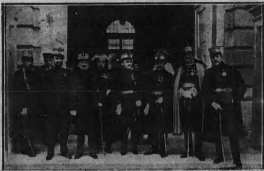
Grupo de jefes y oficiales de la promoción de 1894, que han presentado al Rey sus respetos para darle gracias por el retrato que ha dedicado a dicha promoción.