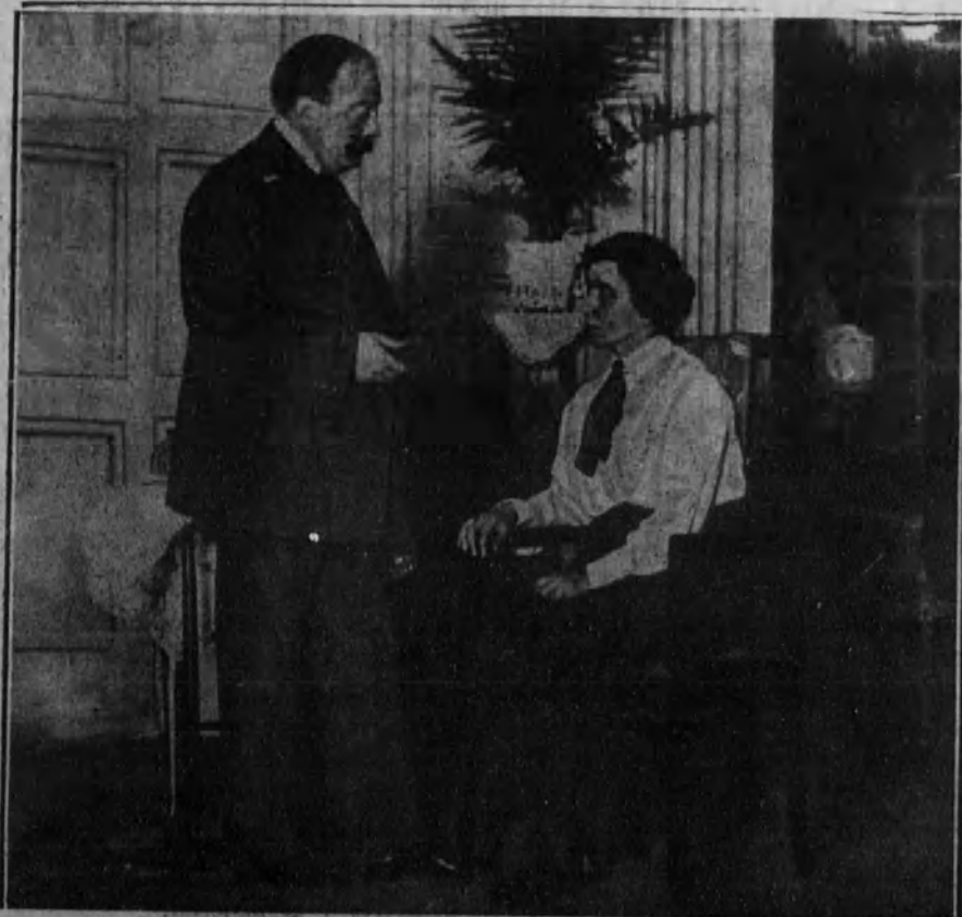
Una escena de «La comedia del honor», estrenada con gran éxito en el teatro del Centro.