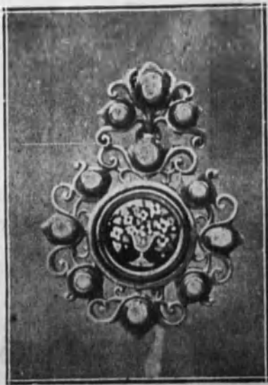
Imperdible. (Ramón Sunyer.)