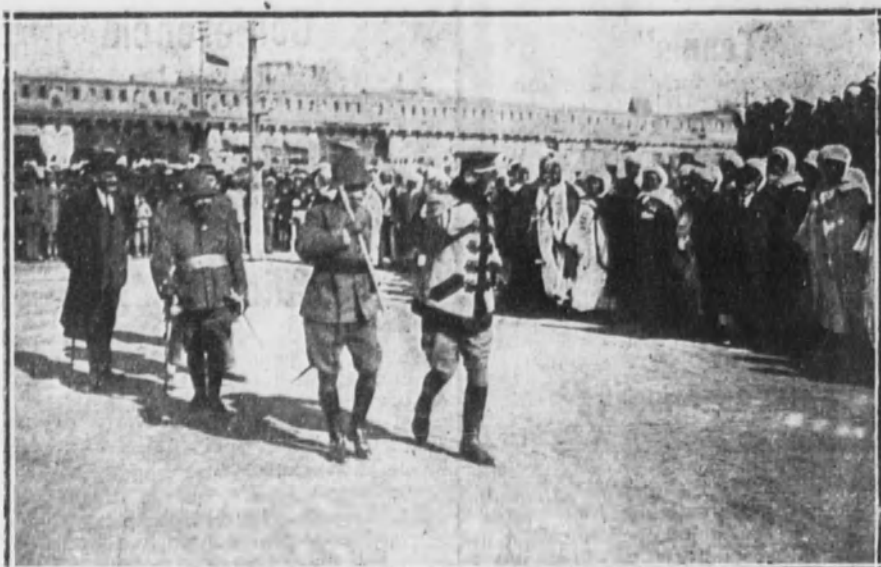
Los generales Berenguer y Aizpuru saludando a los moros que esperaban la llegada del alto comisario en esta plaza.