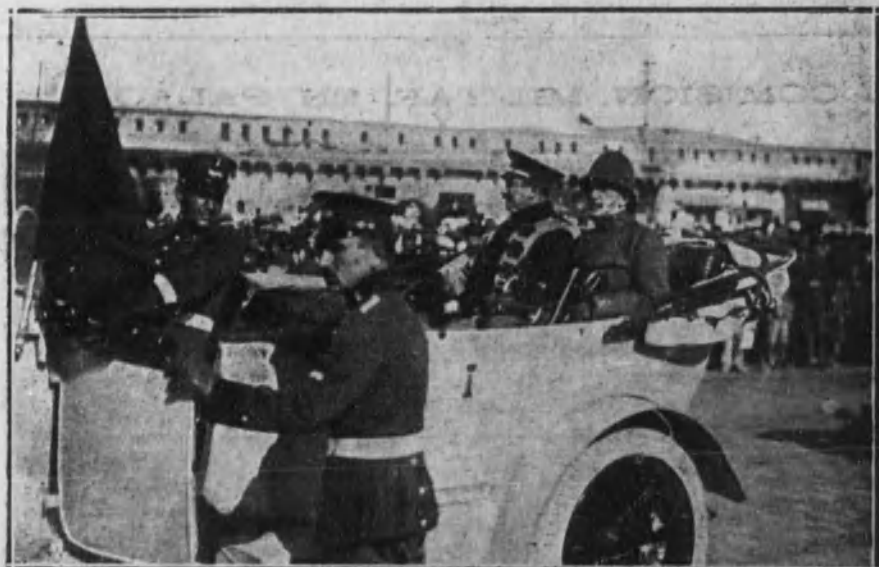
Los generales Berenguer y Aizpuru dirigiéndose a la Comandancia general.