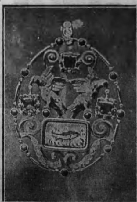
Pendentif. (Ramón Sunyer.)