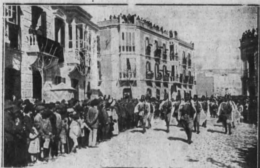
Las fuerzas regulares indígenas desfilando ante el general Berenguer, a su llegada a Melilla.