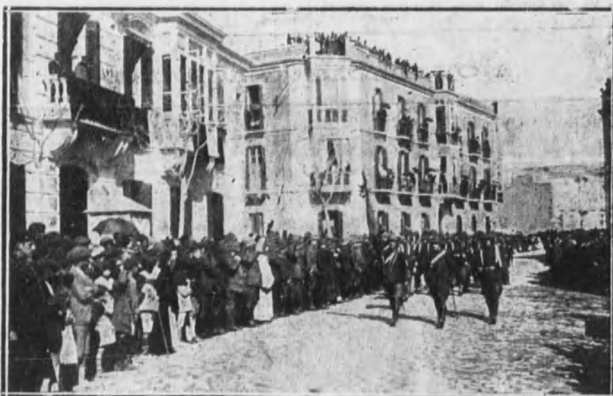
La bandera del regimiento de Artillería desfilando ante el general Berenguer.