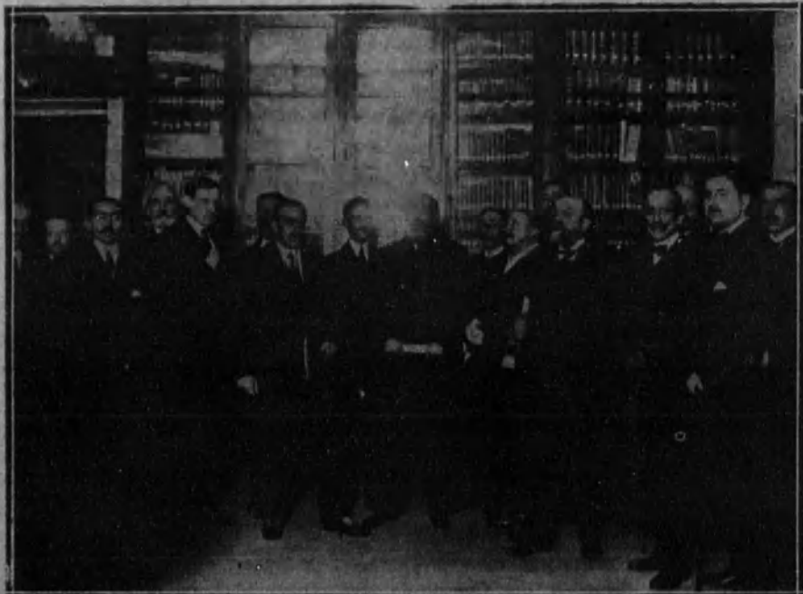
Señores que forman la Junta de Acción Nobiliaria, reunidos en el local donde funciona esta Corporación.