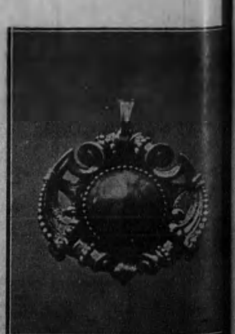
Pendentif. (Ramón Sunyer.)