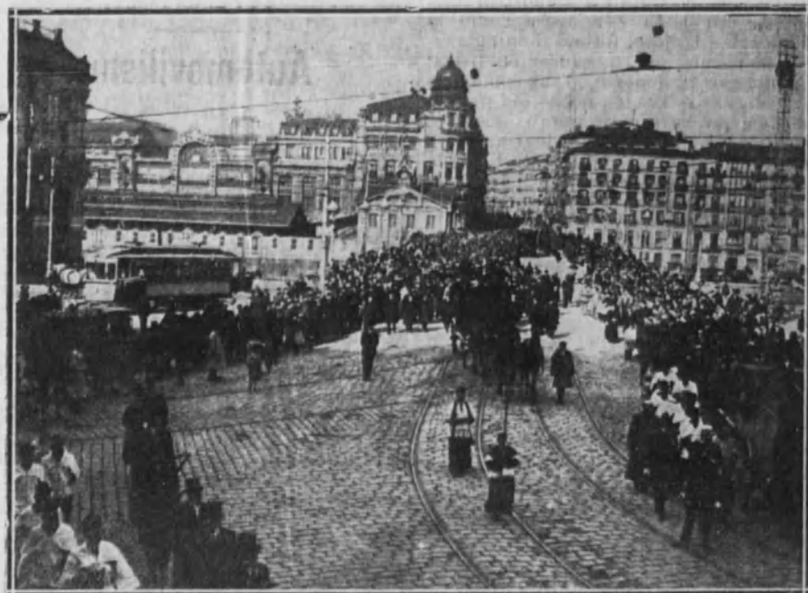
La comitiva a su paso por el puente de Isabel II.