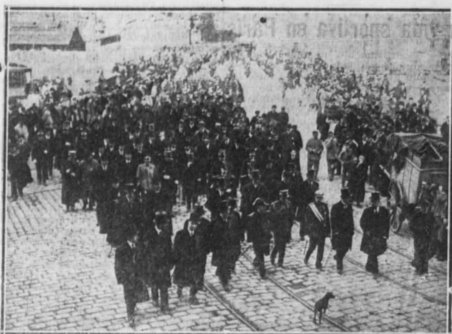
Presidencia del duelo y acompañamiento.