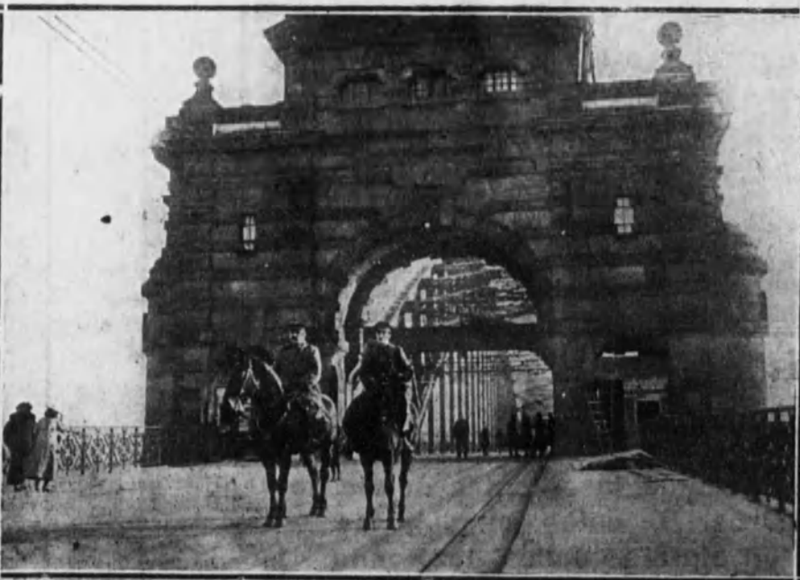
El mayor belga Killemont, cemandante interino de Obercassel (Alemania).