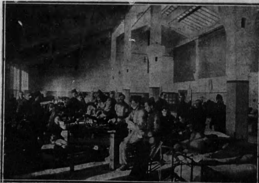
Compañía de cazadores instalada en una fábrica de municiones en Obercassel (Alemania).