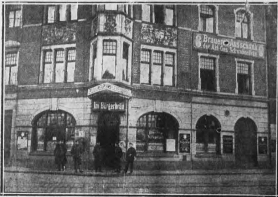
Una cervcería de Obercassel (Alemania) convertida en Círculo de una compañía de cazadores belgas.