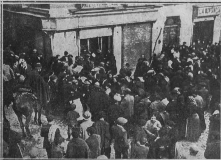
Guardias de Seguridad tratando de contener a los asaltantes a una tienda de comestibles.