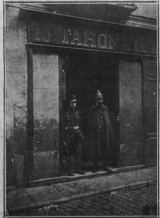
Un soldado y un guardia de Seguridad en la puerta de una tahona, después de haber sido asaltada.