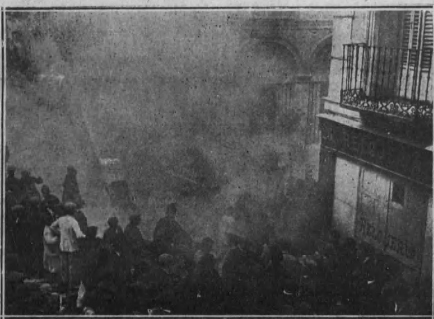
Incendio de una tahona en la calle de la Palma, producido por los revoltosos.