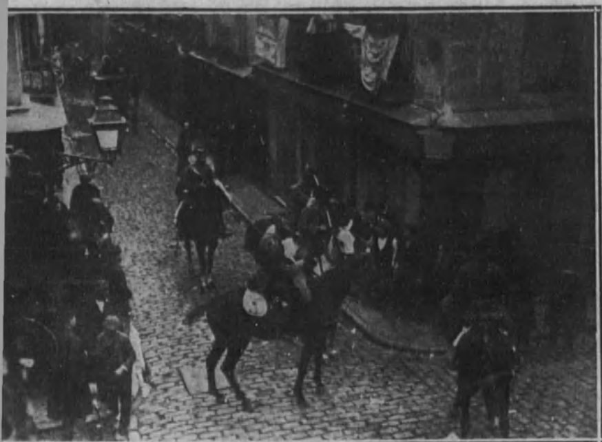
La Guardia civil deteniendo a unos revoltosos al intentar asaltar una panadería.