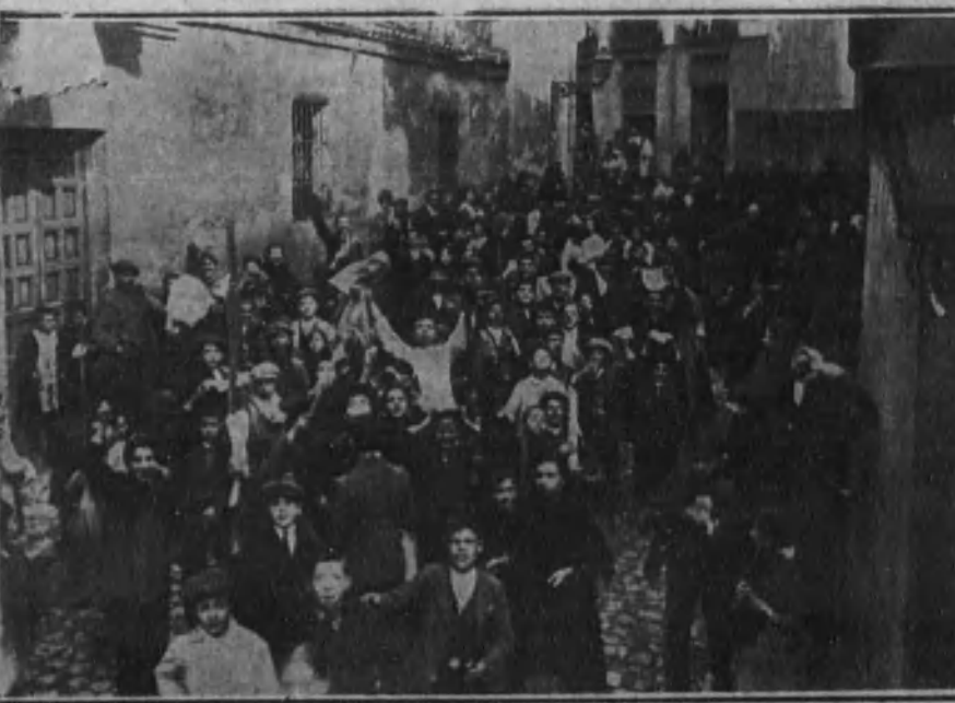
Grupo de muchachos mostrando varios de los productos del saqueo.