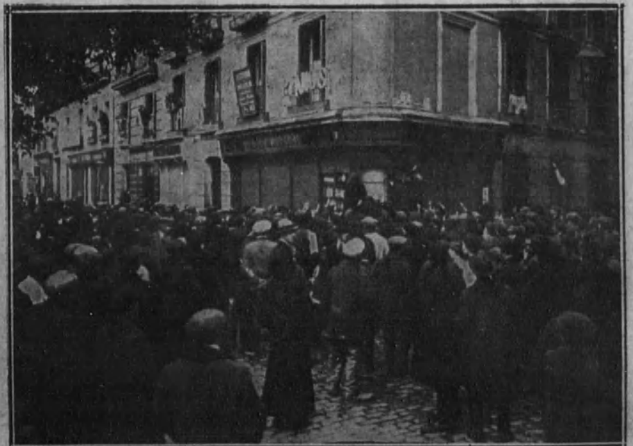
La multitud asaltando una tienda de comestibles.