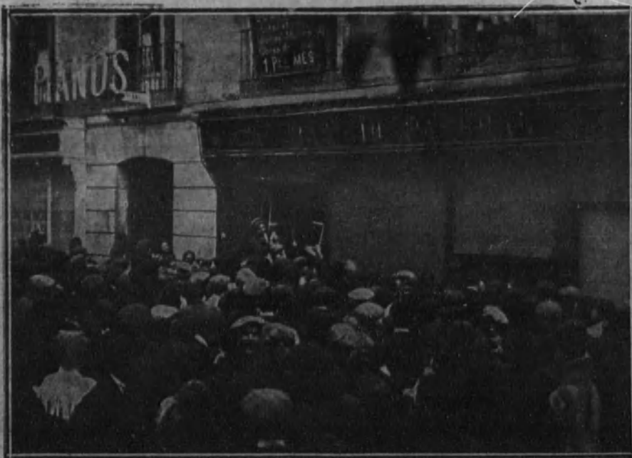
Los revoltosos saqueando una tienda de comestibles.