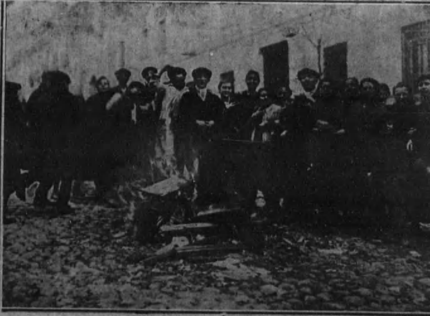
Grupo de asaltantes viendo arder los enseres de una tahona.

Recogemos en esta plana varias notas gráficas de los sucesos ocurridos en el día de ayer, en el que se produjeron las manifestaciones públicas de protesta contra el encarecimiento de las subsistencias y los conflictos planteados por la huelga de panaderos