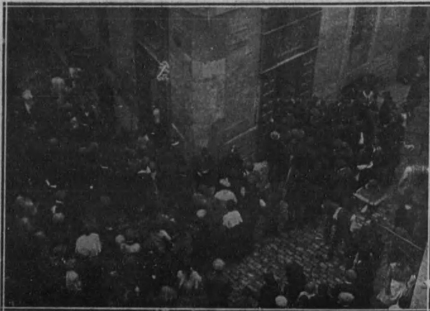
El público asaltando una tahona en la calle de Jesús y María.