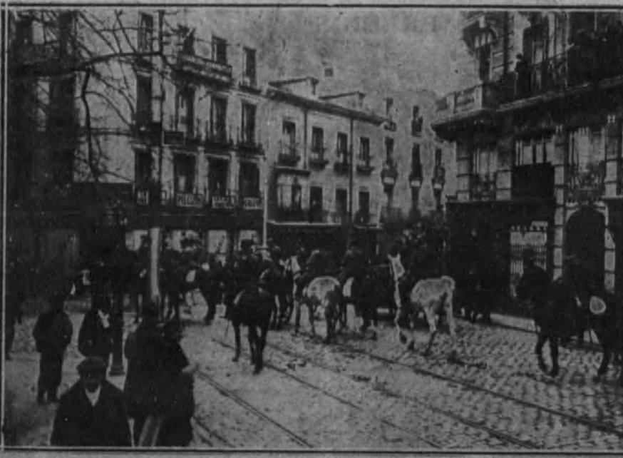
La Guardia civil disponiéndose a dar una carga en la Plaza del Progreso.