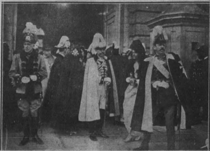
Grandes de España saliendo de Palacio, después de asistir a la Capilla pública.