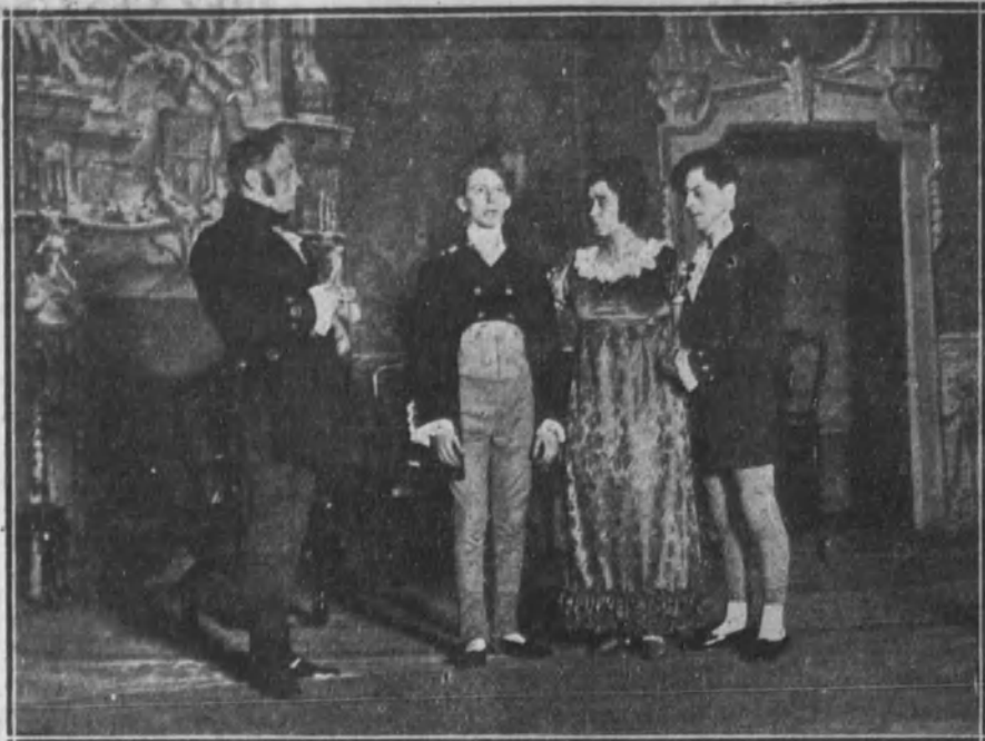
Una escena de la comedia de D. Jacinto Benavente titulada «Por ser con todos leal, ser para todos traidor», cuyo estreno en el teatro del Centro ha constituido un gran éxito.