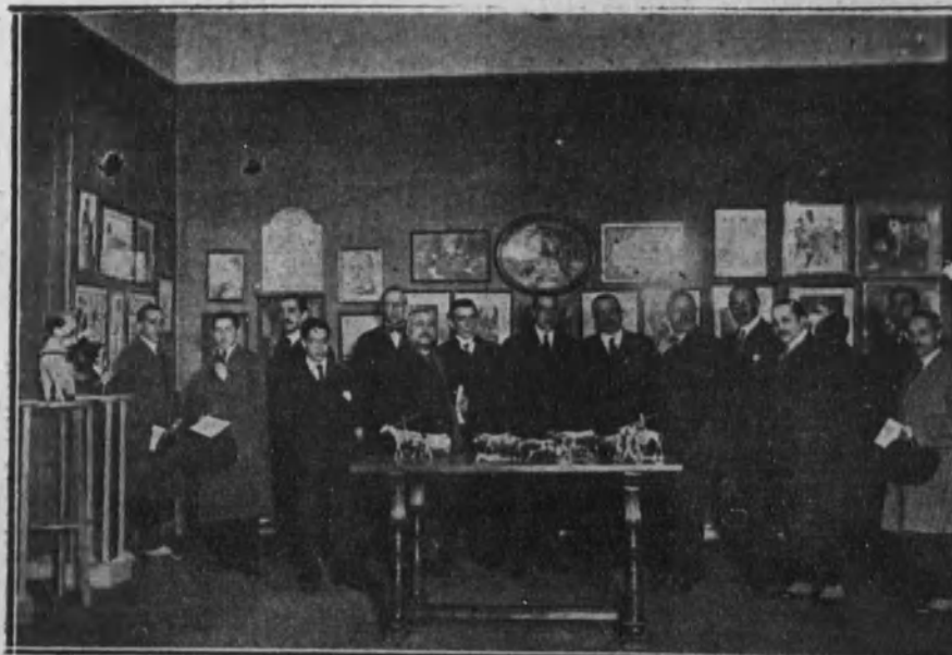
La Junta directiva del Círculo de Bellas Artes inaugurando el quinto Salón de Humoristas.