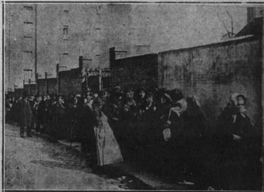
El público esperando turno a la entrada de la iglesia de Jesús, para visitar al milagroso Cristo.