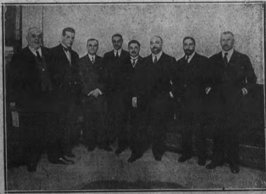
Grupo de concejales mauristas que, en el Círculo de su partido, trataron del asunto de su retirada del Ayuntamiento.