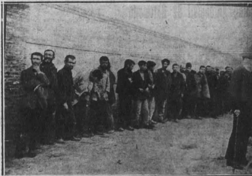
Grupo de «gol-fos» al ingresar en el Campamento-refugio del paseo de las Yeserías.