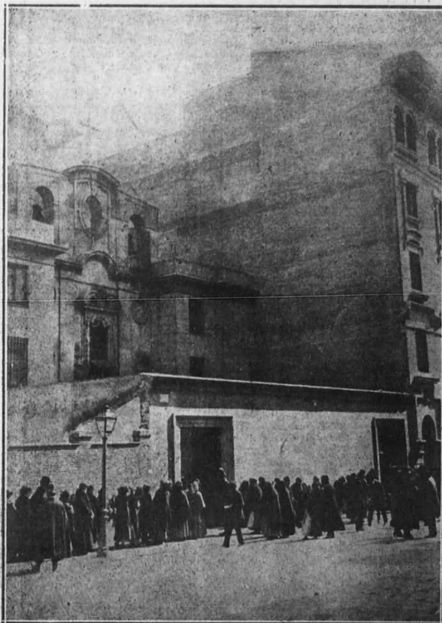
Los fieles esperando en la puerta de la iglesia de Jesús para entrar a rezar al Cristo de Medinaceli.