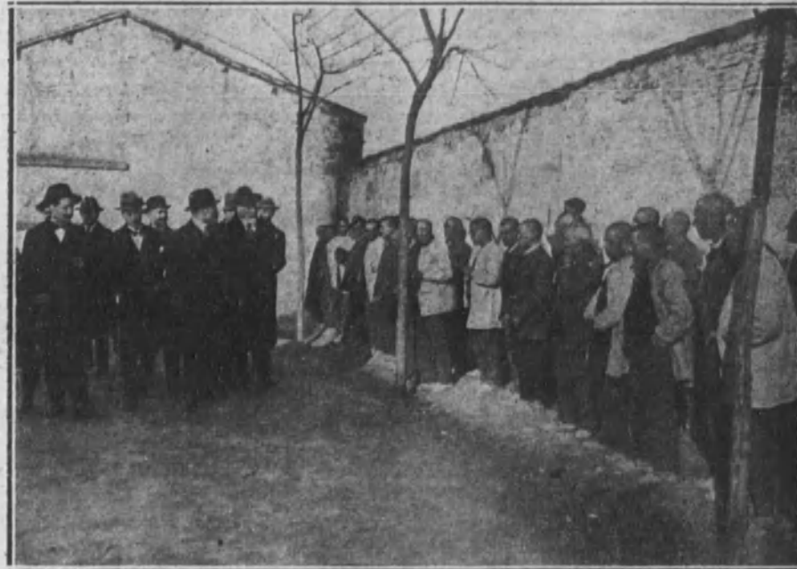
El gobernador y el inspector de Sanidad inspeccionando una cuadrilla de mendigos, después de haber sido desinfectados y vestidos con ropa nueva.