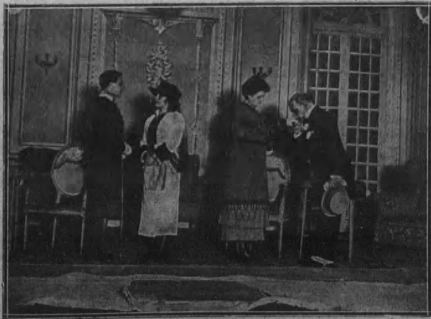
Una escena de la comedia «Bridge», que se estrenó anoche en el teatro de Eslava.