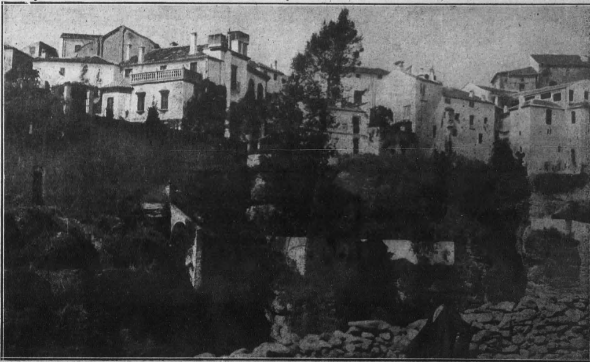
Bordes del profundo Tajo, sobre los cuales están construidas las casas.