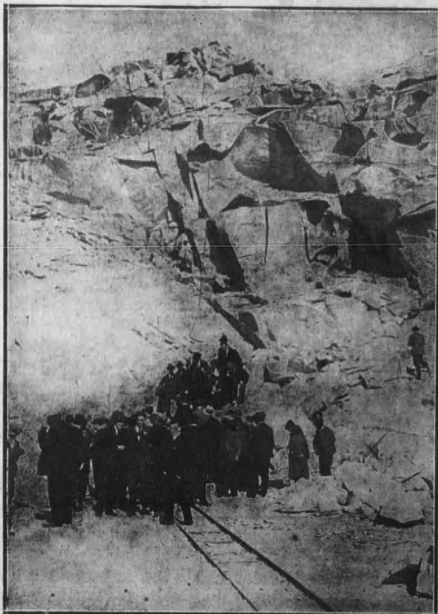
Aspecto de uno de los filones de la cantera de Zarzalejo.