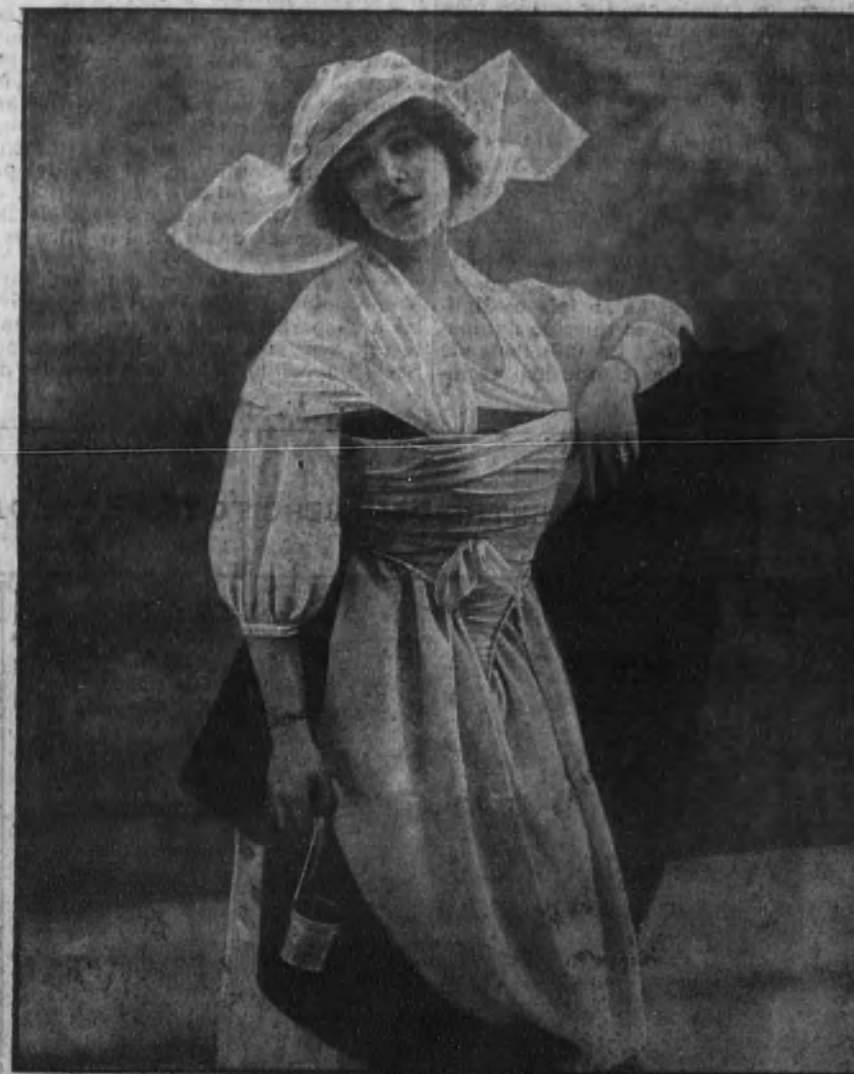
Graciosos y elegantes disfraces para bailes de máscaras de sociedad