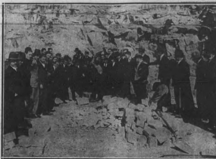
Los alumnos de la Escuela de Ingenieros presenciando la corta de las piedras para la pavimentación.