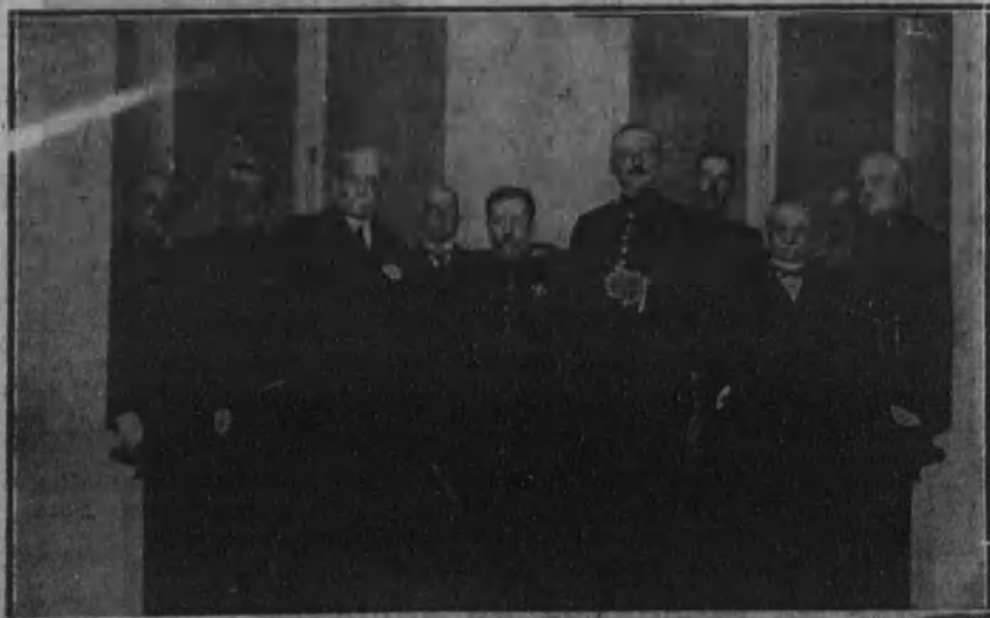
El general Primo de Rivera rodeado de algunos de los jefes y oficiales que acudieron a su conferencia en el Centro del Ejército y Armada.