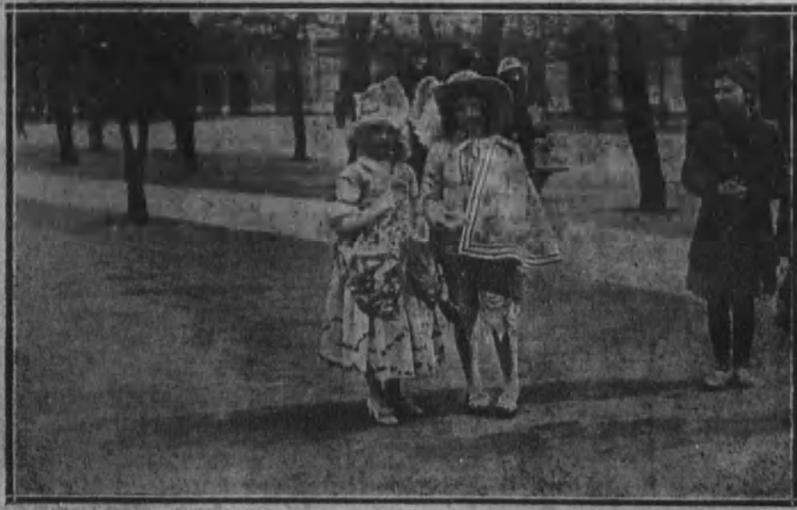
SAN SEBASTIAN.—Graciosa pareja de niños con originales disfraces de época.