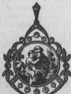
Núm. 12.—De oro de ley 18 k., esmalte artístico, con brillantes y diamantes artísticos sobre platino. Ptas. 425