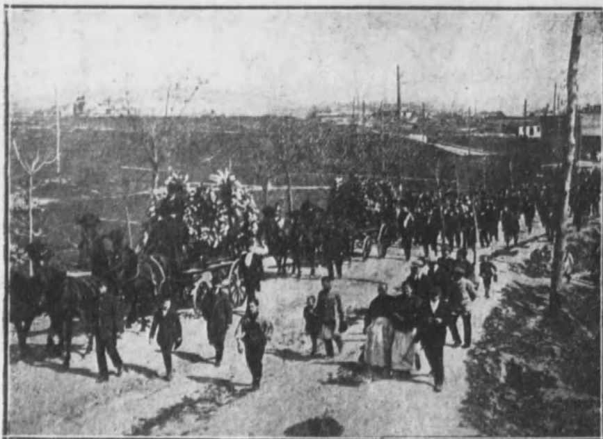
La comitiva dirigiéndose al cementerio de Carabanchel.