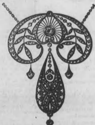
Núm. 8.—De oro de ley 18 k., con 14 brillantes y diamantes rosas sobre platino. Ptas. 1,050