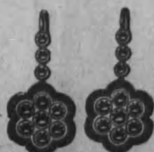
Núm. 16.—De oro de ley 18 k., con brillantes y zafiros o rubies calibrados sobre platino. Ptas. 925 El aderezo completo Ptas. 2,275

Modelos impresos de nuestras alhajas y relojes enviamos gratis a quien lo solicite, indicando la clase de alhaja o reloj que desea y su precio aproximado.