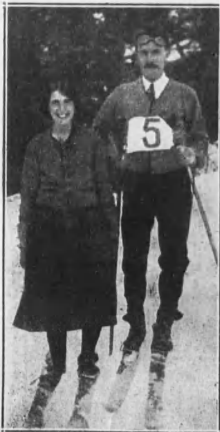
Pareja vencedora en la carrera del domingo último.

Como de interés general, y para que sirva de base entrenativa, daremos los resultados de los celebrados el domingo último, preparación de los que hemos anunciado: