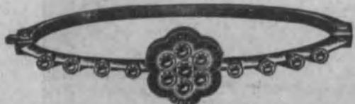
Núm. 14.—De oro de ley 18 k., con brillantes y zafiros o rubies calibrados sobre platino. Ptas. 775