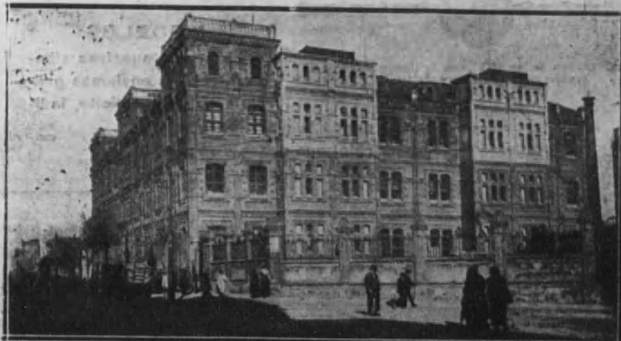
Vista del edificio y talleres de Artes Gráficas de los Sres. Henrich, en donde fué colocada la bomba.