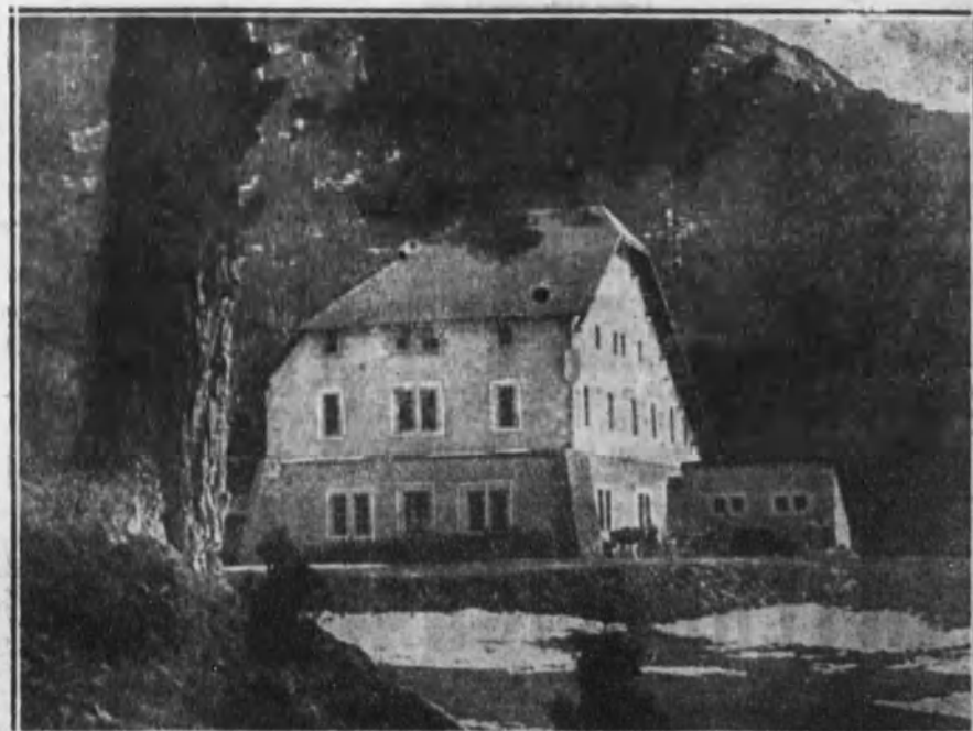
Vista del «chalet» de la Sociedad Peñalara, en la Fuenfría, inaugurado recientemente.