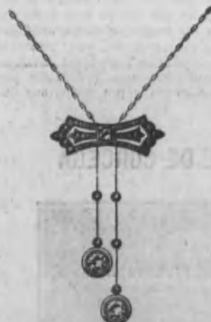
Núm. 10.—De oro de ley 18 k., con tres brillantes y diamantes rosas sobre platino. Ptas. 750