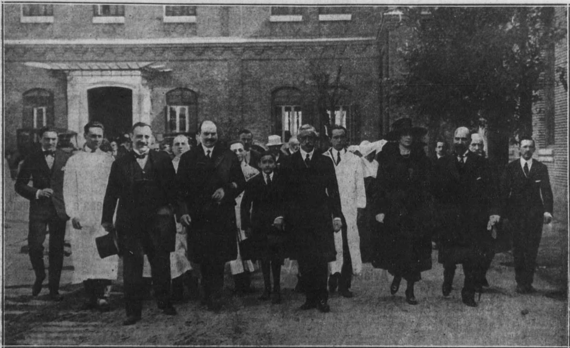
Su Majestad la Reina y la Princesa Beatriz al llegar al Asilo-Hospital del Niño Jesús, para inaugurar los nuevos pabellones.