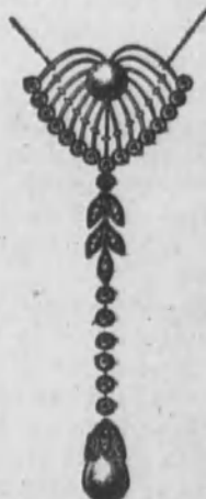
Núm. 13.—De oro de ley 18 k., con dos perlas y diamantes rosas sobre platino. Ptas. 900