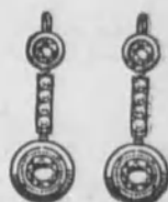
Núm. 6.—De oro de ley 18 k., con cuatro brillantes y diamantes rosas sobre platino. Ptas. 400 El aderezo completo Ptas. 1,150