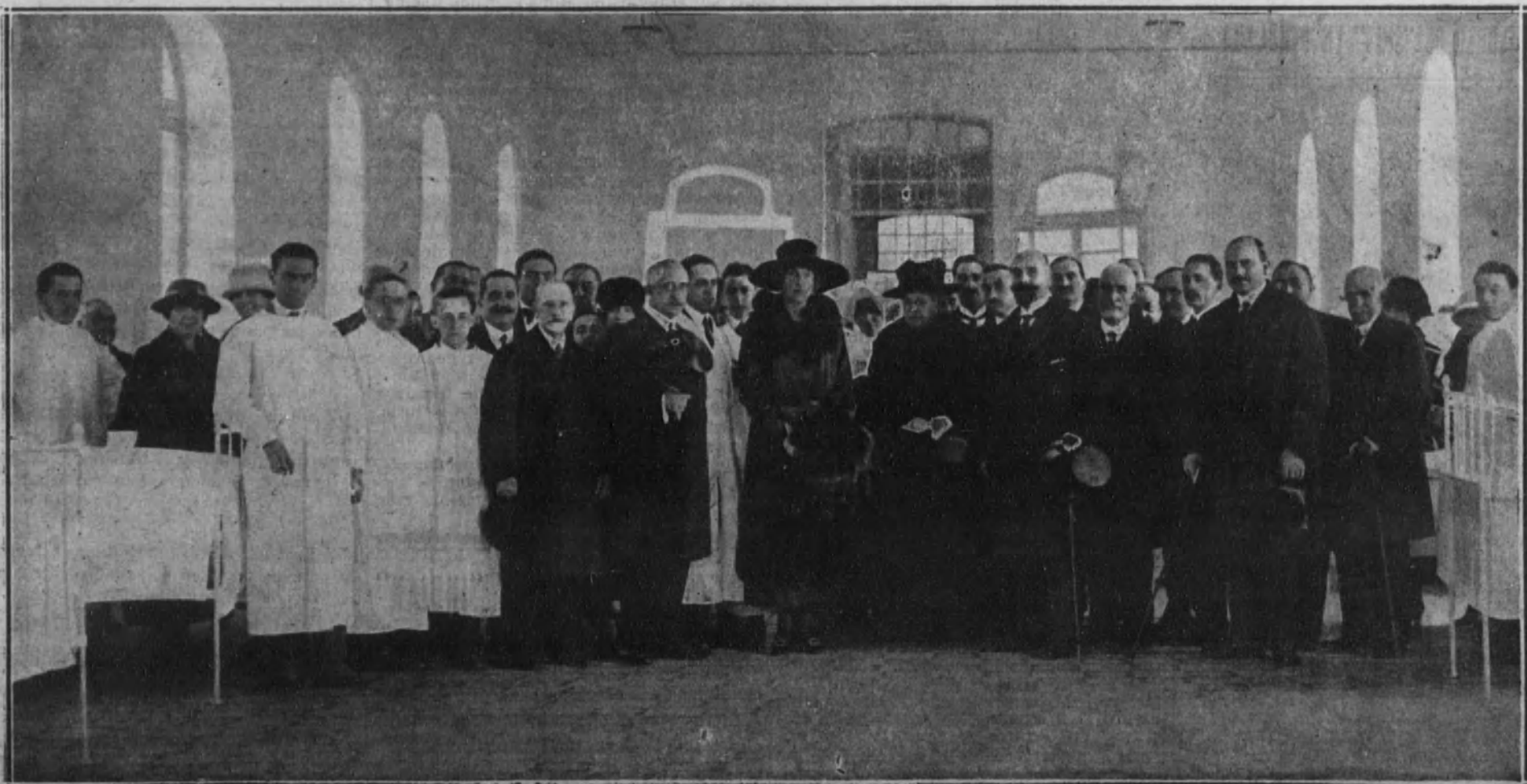
Su Majestad la Reina doña Victoria Eugenia, con la Princesa Beatriz, visitando uno de los pabellones inaugurados en el Asilo-Hospital del Niño Jesús.