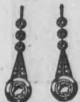
Núm. 3.—De oro de ley 18 k., con cho brillantes y diamantes rosas sobre platino. Ptas. 475 El aderezo completo Ptas. 1,235

GARANTIZAMOS CON FACTURA EL VALOR DE CADA JOYA