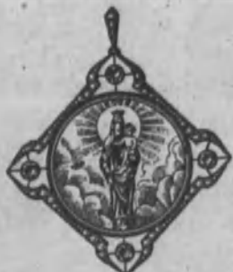
Núm. 11.—De oro de ley 18 k., esmalte artístico, cuatro brillantes y diamantes rosas sobre platino. Ptas. 400