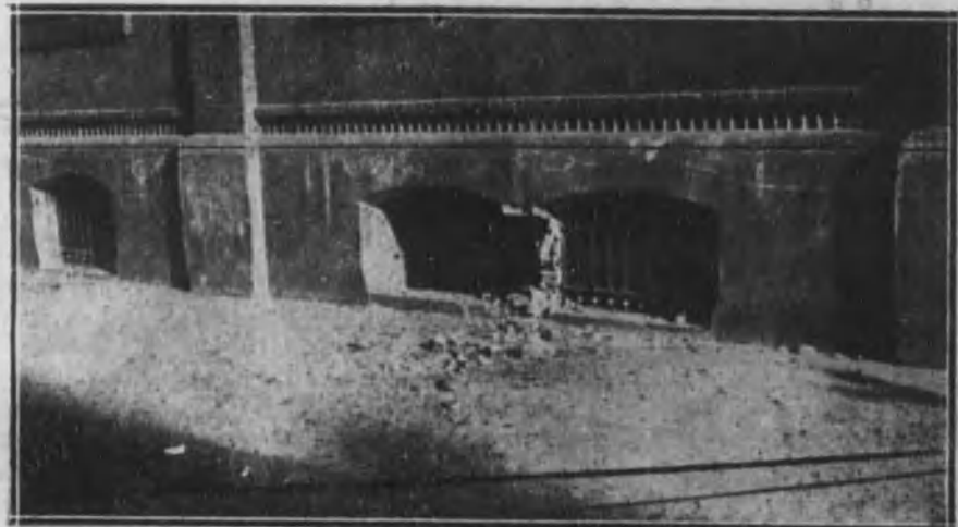
Ventanas de los sótanos de los talleres de la casa de los Sres. Henrich, donde fué colocada la bomba.