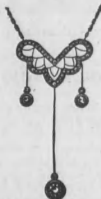
Núm. 9.—De oro de ley 18 k., con tres brillantes y diamantes rosas sobre platino. Ptas. 625