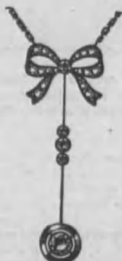
Núm. 7.—De oro de ley 18 k., con tres brillantes y diamantes rosas sobre platino. Ptas. 550