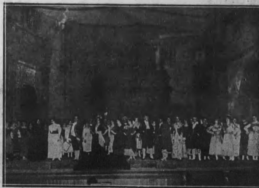
Una escena del final del segundo acto de la ópera «El Avapiés», estrenada con gran éxito en el teatro Real.