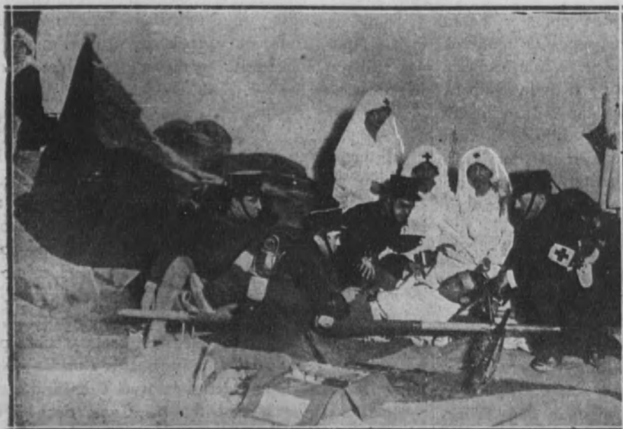
Un detalle del cuadro plástico representado por jóvenes de la aristocracia, en la función celebrada en el Real a beneficio de la Cruz Roja.