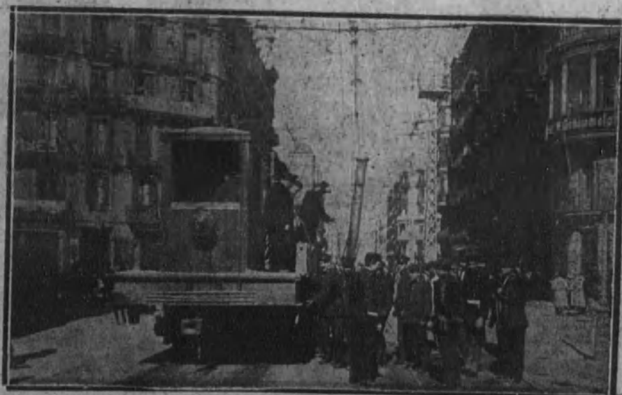
BARCELONA.—Los ingenieros militares recomponiendo los desperfectos ocasionados en la vía, por haber ocurrido un choque de trenes-tranvías.