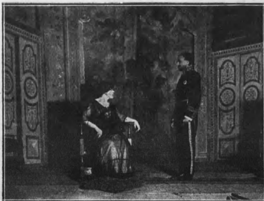
Una escena de «La tragedia de los Reyes», estrenada con éxito en el teatro Cervantes.