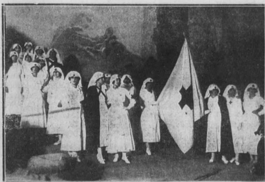
Grupo de señoritas de la aristocracia que han tomado parte en la función a beneficio de la Cruz Roja.