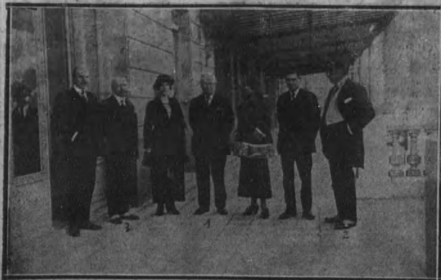
BARCELONA.—El ex presidente del Consejo de ministros de Inglaterra Mr. Asquith (1) con el gobernador civil (2) y el cónsul de Inglaterra (3), y personal de su séquito.