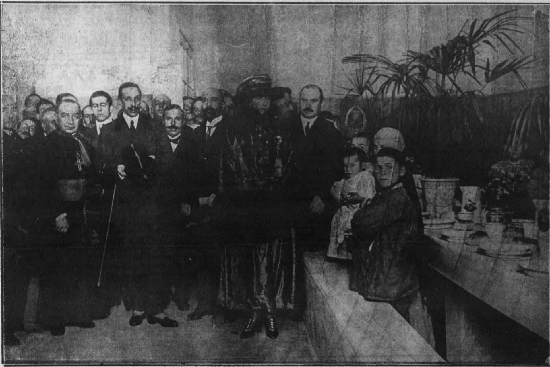
Sus Majestades los Reyes D. Alfonso y doña Victoria en la inauguración de los comedores de Alfonso XIII, instalados en el Gobierno civil.

Servicios extraordinarios. —Leche, caldo, hiberones, cordiales y carne, según los casos, a juicio de los encargados.