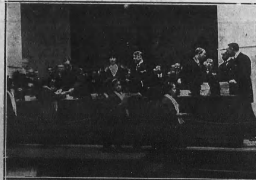
Reparto de cartillas de la Caja Postal de Ahorros a las niñas del Asilo municipal.