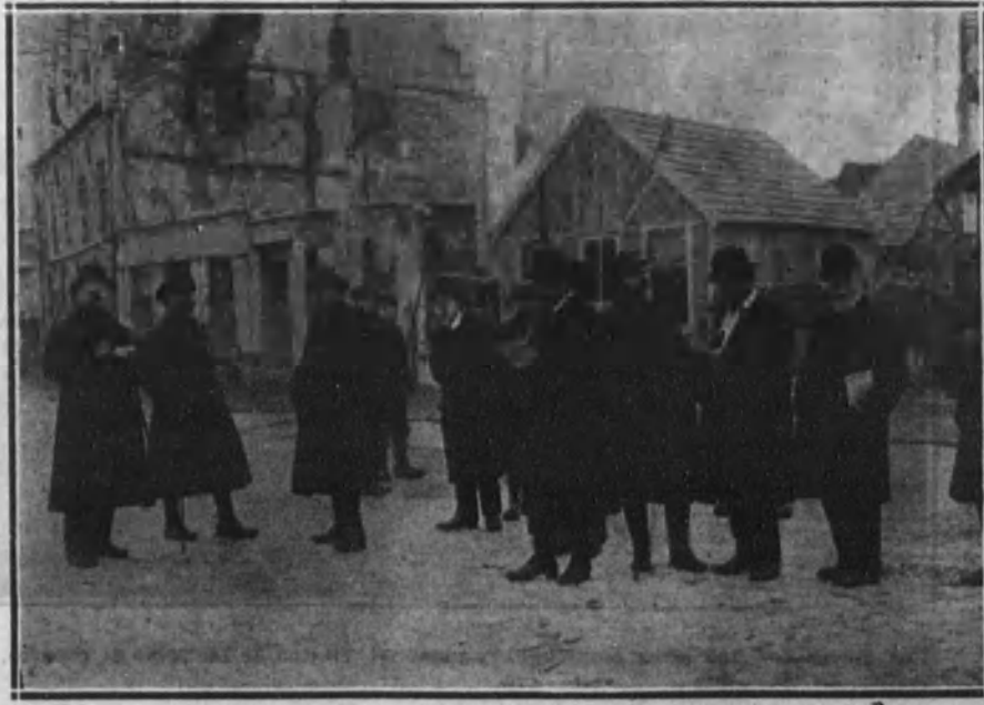
Grupo de periodistas visitando una ciudad belga que sufrió el bombardeo alemán.