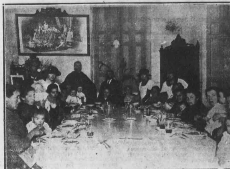
Vista de uno de los comedores de madres lactantes, en el Colegio de la Inmaculada.