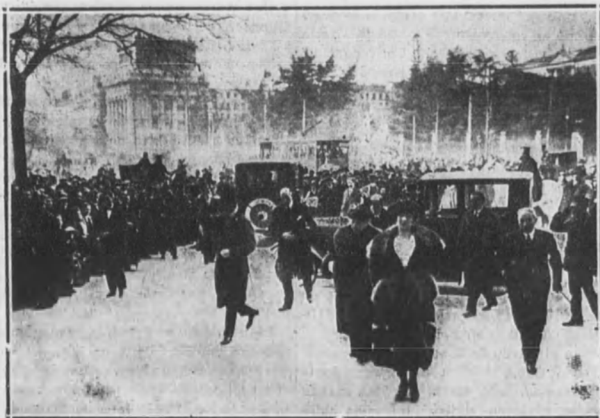
Momento de llegar los augustos Reyes a la Casa de Correos.