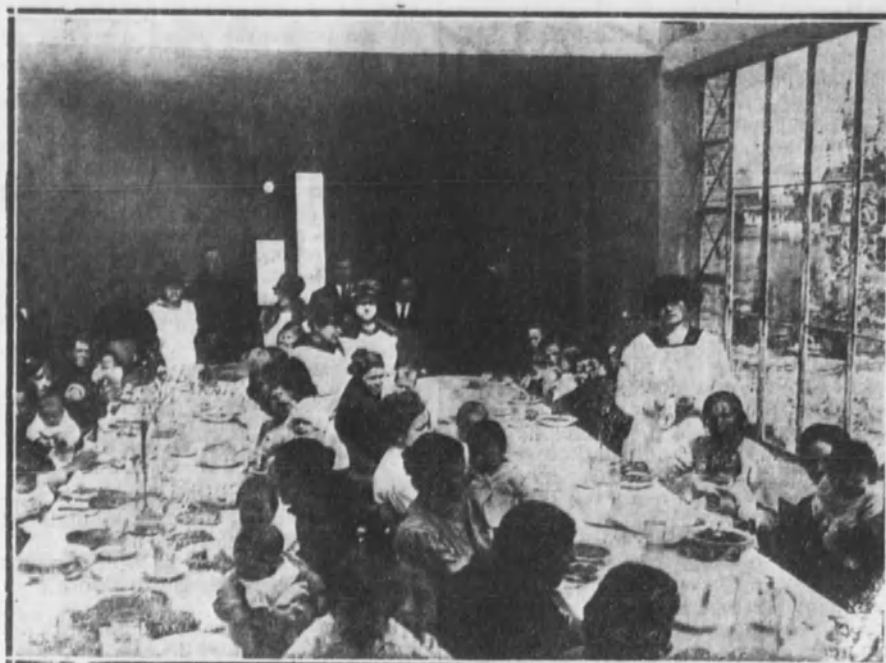
Uno de los comedores costeados por la Asociación Matritense de Caridad, en el Colegio de la Inmaculada.