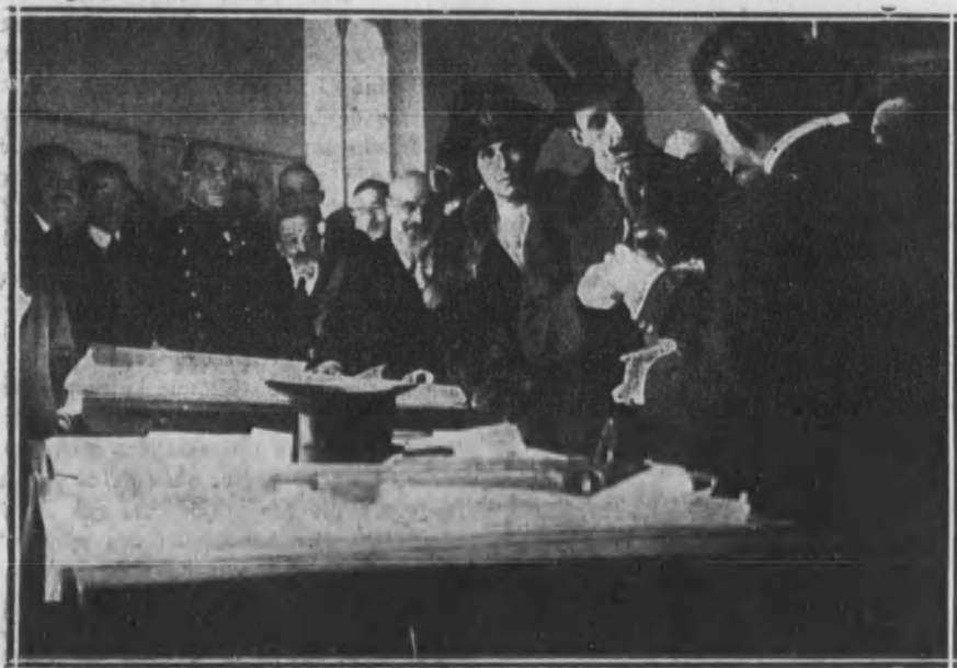
Los Monarcas examinando los planos de maquinaria.