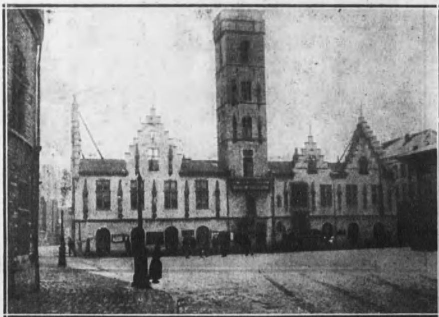
Aspecto del edificio Ayuntamiento de una ciudad belga que sufrió la invasión alemana.