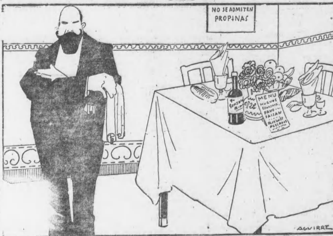
A que resulta que soy yo el único vergonzante.