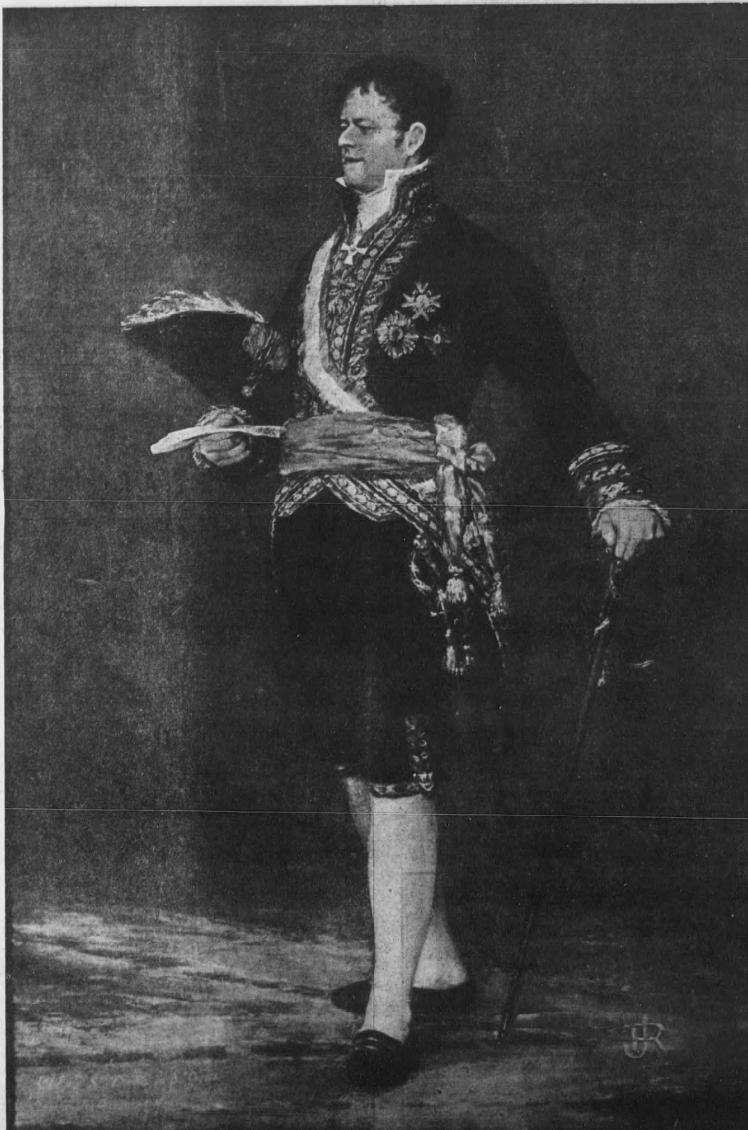
EL DUQUE DE SAN CARLOS

DIARIO GRAFICO DE INFORMACION (SEGUNDA EPOCA)