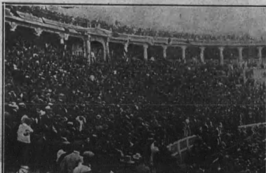
SEVILLA.—Aspecto de la Plaza Monumental durante la celebración del mitin republicano, pocos momentos antes de producirse los sangrientos sucesos.