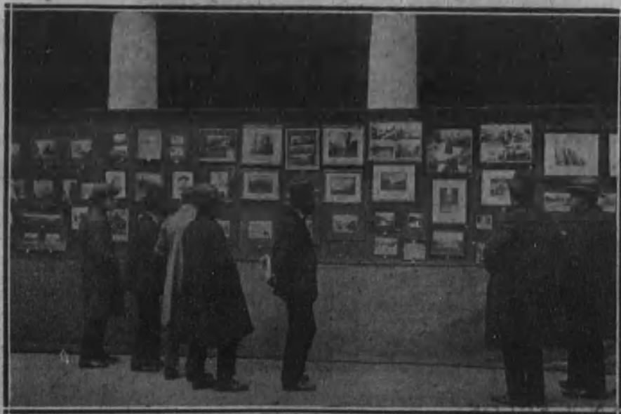
Exposición de fotografías patrocinada por la Agrupación Alpina Peñalara, que se ha inaugurado en el patio del ministerio de Estado.