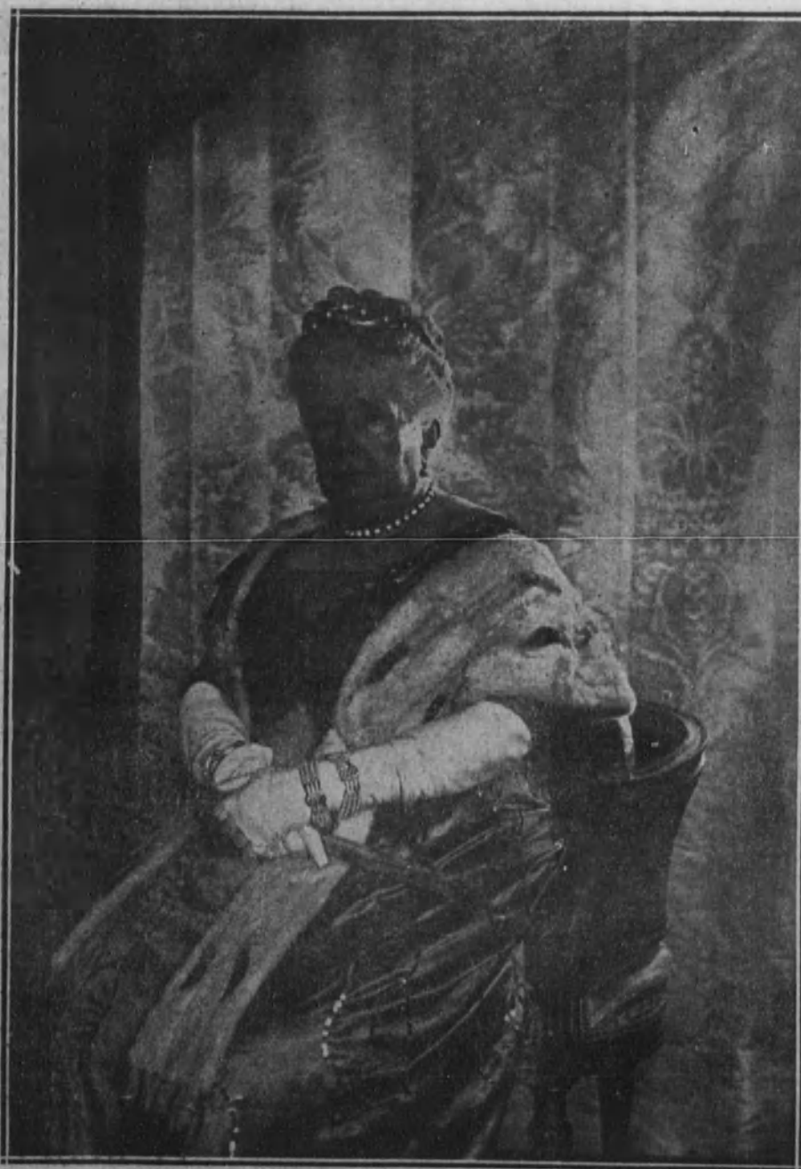
Último retrato fotográfico de la Infanta Isabel, obtenido en el estudio del pintor Pons Arnau.