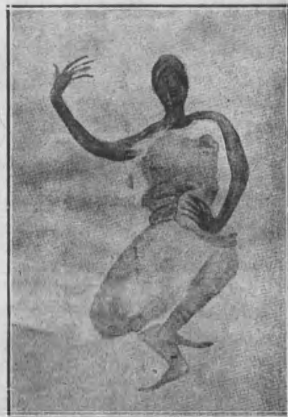
Danzarina cambodgeana Estudio de movimiento (acuarela).

De los japoneses fué Hokusai «el anciano loco de dibujo» quien dijo: «A los ochenta años voy sabiendo ya dibujar; si vivo hasta los cien, llegaré a dibu-