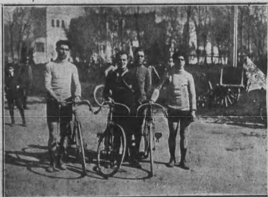
SEVILLA.—Corredores que tomaron parte en la carrera pedestre organizada por la revista sevillana «Bética Deportiva».