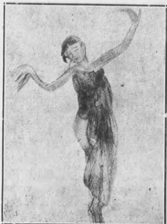
Danzarina cambodgeana Estudio de movimiento (dibujo).

Entre toda la imbecilidad manifestada con motivo del «affaire» de las falsificaciones de Rodin, dos hechos resultan con una fuerza verdaderamente aplastante para confundir a los que se han apresurado a proclamar que el mismo Rodin fué un pobre impostor: son estos dos hechos el olvido en que se dejaba a los bustos-retratos primero, y a los dibujos después; es decir, a las dos partes de la obra rodiniana, cuya gloria no podía recaer en ningún genio voluntaria o involuntariamente oculto. Y este olvido, debido a la mala fe o a la ignorancia, ha hecho aún más repugnante el espectáculo de tanto artista y escritor relamién-