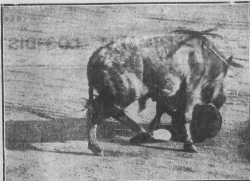
Valencia al ser cogido por su toro.