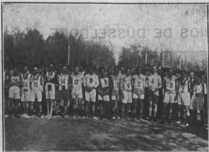
SEVILLA.—Corredores que tomaron parte en la carrera pedestre celebrada últimamente en esta capital, bajo los auspicios de la revista sevillana «Bética Deportiva».