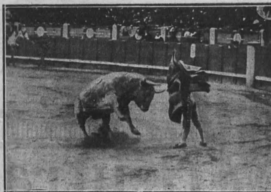
Casielles rematando un quite.