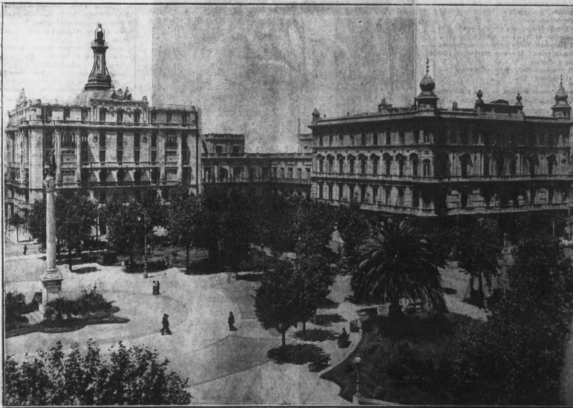
URUGUAY.—Vista de la plaza de la Libertad y del edificio del Palacio del Municipio, en la ciudad de Montevideo.