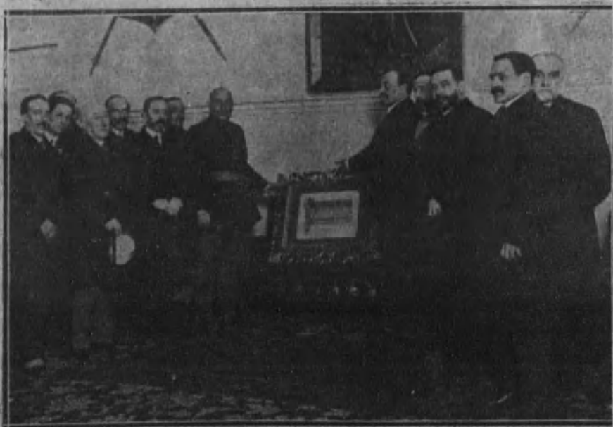
La Junta directiva del Centro Manchego entregando un artístico pergamino miniado al capitán general de Madrid.