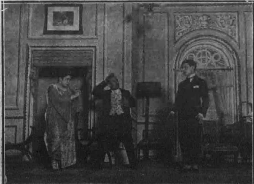
MADRID.—Una escena de la comedia «La plaza de primos», cuyo estreno se verificará esta noche en el teatro Infanta Isabel.