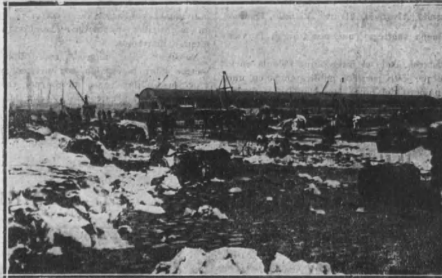
BARCELONA.—Aspecto de los muelles del puerto pocos momentos después de haber sido extinguido el incendio.