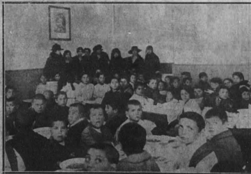
Cien niños de las Escuelas municipales, durante la comida que diariamente les sirve la Cantina Escolar en la ronda de Atocha.