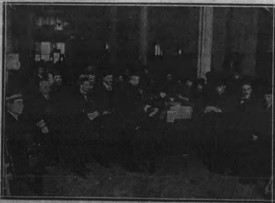
El ministro de la Gobernación acompañado del director general de Correos y Telégrafos, inspeccionando el trabajo de repartición realizado por los soldados.

Como dichos artículos quedan en suspenso, los nombramientos los podrán hacer libremente los administradores principales.