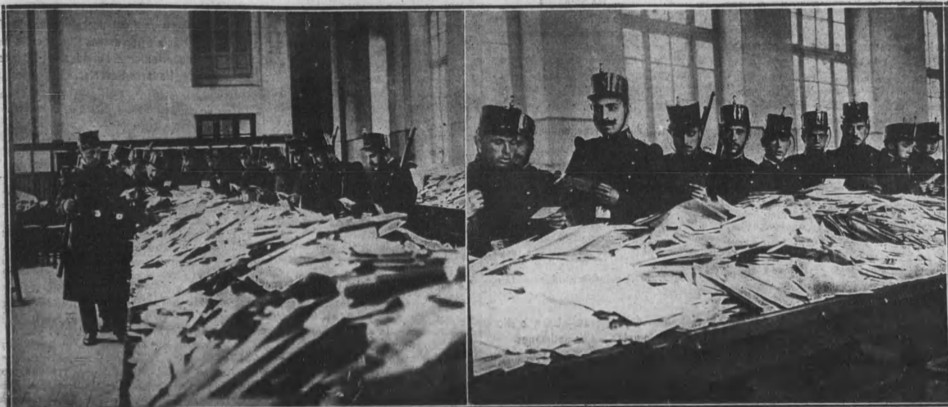
Los aspectos de las salas de distribución, en la Central de Correos, al incautarse de ellas los soldados del regimiento de Saboya, para realizar el servicio de distribución de la correspondencia abandonada por los funcionarios de Cartería.