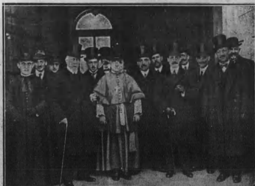
El obispo de Segovia con la Comisión que ha visitado al Rey para tratar de la reedificación del Palacio de La Granja y la construcción del ferrocarril de Segovia a La Granja.