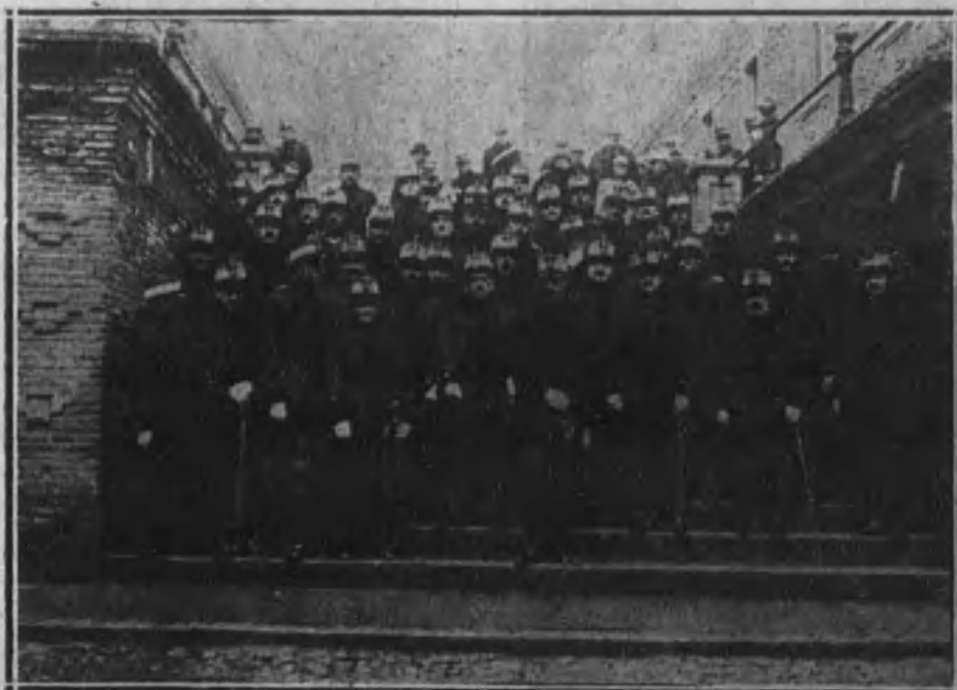
Su Majestad el Rey con los jefes y oficiales del regimiento de Wad Ras, reunidos con motivo del aniversario de la batalla que da nombre al regimiento.