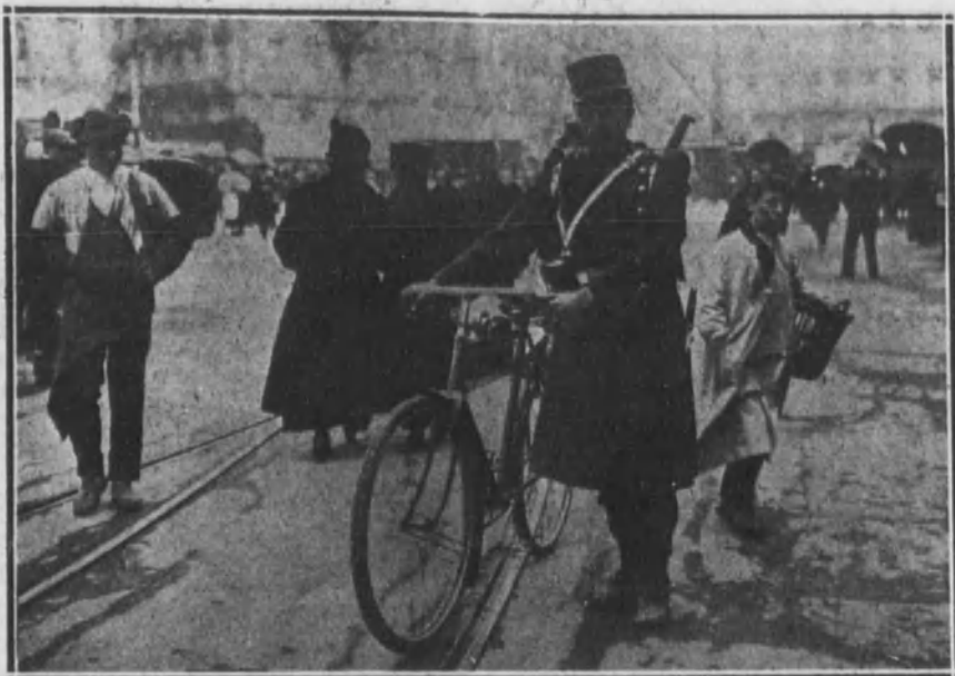
Soldado de Ingenieros, de la sección ciclista, encargado del servicio del reparto de la correspondencia urgente.