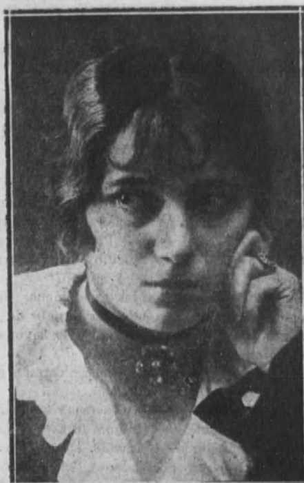
Srta. Raquel Meller, artista de varietés.