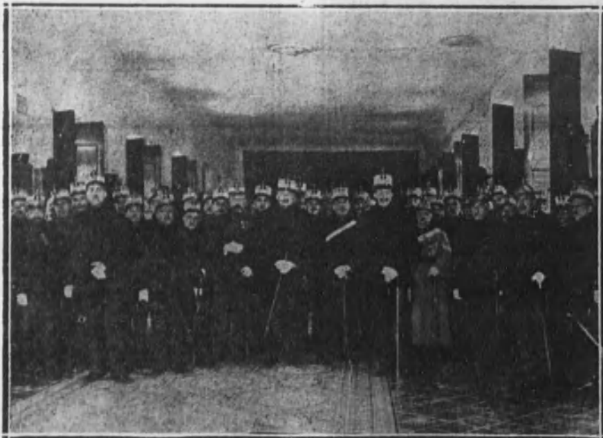
Su Majestad el Rey con los jefes y oficiales, en el pabellón donde oyeron misa.