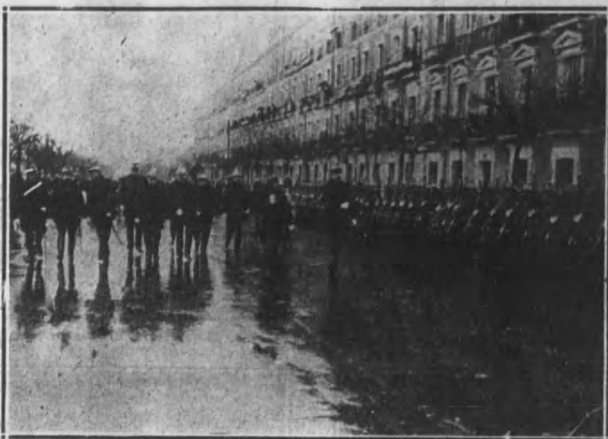
Su Majestad el Rey con el capitán general y otros jefes y oficiales, revistando las fuerzas del regimiento de Wad Ras.

Terminado el «lunch», el Rey se despidió de todos, y fué despedido con nuevas aclamaciones.