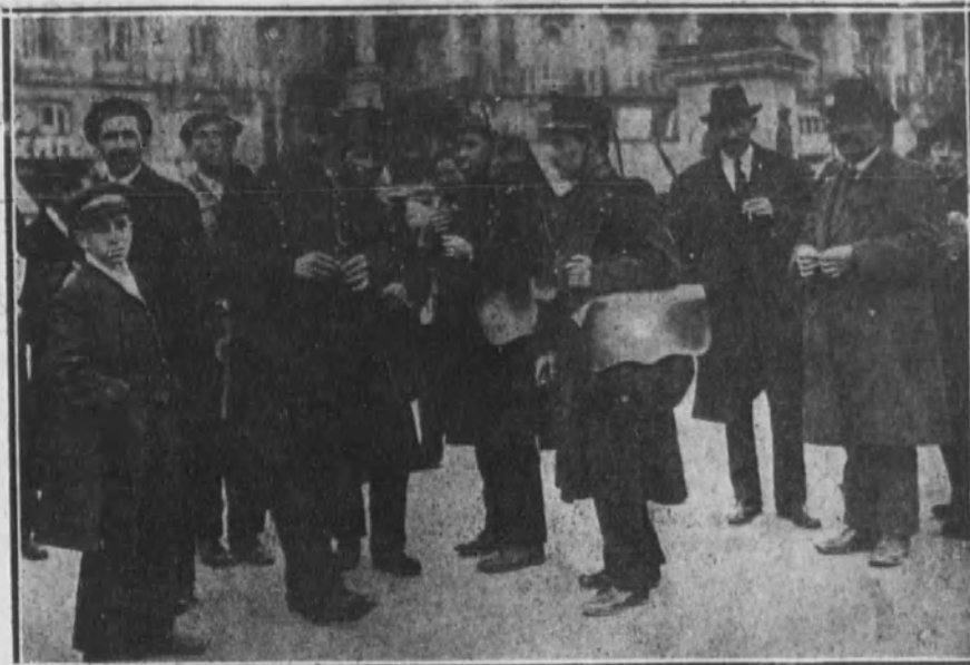
Un grupo de soldados en la Puerta del Sol esperando los tranvías para dirigirse a sus respectivos distritos a repartir la correspondencia.