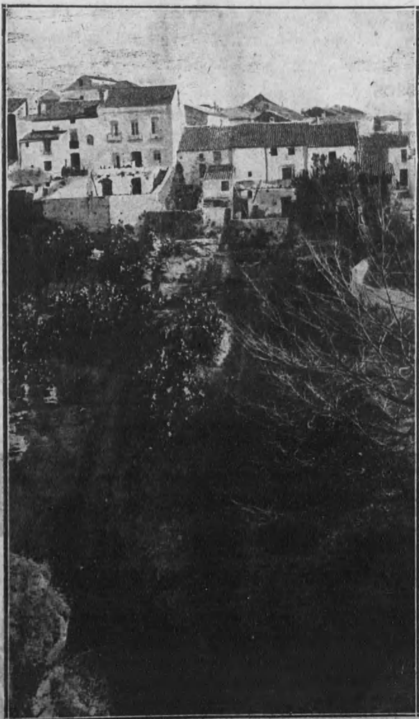
Bordes del profundo Tajo, sobre los cuales están construidas las casas.