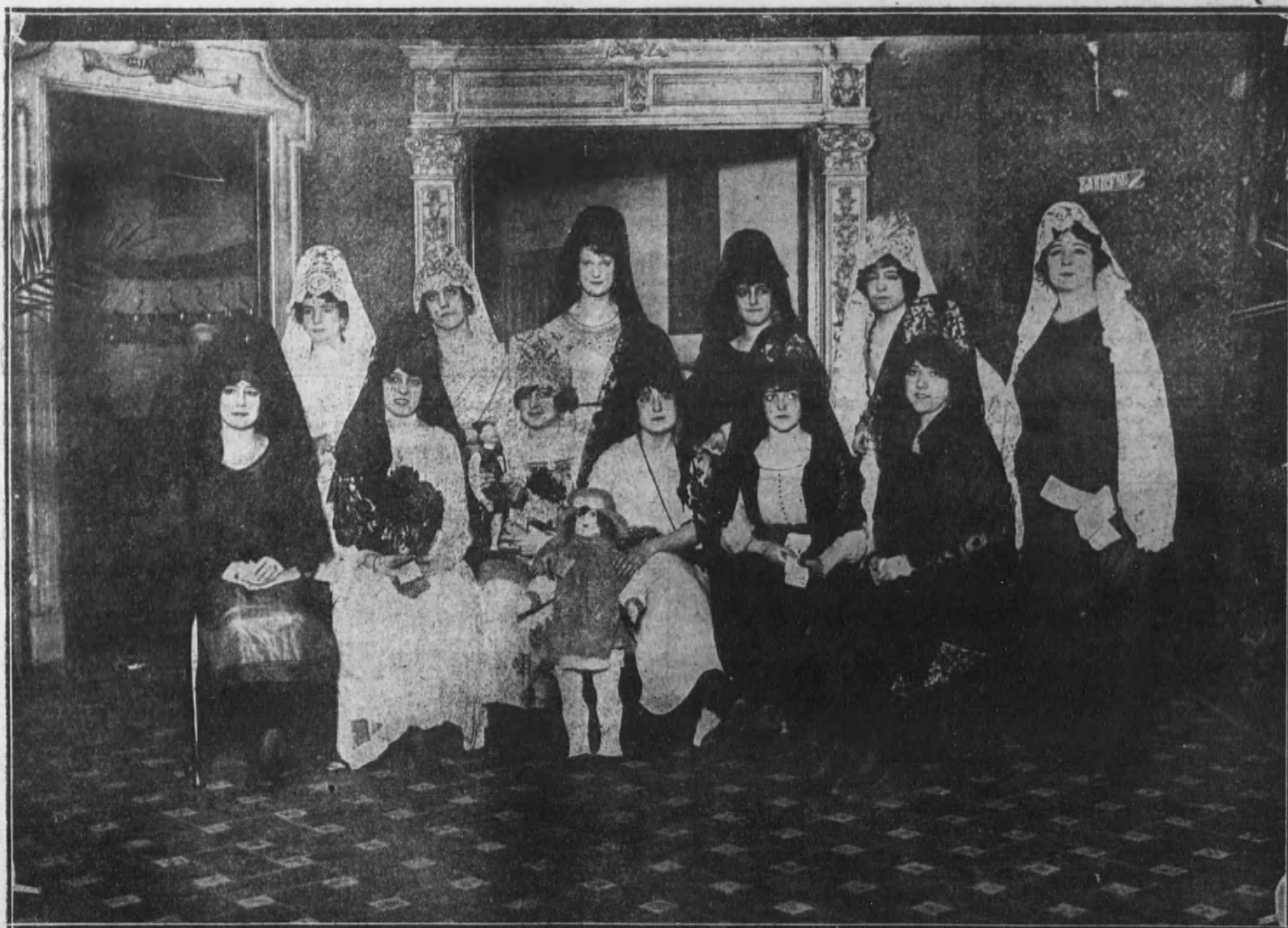
Señoritas artistas que tomaron parte en el festival y que lucieron la clásica mantilla española.