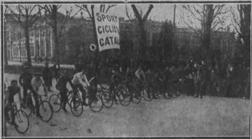
BARCELONA.—Carrera ciclista celebrada el día 23 por la mañana en el Parque barcelonés.