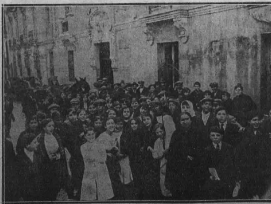
Comisión de obreras de las fábricas de ropas al salir ayer de la Casa del Pueblo, donde tomaron acuerdos sobre la huelga.