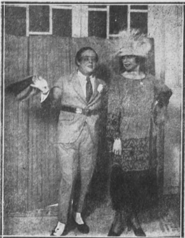
La Sra. Hidalgo y el Sr. Barreto en «La duquesa del Tabarín».