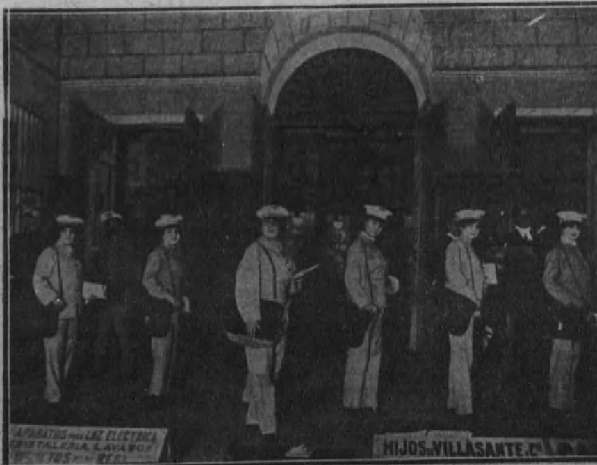
Una escena de la obra titulada «El rápido de Irán», que se estrenará en el teatro Martín esta noche.