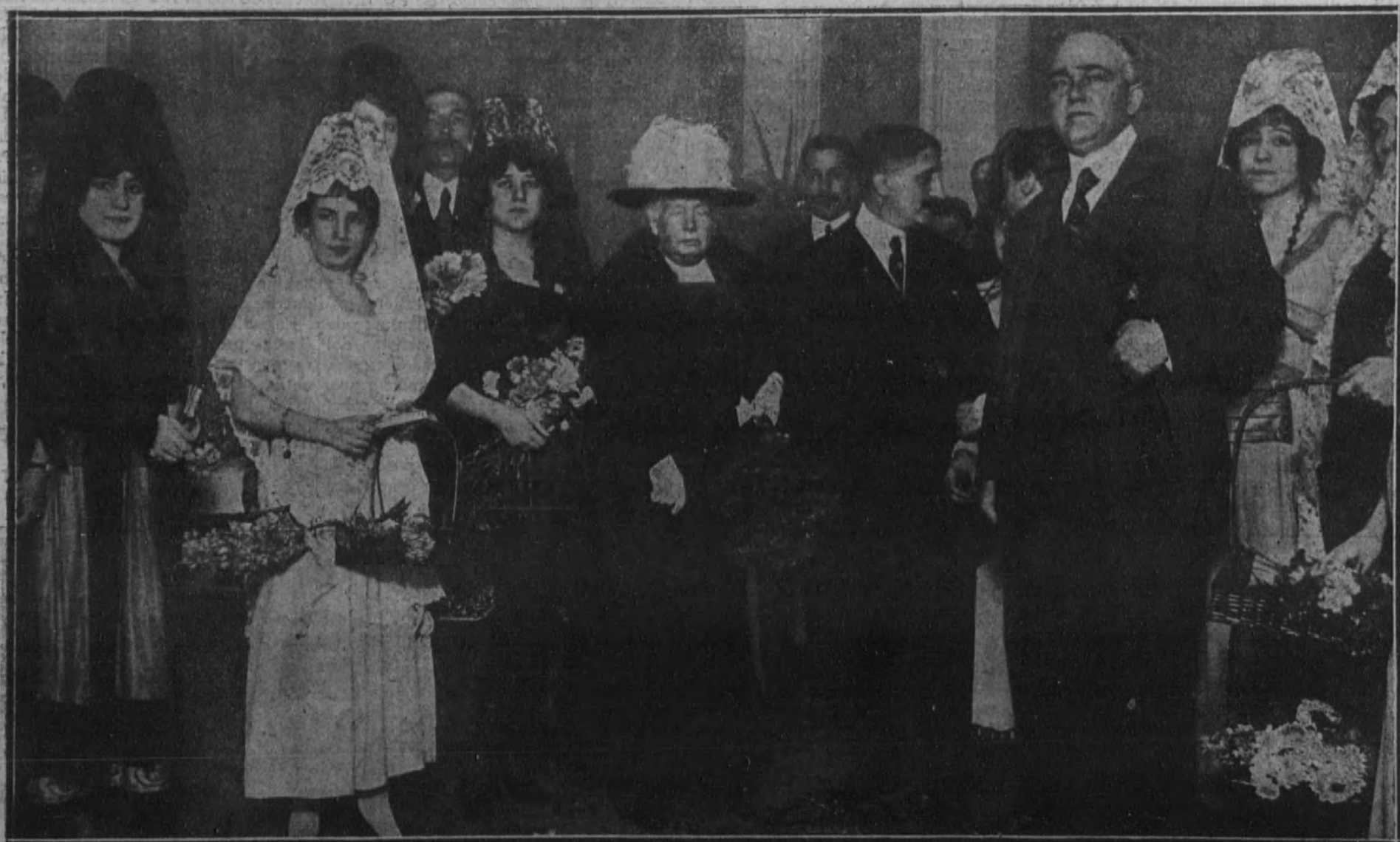
Su Alteza Real la Infanta doña Isabel a su llegada al teatro del Centro, acompañada de nuestro director, del secretario de Redacción y de las señoritas artistas de la tómbola, que la obsequiaron con un ramo de flores.