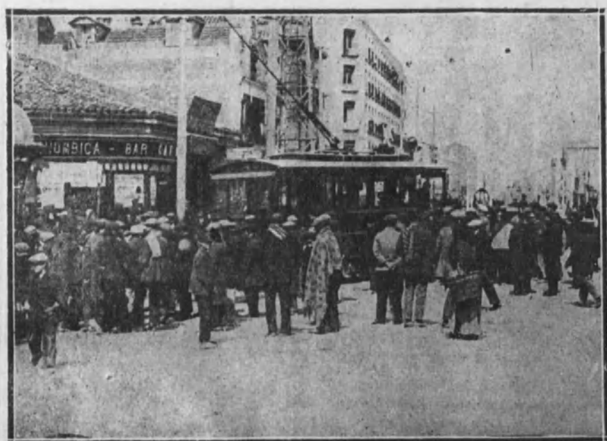
Obreros del ramo de construcción presenciando la salida de tranvías de la estación de la glorieta de Cuatro Caminos.