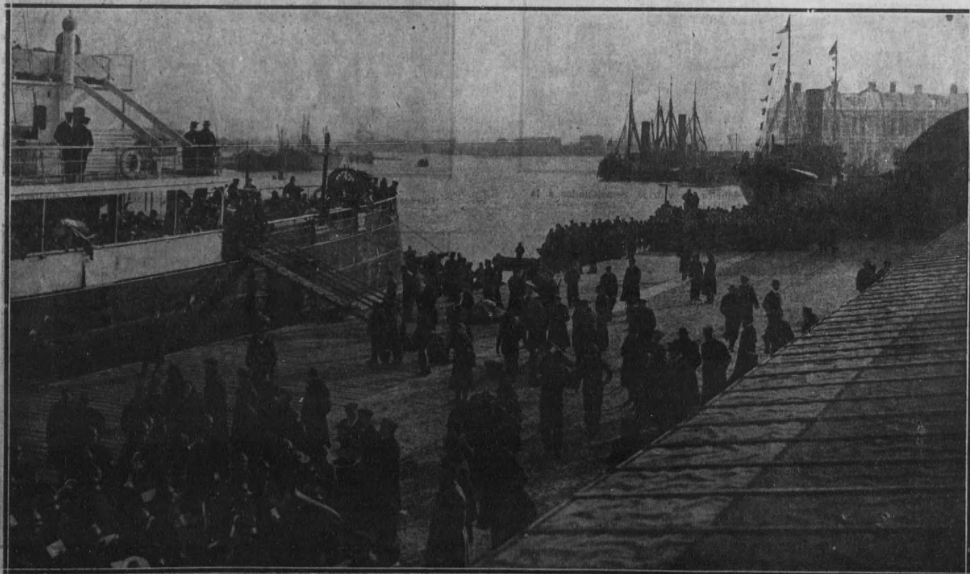
El público presenciando en los muelles de Ostende la llegada del «Ville de Liège», primer barco belga que ha entrado en la bahía después de la guerra.