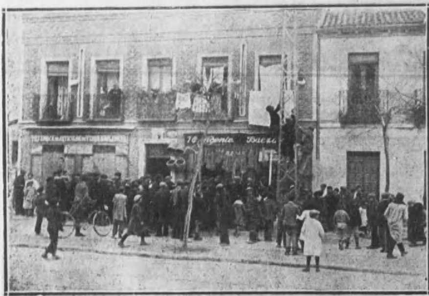
Grupo de obreros pertenecientes a una fábrica de vidrios, estacionados a la entrada de la fábrica.