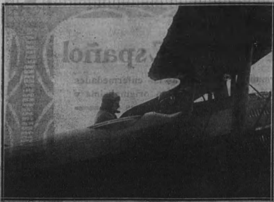
El biplano ocupado por el Rey Alberto y el piloto en pleno vuelo.

Residencia-Ciudad Lineal, a las diez de la mañana, en el campo de este último. Este partido se suspendió el pasado domingo, a causa de la lluvia.