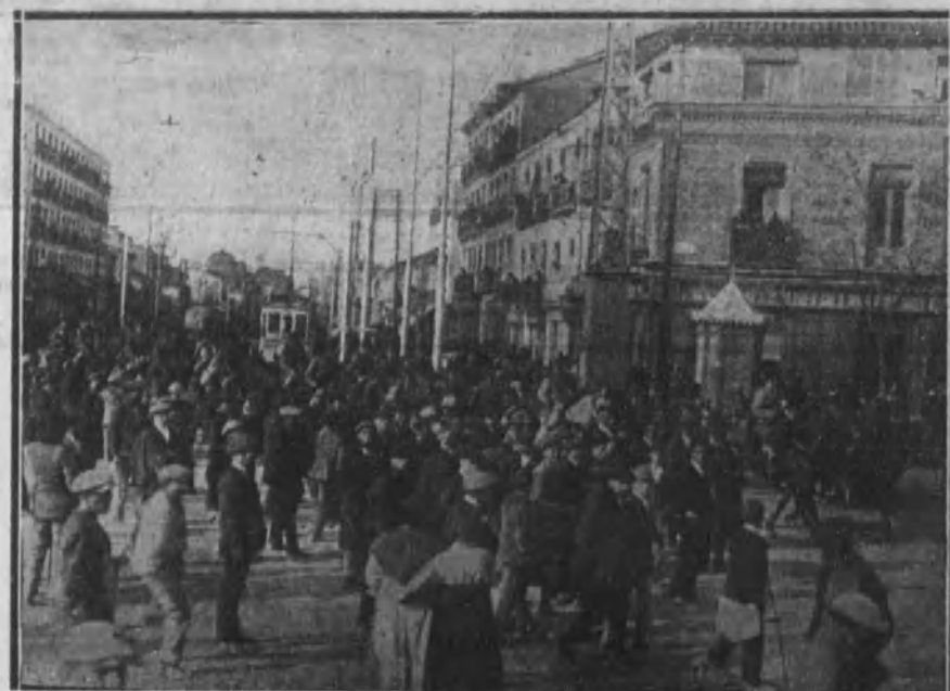
Obreros huelguistas presenciando el desfile de una sección de Caballería.