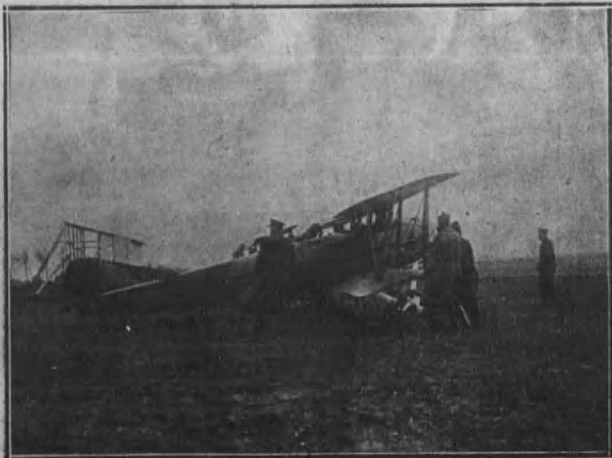
El Rey de Bélgica y el piloto que tripulaba el biplano, momentos antes de emprender el «raid» de Bruselas a Aix-la-Chapelle.