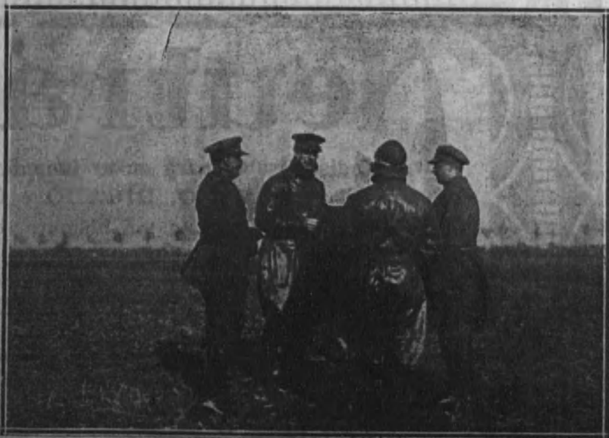
El Rey conversando con el general Michel, jefe del Ejército belga de ocupación en Alemania, después de aterrizar en las cercanías de Aix-la-Chapelle.