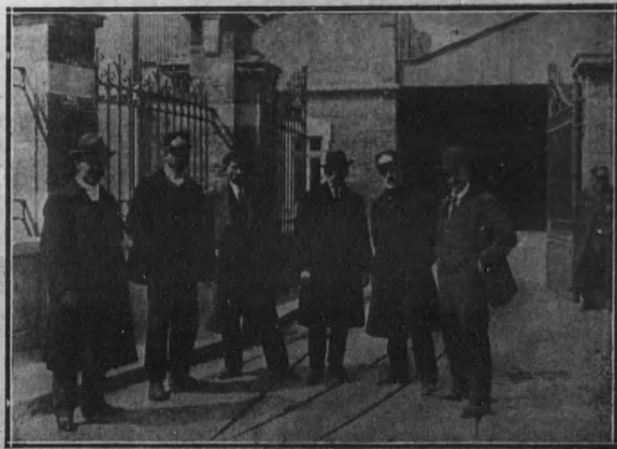
El Comité de huelga de los empleados de los tranvías, después de haber visitado al director de la Compañía.