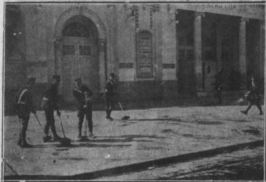
Los soldados haciendo la limpieza de las calles.