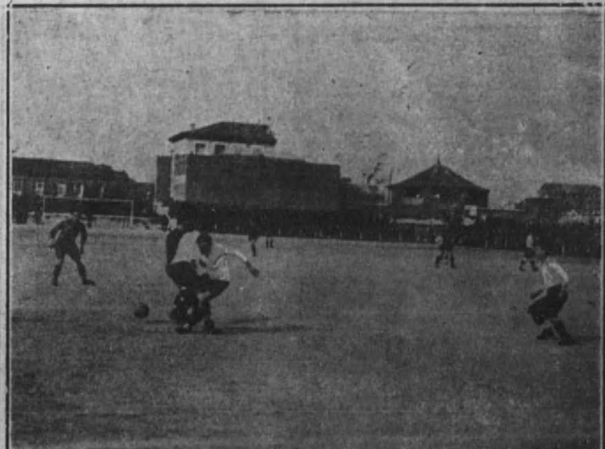
ARENAS-RACING.—Un momento refidísimo.