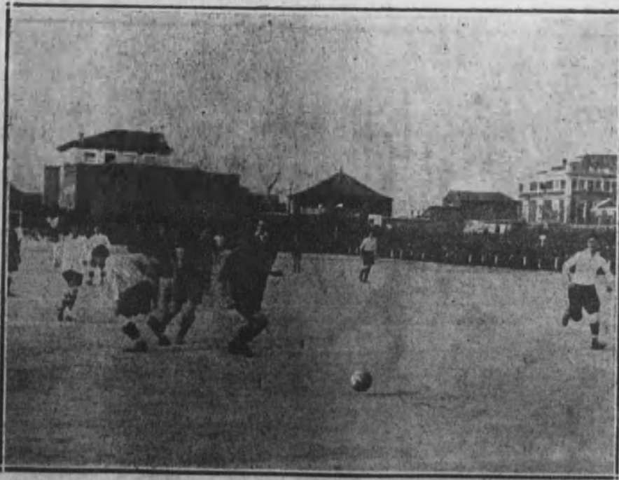
ARENAS-RACING.—Un aspecto interesante de la lucha al empezar la última fase del partido.