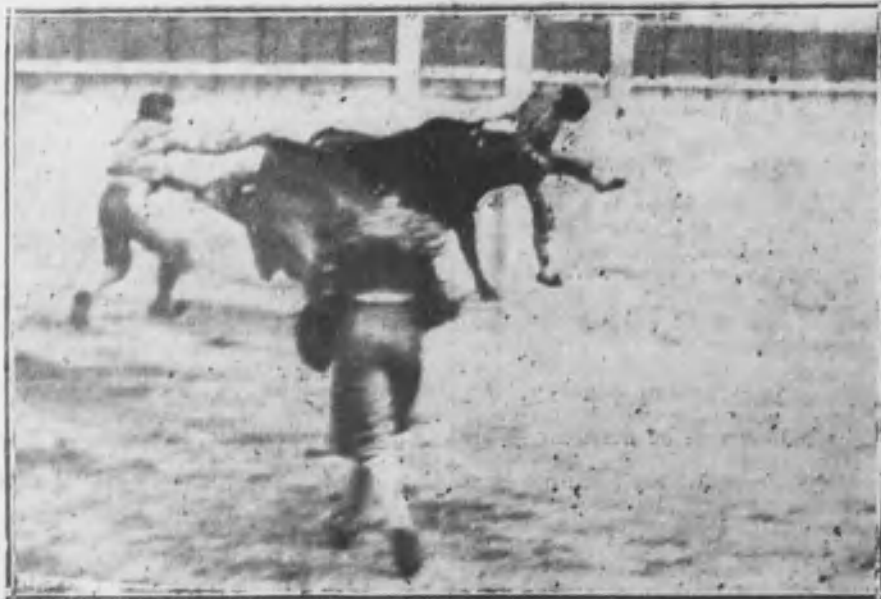
El diestro Sánchez al ser cogido aparato: a nen'é or su to'o