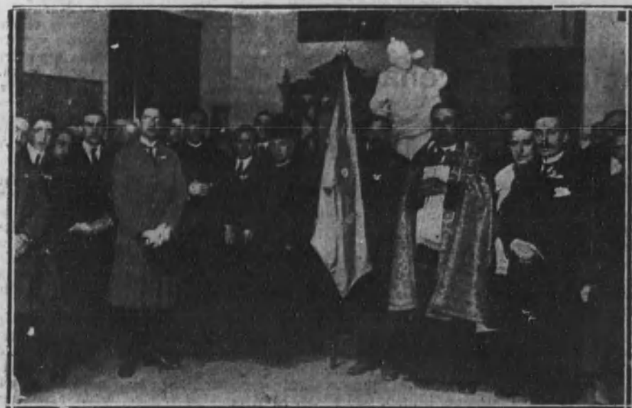
MADRID.—Acto de bendecir la bandera regalada por el marqués de Comillas y otras personalidades, en la iglesia de San Millán.