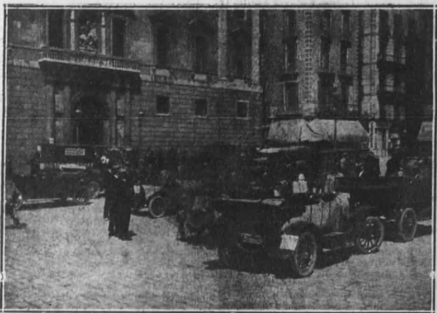
Los automóviles dispuestos en la plaza de San Jaime, frente a la Diputación Provincial, para el abastecimiento de la ciudad.