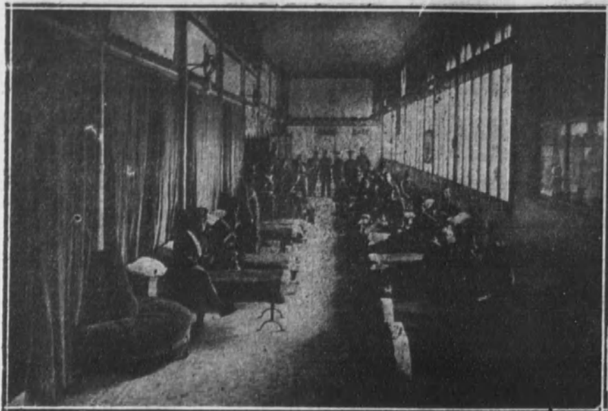
El teatro Cómico convertido en dormitorio militar.