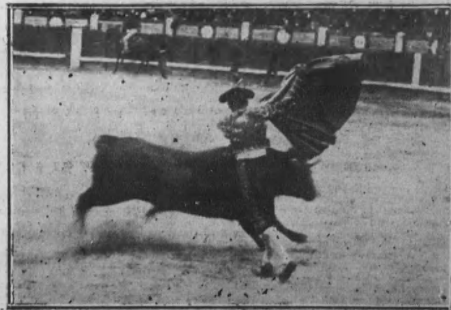
Sánchez Torre veroniquando