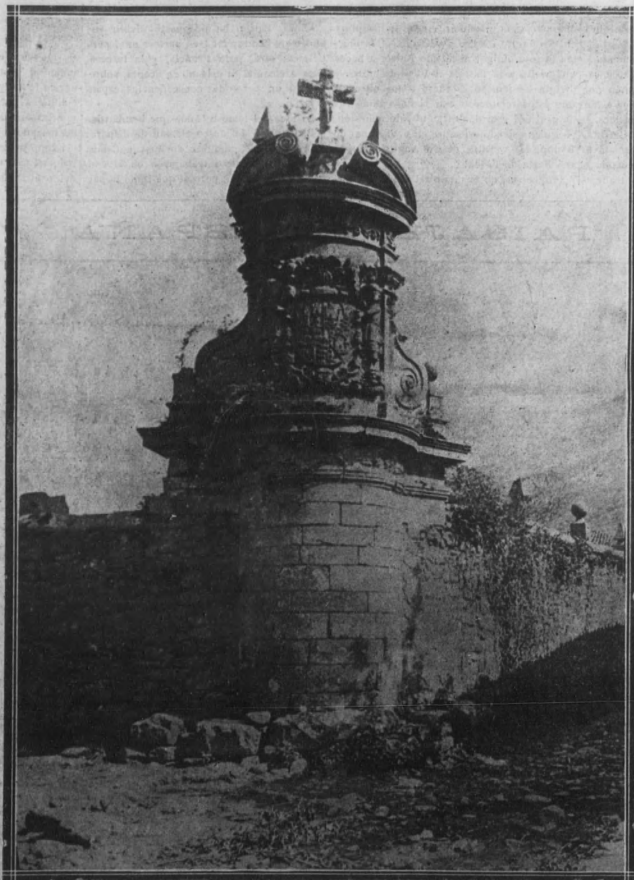
MONUMENTO MONTAÑÉS DEL AÑO 1712

Cruz de Rubalcaba (Liérganes), que será trasladada a Santander, para colocarla en la entrada de la biblioteca que donó a esta población el sabio polígrafo don Marcelino Menéndez Pelayo, y que se inaugurará en el próximo mes de julio.