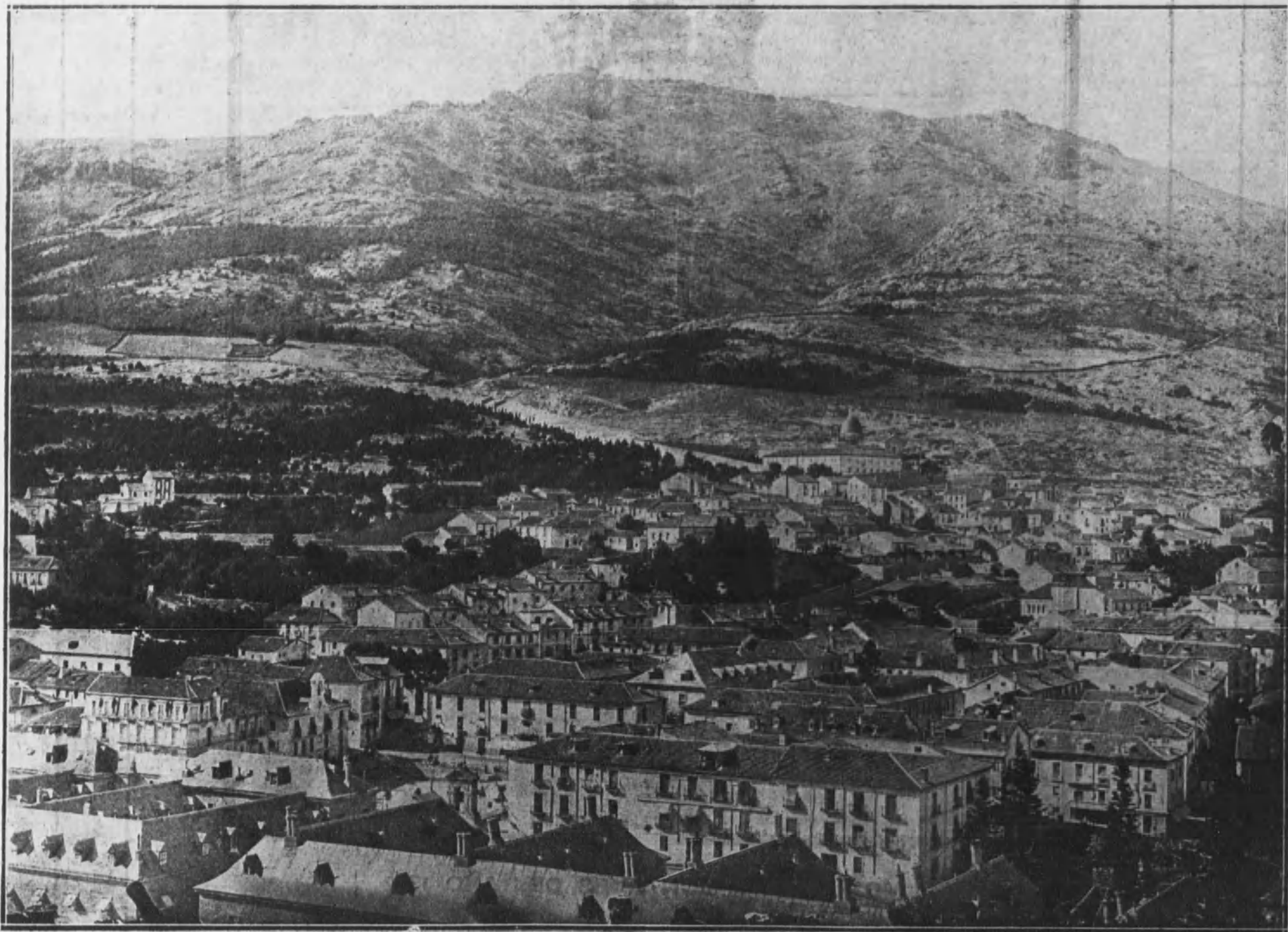
EL ESCORIAL.—Vista parcial del pueblo desde el cimborrio del Monasterio.