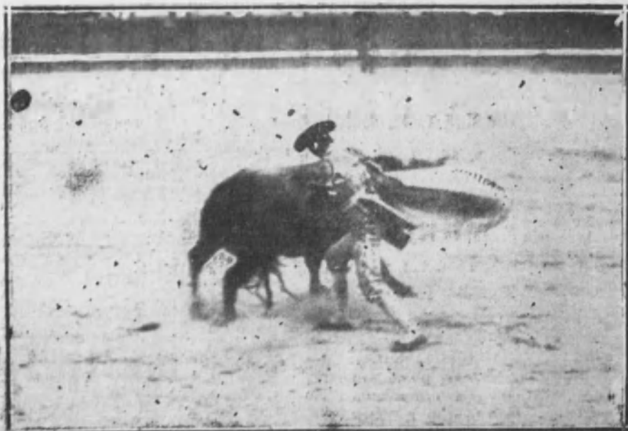
Pastor rematando un quite