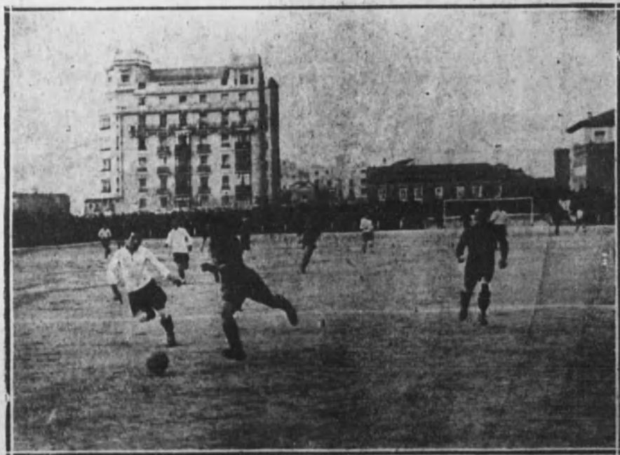
ARENAS-RACING.—Preparando un tanto.