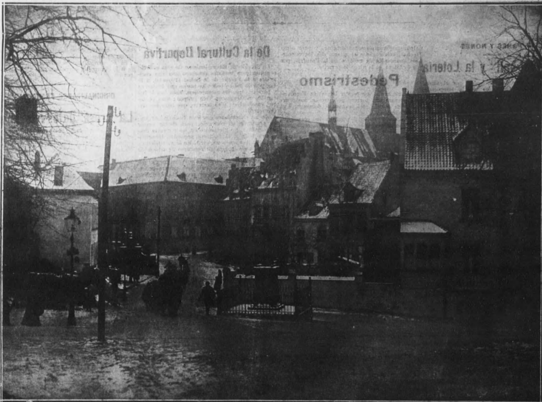
Los reclutas del Ejército belga de ocupación de Alemania, paseando por las calles de Clèves (Prusia).