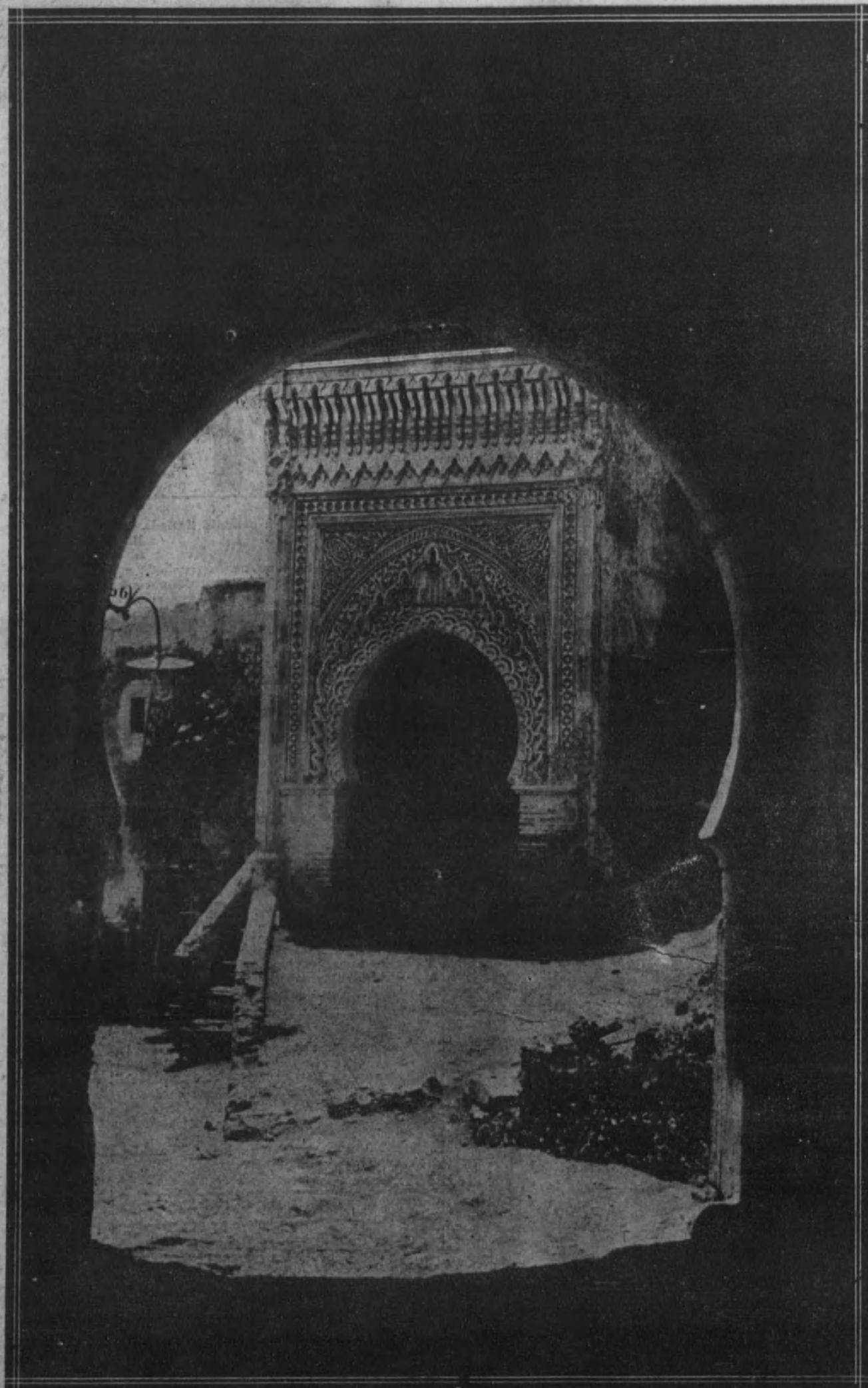
Vista tomada desde la Puerta de Ceuta de la Mezquita árabe, notable monumento de este estilo.