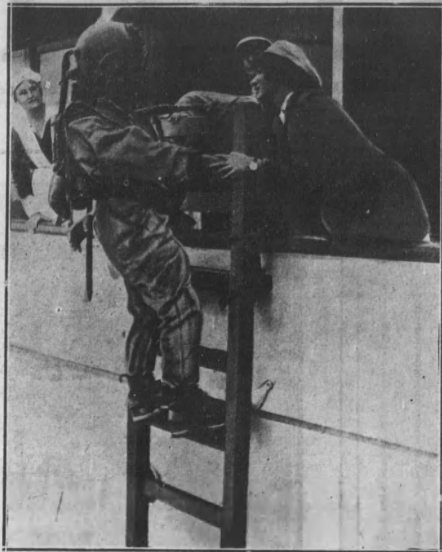
Una escena de la película titulada «El ojo submarino», de los hermanos Williamson.

Esto contraría grandemente a todos los que