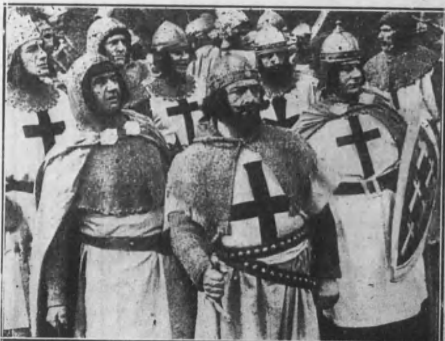
Una escena de la película «Jerusalén, libertada», de Torcuato Tarso, puesta en escena por E. Guazzoni.

Don Juan Lafora cuida con cariño su cartelera y la parte musical. «En las garras del león», «La muchacha americana», «Avaricia», por la incomparable Bertini; «Charlot y los piratas» y «Charlot trasnochador», son aplaudidos con calor por el simpático vecindario de aquel castizo rincón madrileño.