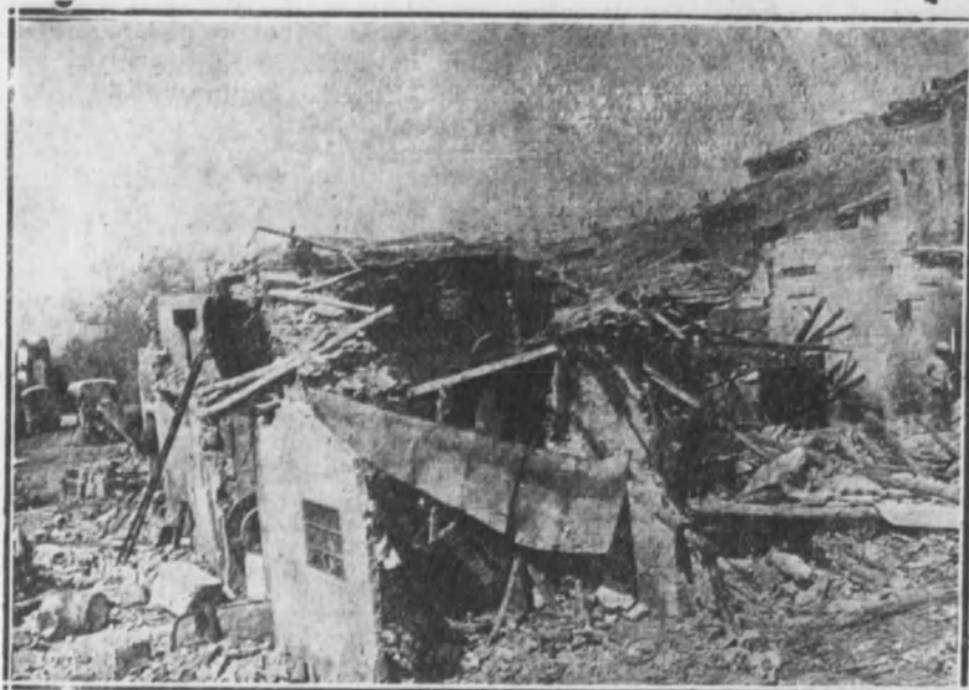
Restos del edificio destinado a bodegas, fábrica de jabones y depósito de orujo, después del siniestro.