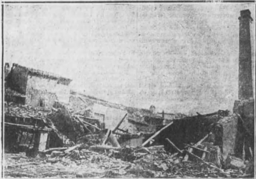
Estado en que quedó, después del incendio, el edificio donde se hallaba instalada la maquinaria, la caldera, la moledora del orujo y otras dependencias.