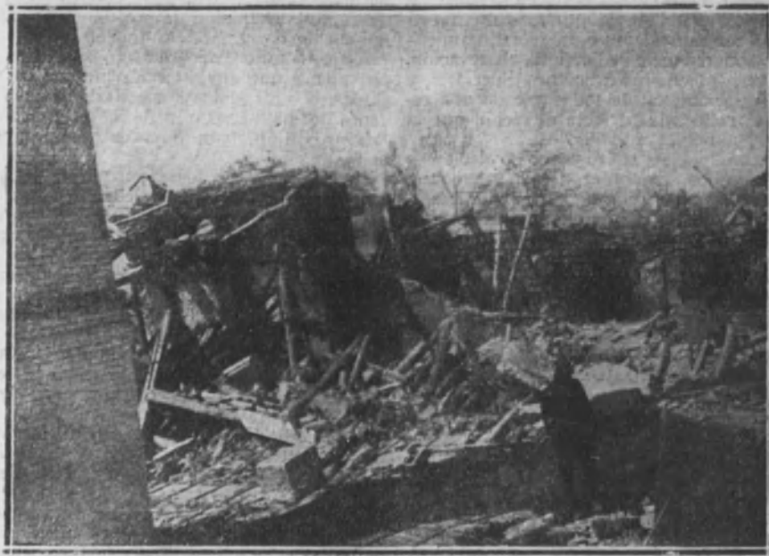
Ruinas del departamento de extractores, en donde estaba instalado el depósito de sulfuro.