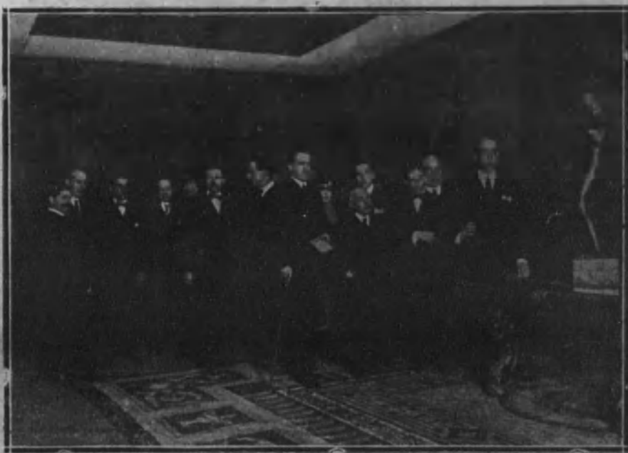
El ministro de Instrucción pública en la inauguración de la Exposición de las obras póstumas de Julio Antonio, celebrada en el teatro Real.