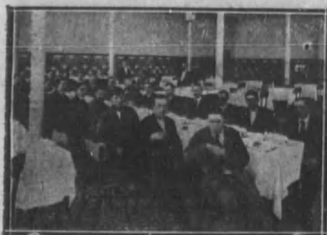
BARCELONA.—Banquete con que fueron obsequiados por su jefe los individuos de una de las secciones del Cuerpo de Somatenes.