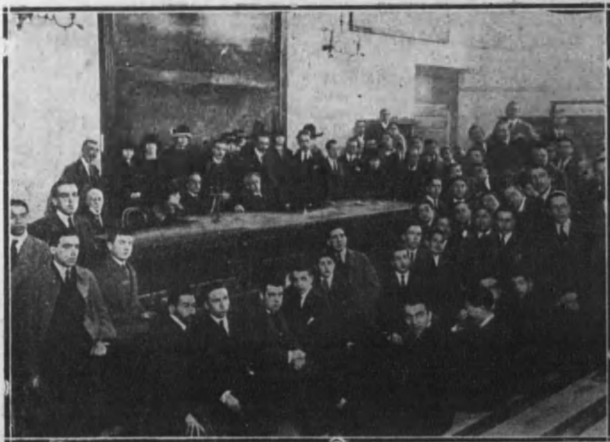
La Mesa que presidió, en la Universidad Central, la Asamblea de confraternidad hispanoamericana, verificada últimamente.