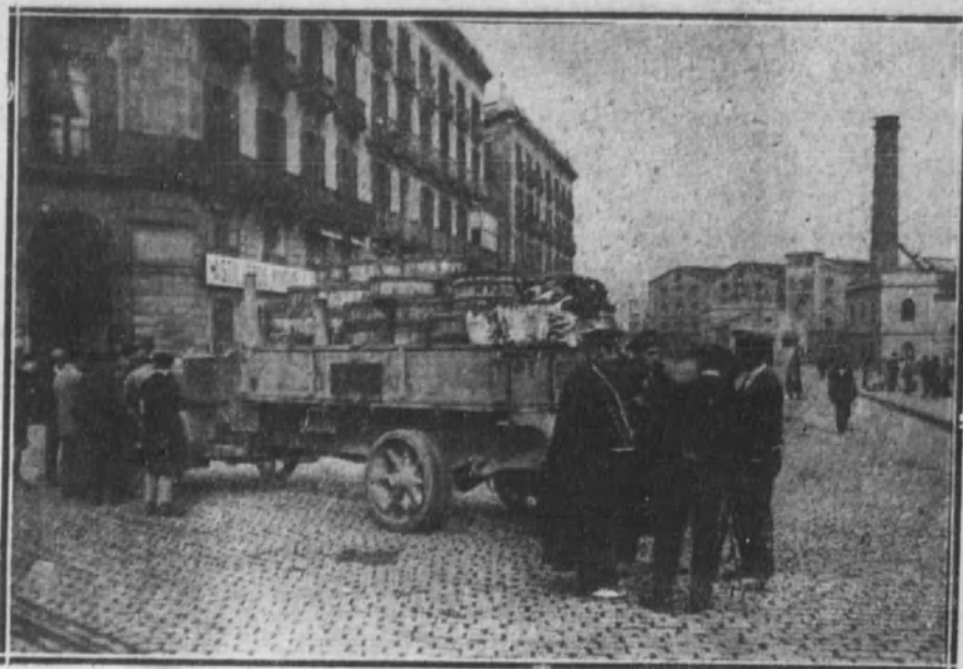
Individuos del «requeté» custodiando en los muelles del puerto un camión automóvil cargado de barricas de bacalao.