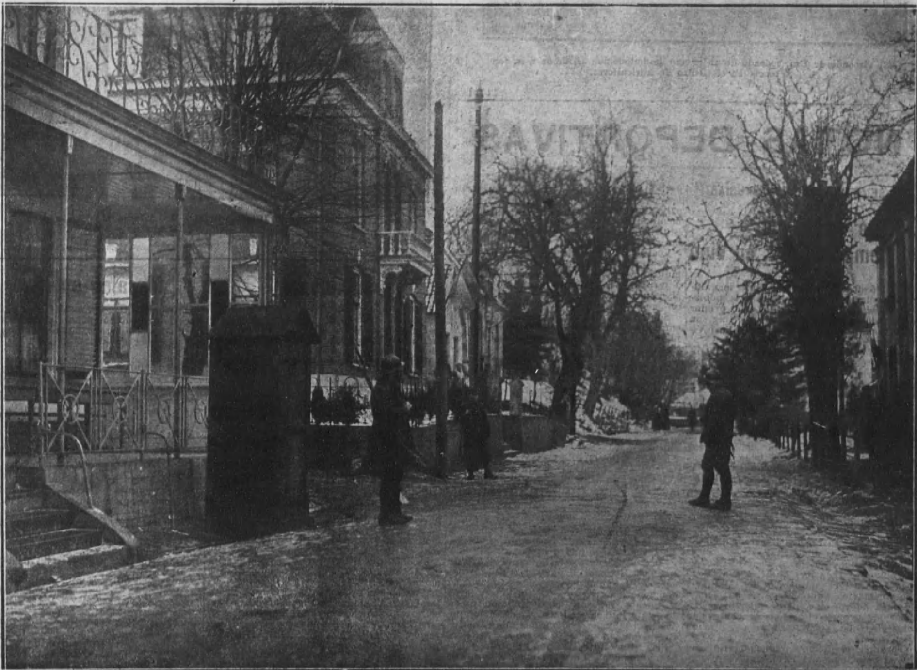
Centinelas holandeses y belgas en la carretera de Nymegen (frontera holandoalemana).