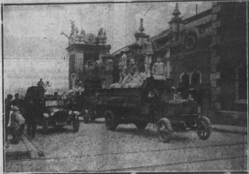
Camiones automóviles transportando harinas desde el puerto al interior de la población para el abastecimiento.