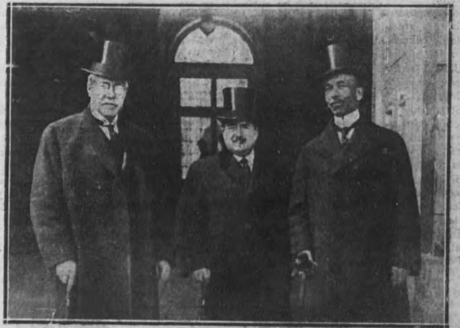
El duque de Tovar acompañado del director y del subdirector del Banco de Nueva York «City Bank», al salir de Palacio, después de visitar a Su Majestad el Rey.