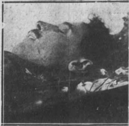
Ultima fotografia del heroico capitán Hidalgo de Cisneros, obtenida antes del sepelio, en la capilla ardiente.