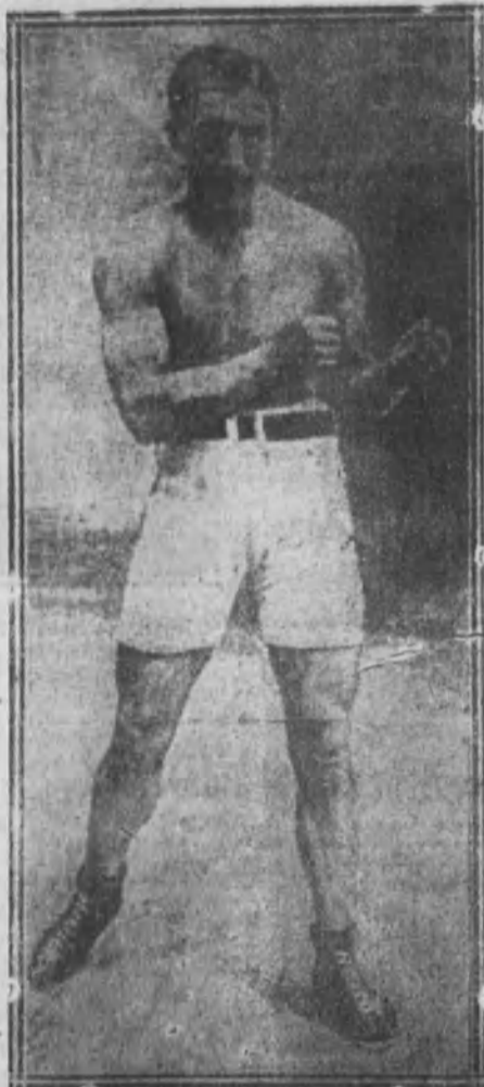
Jorge Carpentier, campeón francés de boxe.