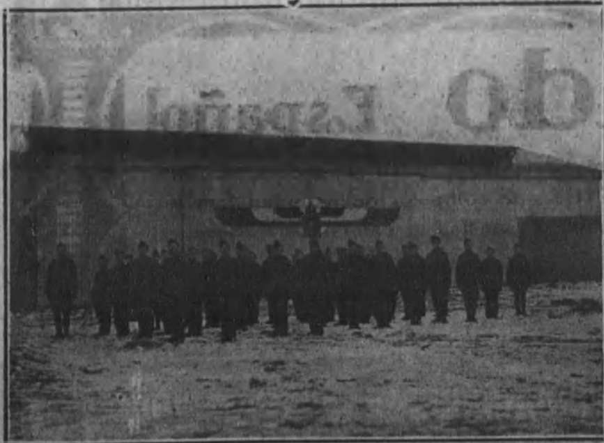
Reclutas belgas haciendo la instrucción delante de un cobertizo alemán de aviación, utilizado actualmente de alojamiento en Cléves (Prusia).