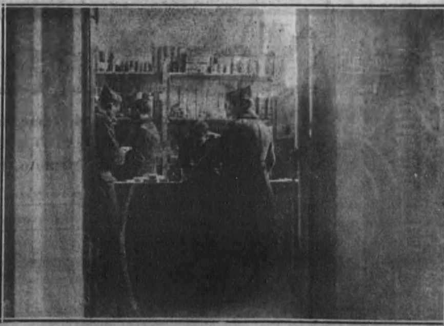
Almacén de abastecimiento para oficiales y soldados, organizado por el ejército belga de ocupación en Cléves (Prusia).