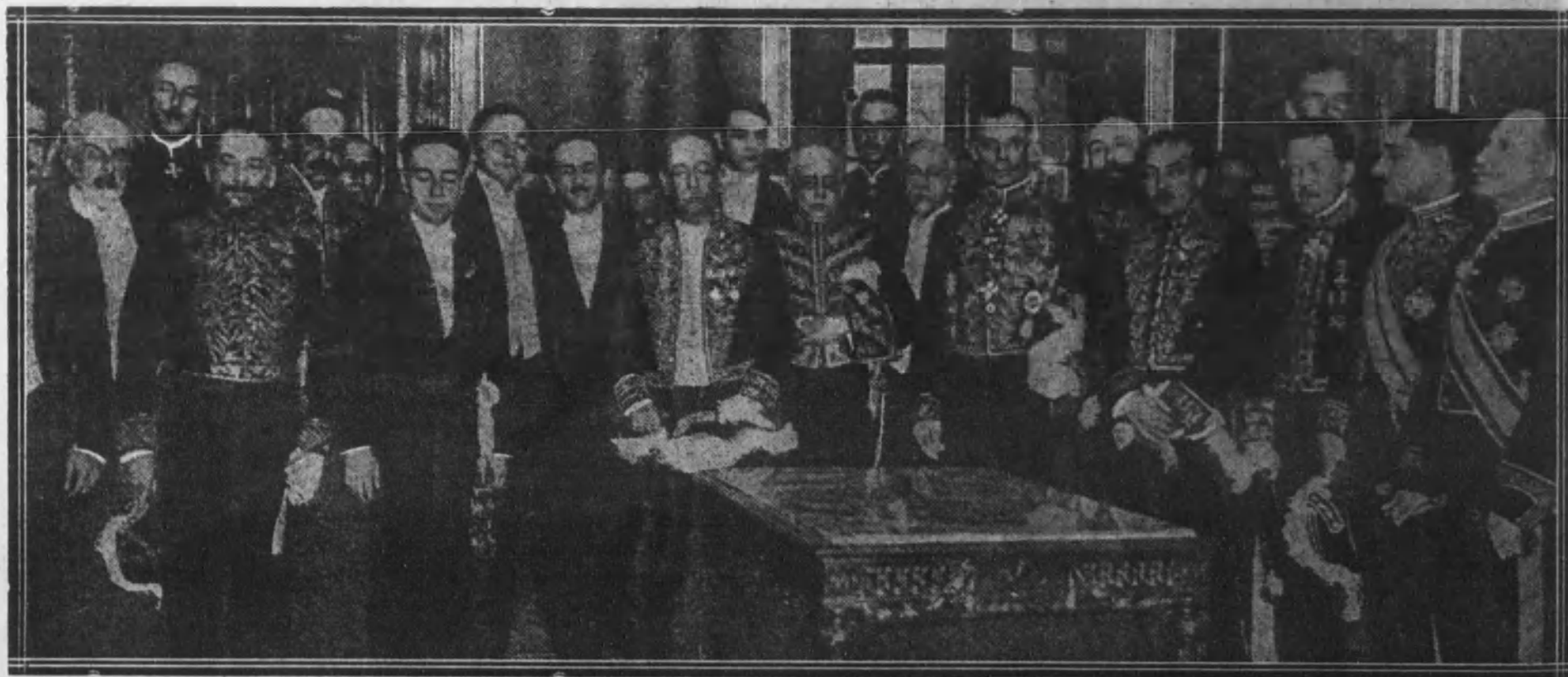
Las Embajadas extranjeras rodeando al presidente electo, en la recepción que les fué ofrecida en la Casa de Gobierno, cuyo acto, verdaderamente democrático, dió lugar a que el nuevo mandatario recibiera del pueblo las más grandes manifestaciones de regocijo y entusiasmo.