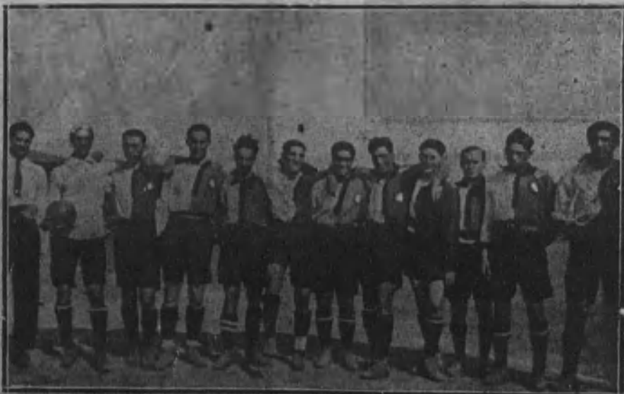
Primer equipo del Sporting Club de Portugal.

Como dato curioso del progreso alcanzado por este deporte en Portugal, podemos decir que suman más de 1.500 jugadores las tres más importantes de Lisboa, siendo considerada como la mejor raquetista Mlle. Plante.