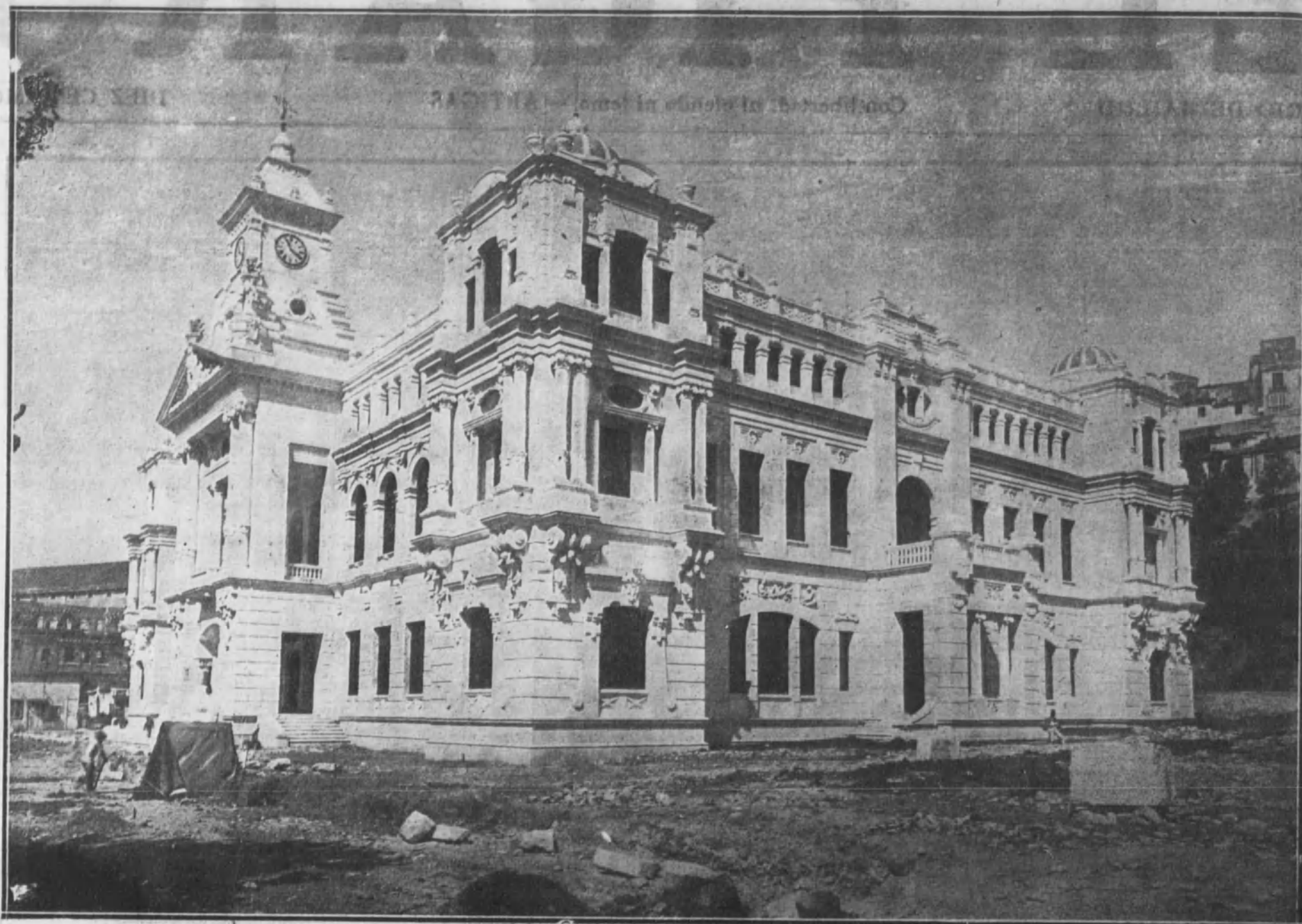
MALAGA.—Vista exterior del nuevo edificio del Ayuntamiento.