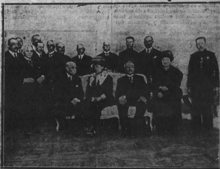
El Sr. Alcalá-Zamora antes de pronunciar la conferencia que dió en el Centro del Ejército y la Armada.