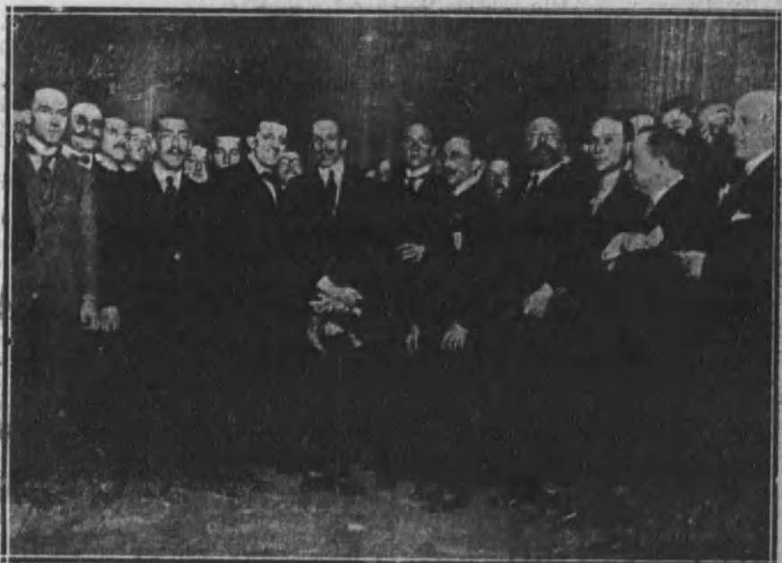
Su Majestad el Rey en uno de los «corros» de la Bolsa, durante su visita de ayer a este edificio.