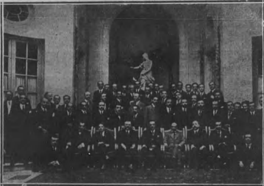
Grupo de asistentes al banquete en homenaje del insigne actor Paco Morano, celebrado en el Ritz.