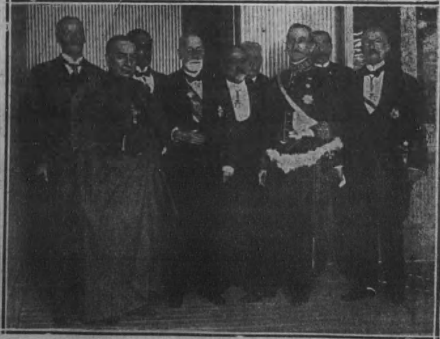
El vizconde de Eza, nuevo académico, después de su recepción en la Academia de Ciencias Morales.