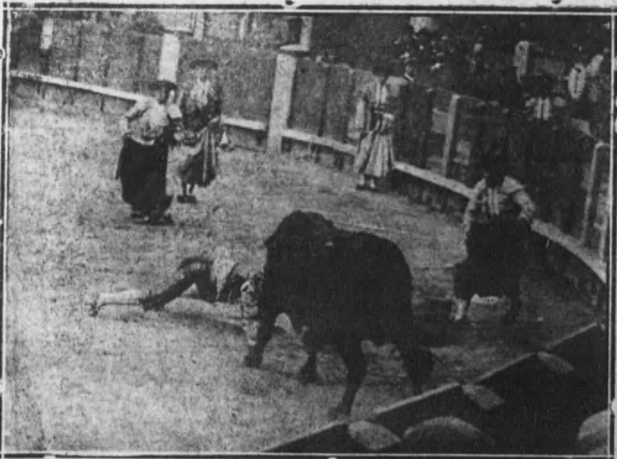
Cogida de Carnicerito en el último toro.