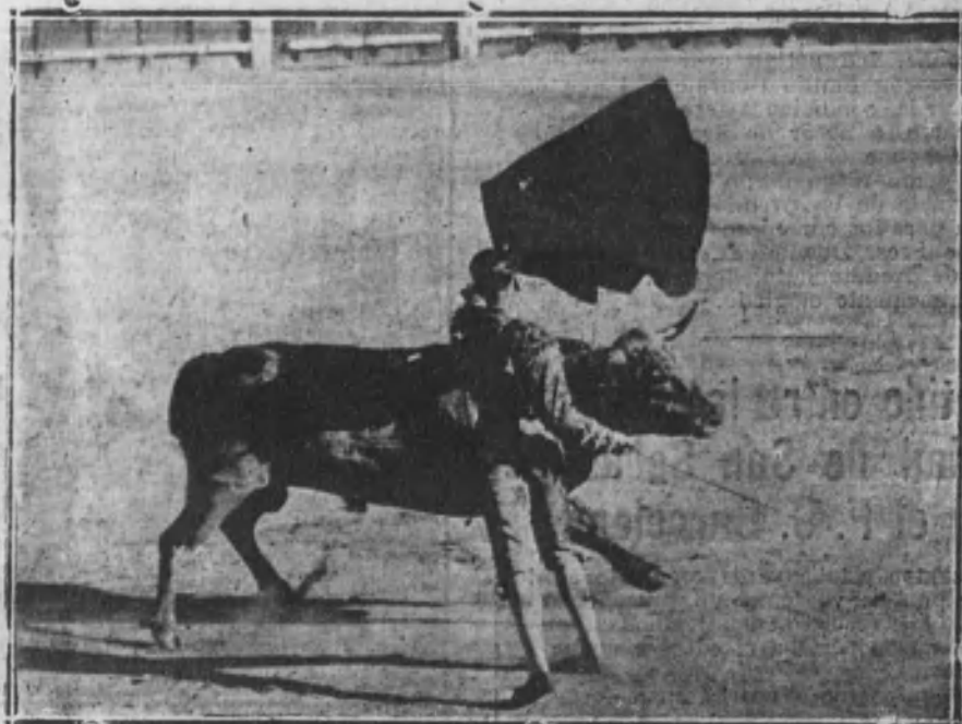
Pastór en un pase de pecho a su primer toro.