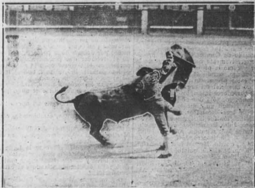
Carnicerito toreando de capa a su toro.