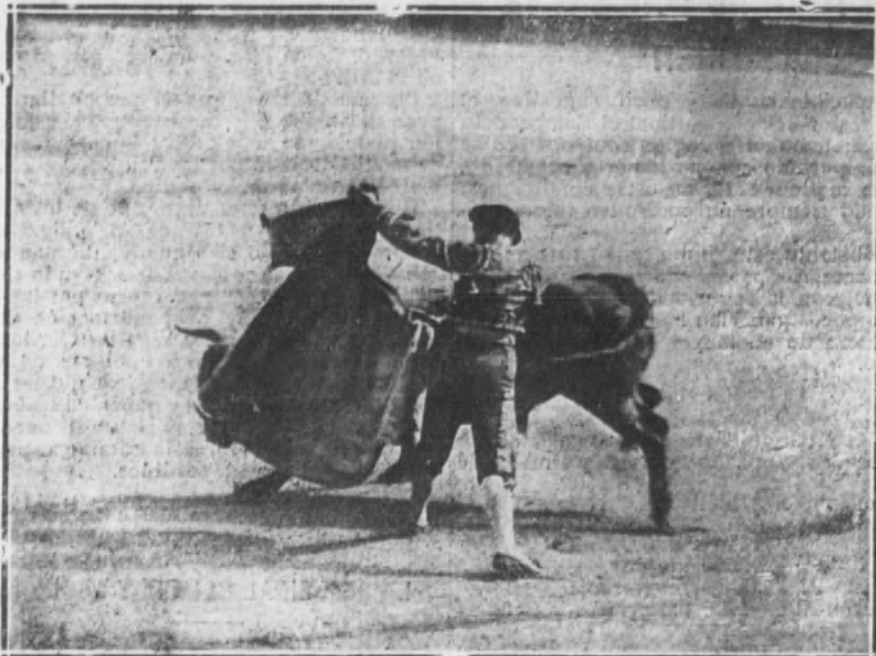
Pastór veroniqueando a su toro.