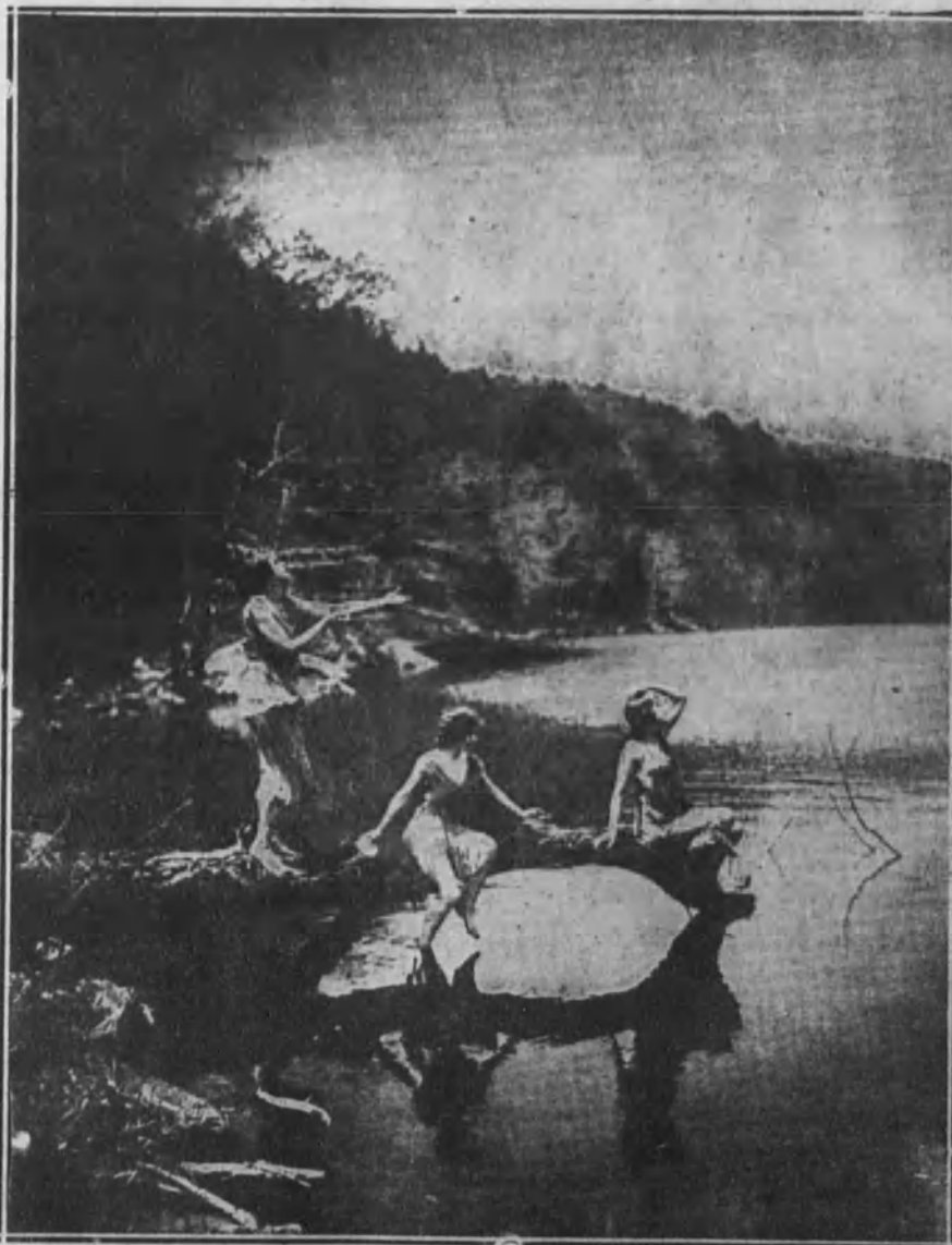
Los espíritus del lago.

Estudio de un grupo de bailarinas que han trabajado en Bar Hårbær, en una notable película.