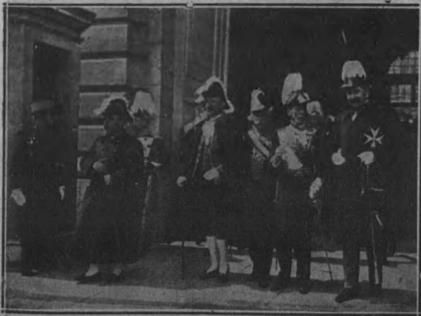
Grandes de España saliendo de la Capilla pública de Palacio, con motivo de la festividad del Domingo de Ramos.