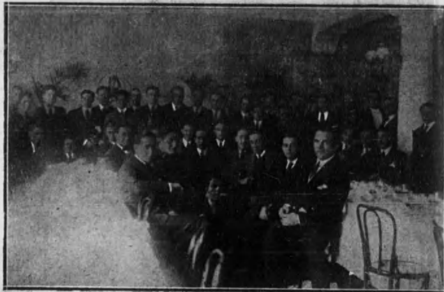
SAN SEBASTIAN.—Los equipos de «hockey» de Madrid, Barcelona y San Sebastián, que han tomado parte en el campeonato de España, reunidos en el banquete con que celebraron el final del campeonato.