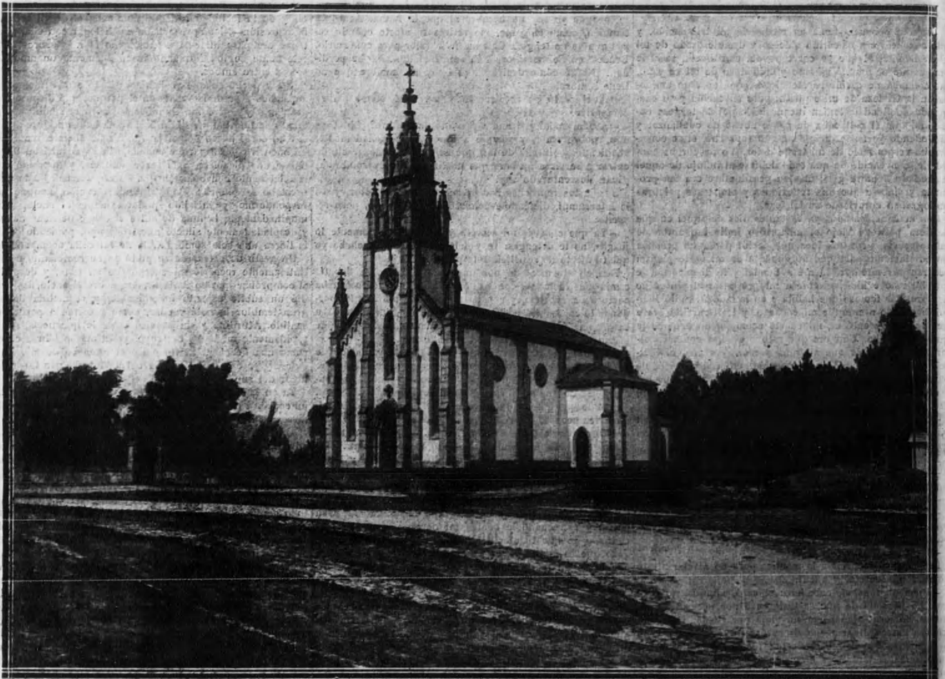
Bello aspecto que ofrece, en el arbolado paisaje, la pequeña iglesia-capilla del hotel «Los Placeres», en las proximidades de la ría, en Pontevedra.