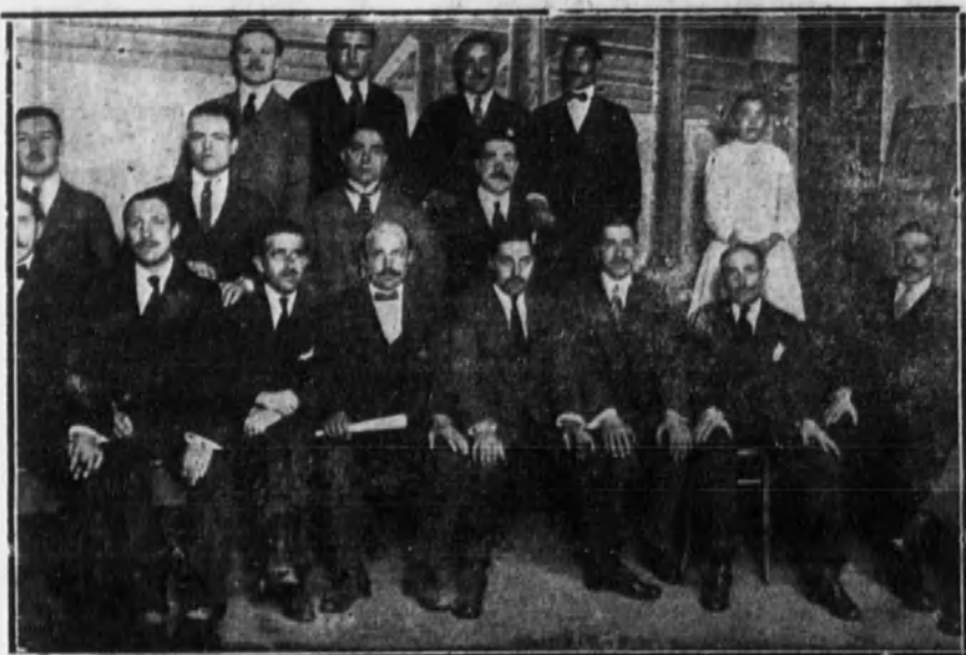
MADRID.—La Junta directiva del nuevo Sindicato general de Dependientes de la Alimentación, reunidos en la Casa del Pueblo.