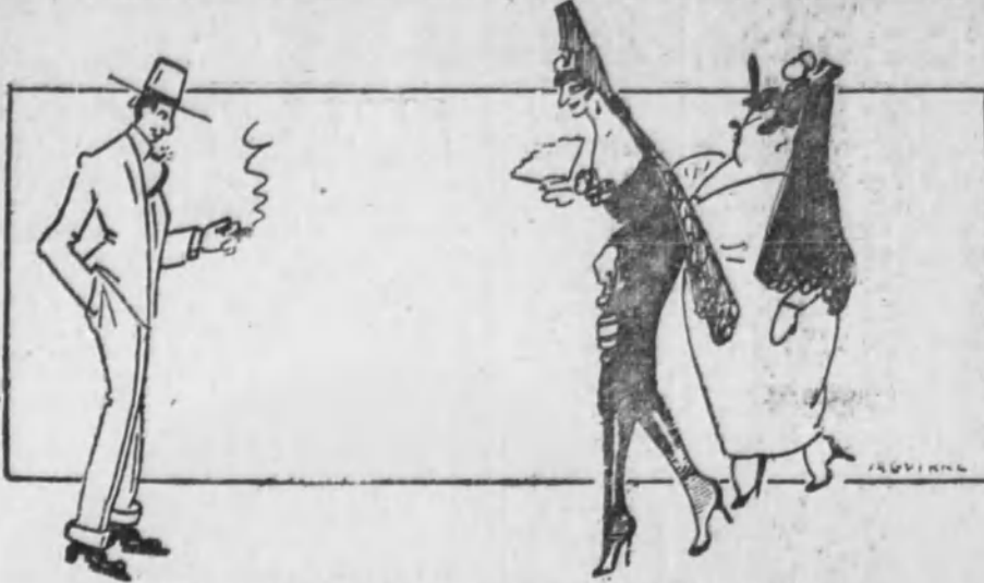
¡LA PRIMERA CORRIDA DE TOROS!