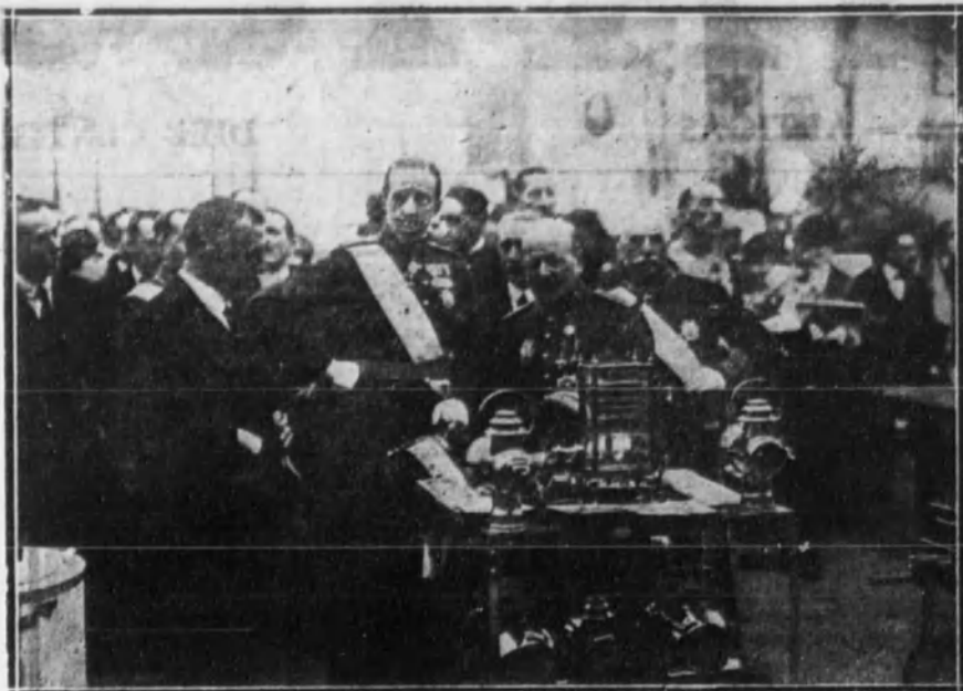
MADRID.—Su Majestad el Rey viendo uno de los aparatos de las instalaciones de la Exposición de Higiene del Palacio de Cristal.