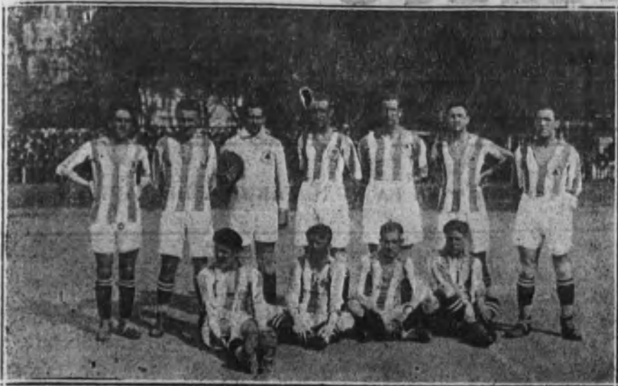
SAN SEBASTIAN.—Equipo de «foot-ball», Real Sociedad que contendió con el F. C. Barcelona.