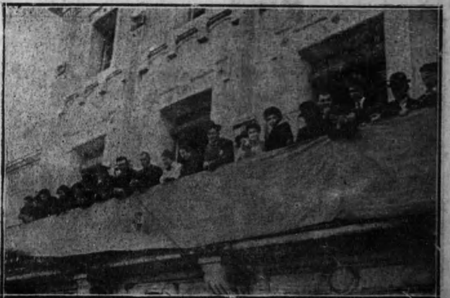
BARCELONA.—Las autoridades durante el concierto del orfeón Tiana.