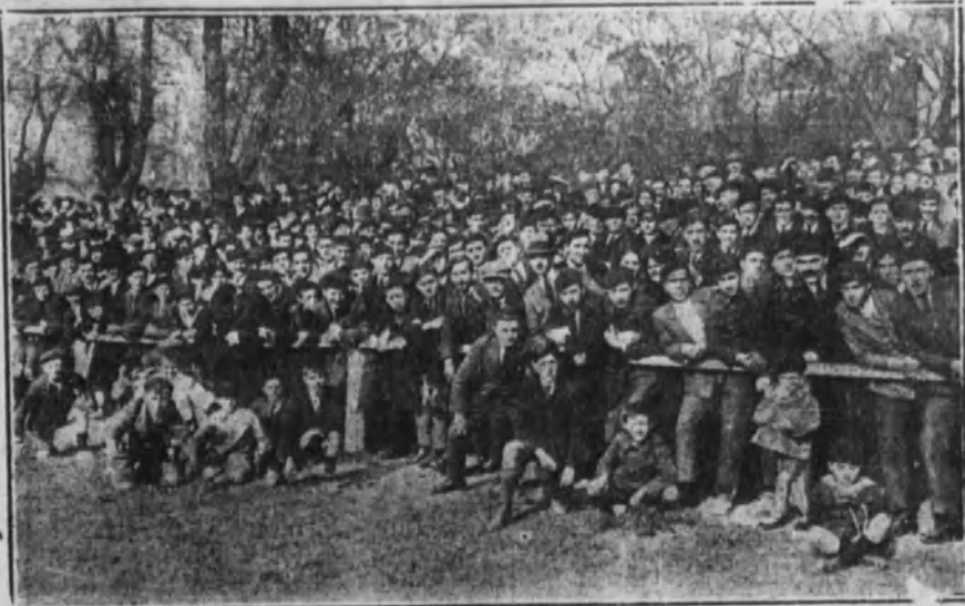
SAN SEBASTIAN.—Aspecto de la tribuna general.