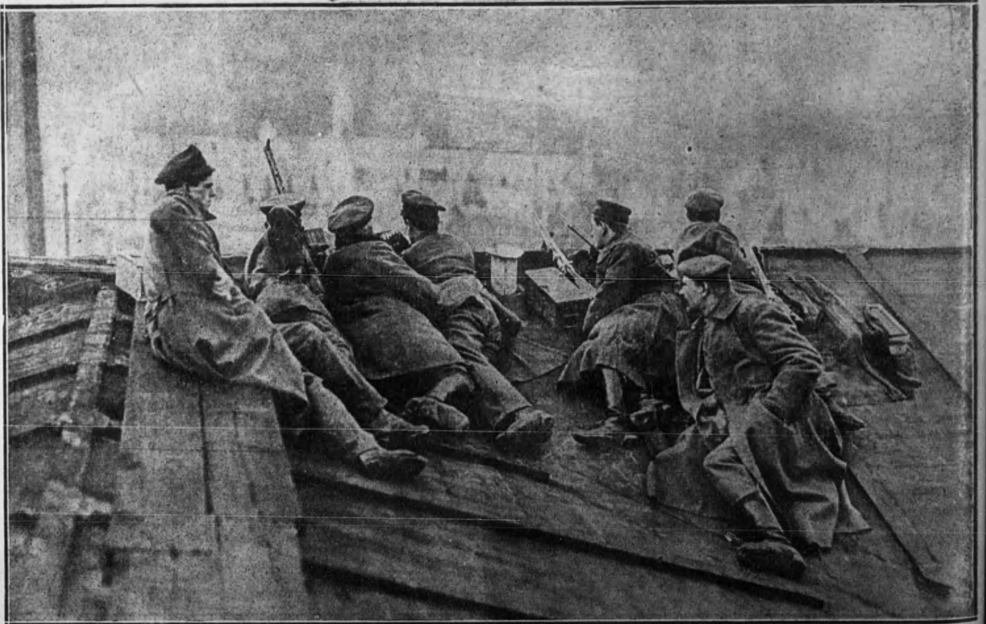
Un grupo de espartaquistas refugiados en la techumbre de un edificio, batiendo a las tropas del Gobierno, durante las últimas luchas revolucionarias ocurridas en Berlín.