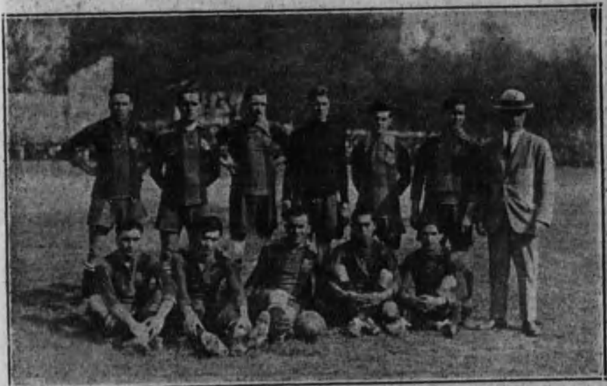
SAN SEBASTIAN.—Equipo F. C. Barcelona, que luchó con el Real Sociedad de San Sebastián, venciendo por 3 a 1 en el partido semi final del campeonato de «foot-ball».