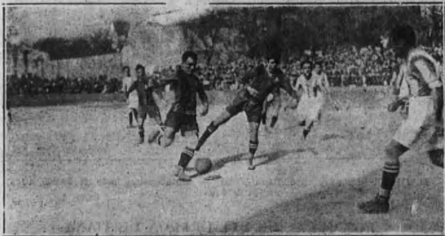
SAN SEBASTIAN.—Un detalle del partido.