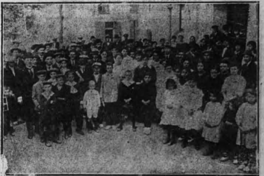
BARCELONA.—Presentación del orfeón frente al Ayuntamiento, antes del concierto.