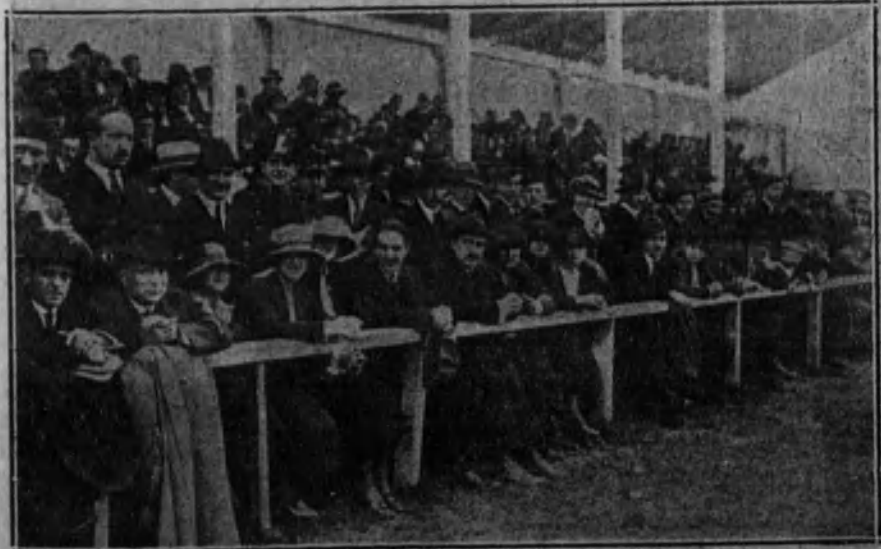
SAN SEBASTIAN.—Aspecto de la tribuna de preferencia.