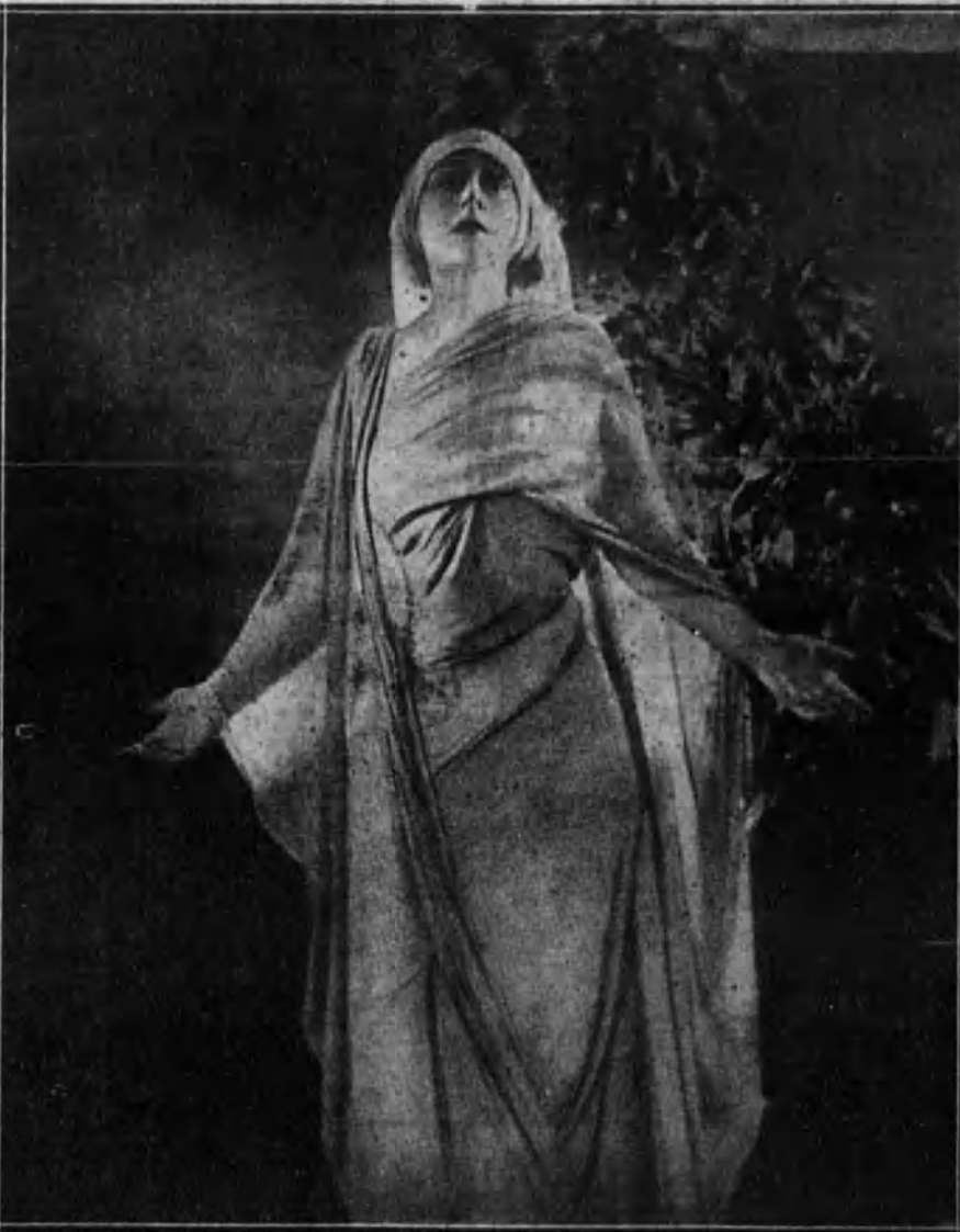
Olga Petrova, eminente actriz rusa, cuyas notables películas constituyen un éxito artístico en el mundo del cinematógrafo.