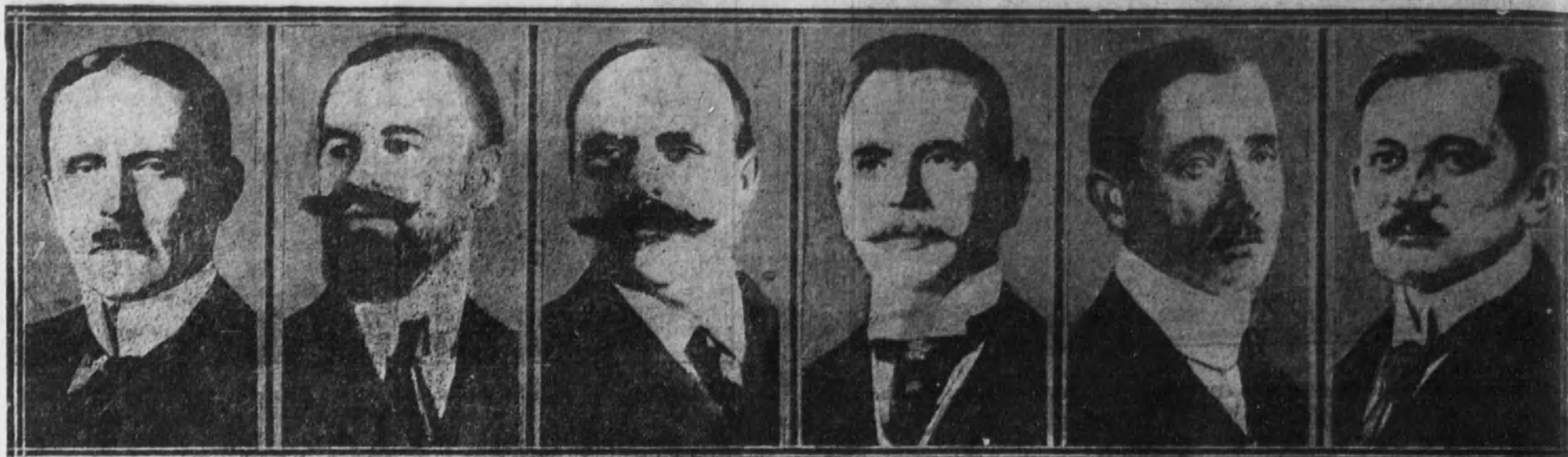
BROCKDORFF-RANTZAU Ministro de Negocios Extranjeros.