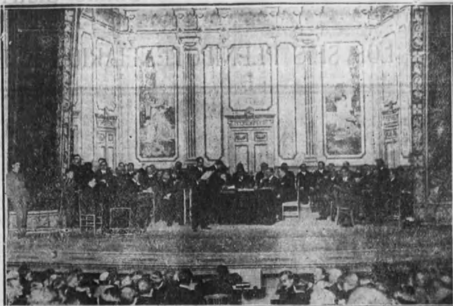
Sesión de clausura del Congreso de Medicina celebrado hoy en el teatro del Centro.