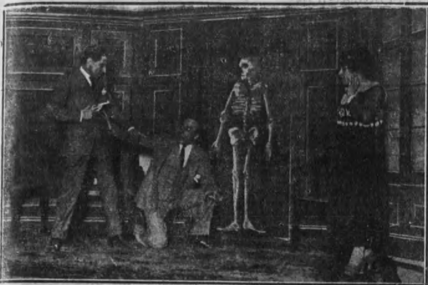
Una escena del melodrama titulado «El hombre que ve a la muerte», estrenado en el teatro Cómico.