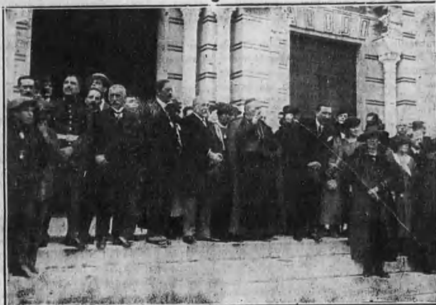
El cardenal arzobispo Sr. Almaraz, en el momento de bendecir los «autos» en la Plaza de América.