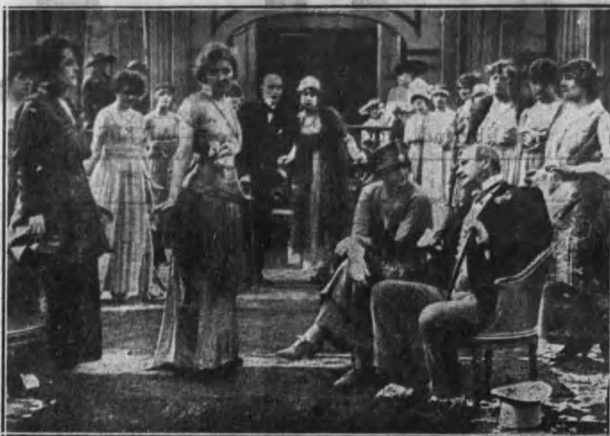
Una escena de la película inglesa de gran éxito «My Lady Dressy», y que en España se proyectará con el título «Las víctimas de la ambición», según ya anunciamos.

No crea, por lo que dicho queda, la linda lectora ni el lector meticoloso, que la obra es inmoral. Al contrario: precisamente va contra la inmoralidad del siglo con una valentía extraordinaria.