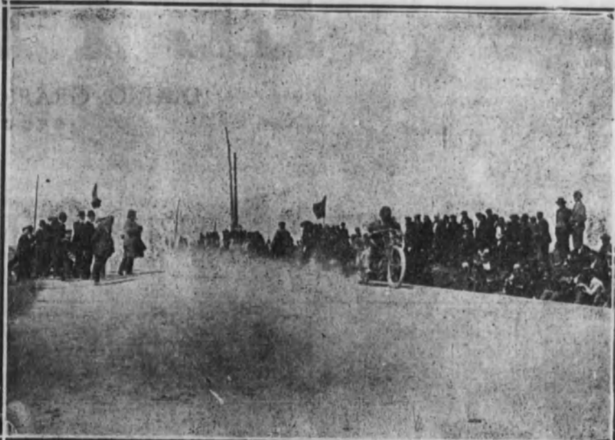
Salida de un corredor de «moto» en la prueba del kilómetro lanzado.