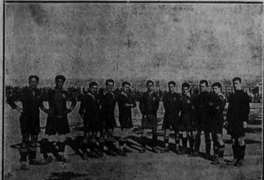
«FUT-BOLL».—El equipo de Barcelona que jugó contra el Sevilla, quedando vencedor.