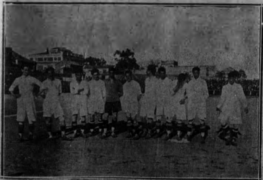
«FUT-BOLL».—El equipo Sevilla, que quedó vencido por el equipo del Cataluña.

Según telegramas de última hora, y aunque escasos de detalles, sabemos que el Madrid ha vencido al Stadium, de Oviedo, por 4 a 1, y que el Real de Vigo ha triunfado en el campo del Racing de Santander contra el Sporting, de Gijón, por 3 a 0.