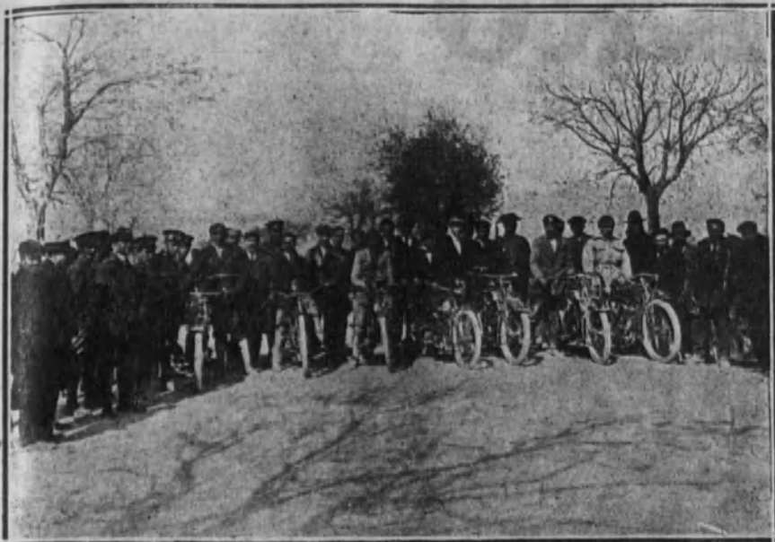
Corredores que tomaron parte en las carreras de motocicletas.