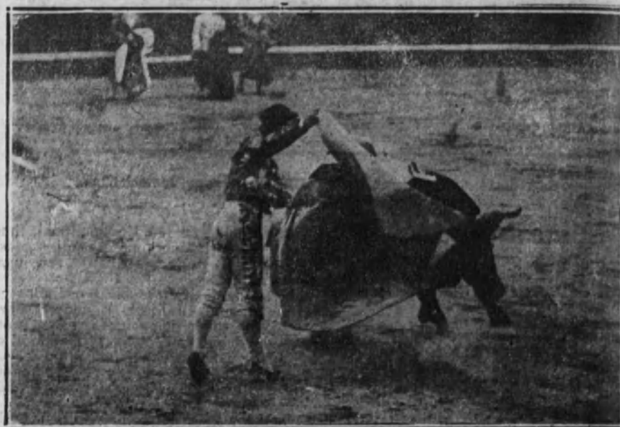
Gaona toreando de capa a su toro.