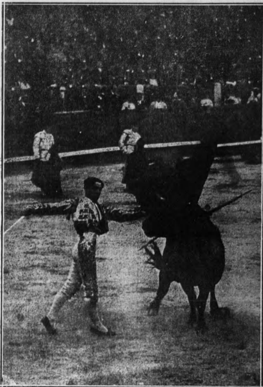
El diestro Camará muleteando a su toro.