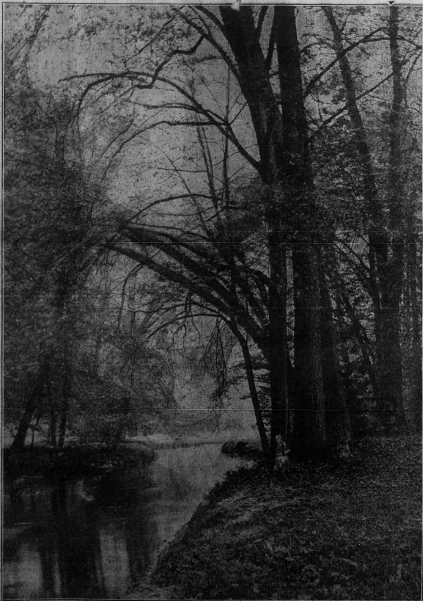
Vista de un recodo del río Cabe, en las cercanías de Monforte (Lugo).