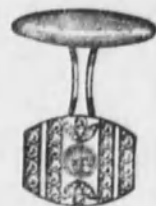
Núm. 4.—Con cuatro brillantes, dos zafiros y rosas, sobre platino. El par. Ptas. 315