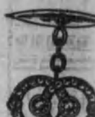
Núm. 16.—Con diez brillantes y rosas, sobre platino. Ptas. 570