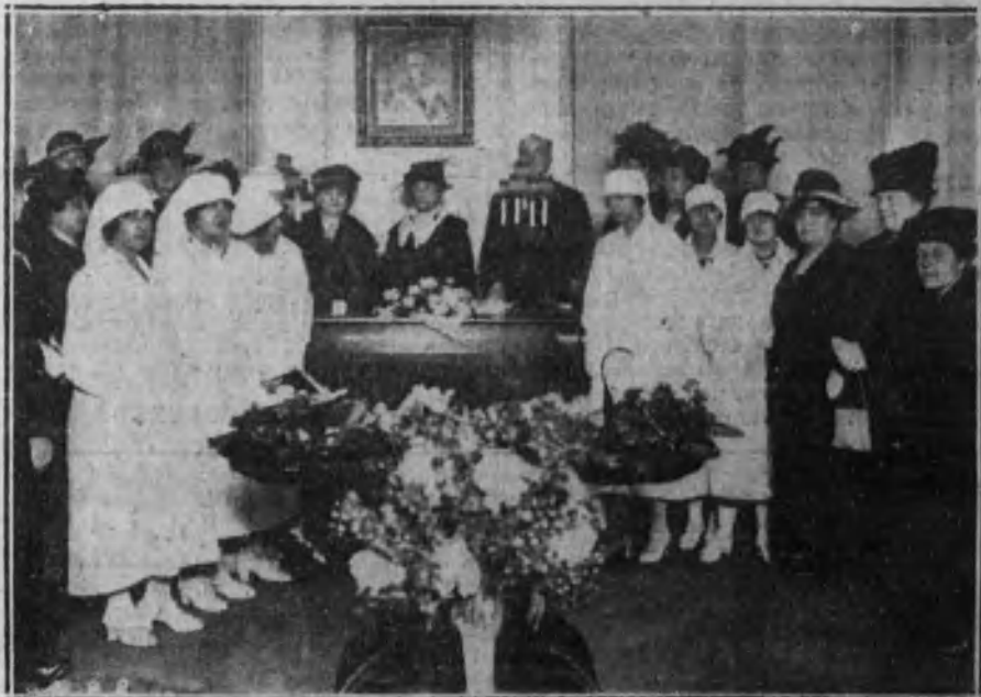
Homenaje a Sofía Casanova por el Comité Femenino de Higiene Popular, celebrado en el ministerio de la Gobernación