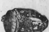
Núm. 3.—Oro macizo cincelado. Ptas. 150