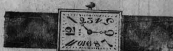
Núm. 25.—Con pulsera de cuero, forma rectangular, áncora superior. En oro de ley 18 K. Ptas. 165