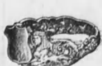
Núm. 1.—Oro macizo cincelado. Ptas. 95