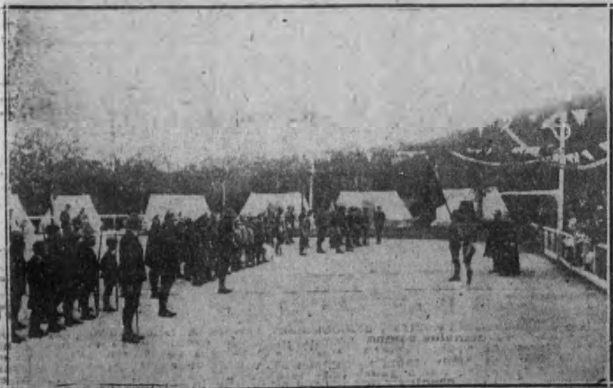
Momento de prometer los nuevos exploradores