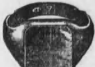
Núm. 2.—Oro macizo mate. Ptas. 90