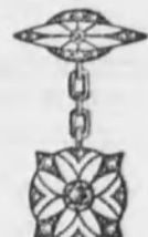
Núm. 5.—Con dos brillantes y rosas, sobre platino. El par. Ptas. 350