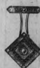
Núm. 15.—Con ocho brillantes, rosas y zafiro, sobre platino. Ptas. 540