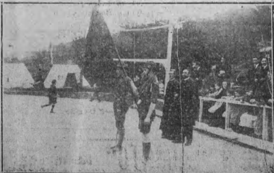
El jefe de la tropa tomando la promesa a los exploradores