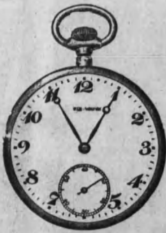
Núm. 21.—Lepine extraplano, áncora de precisión, 15 rubíes, espiral Breguet. En oro de ley 18 K. Ptas. 165