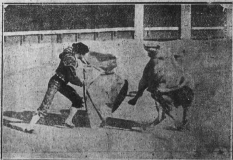
El diestro Valencia II torea lo de capa a su primer toro.