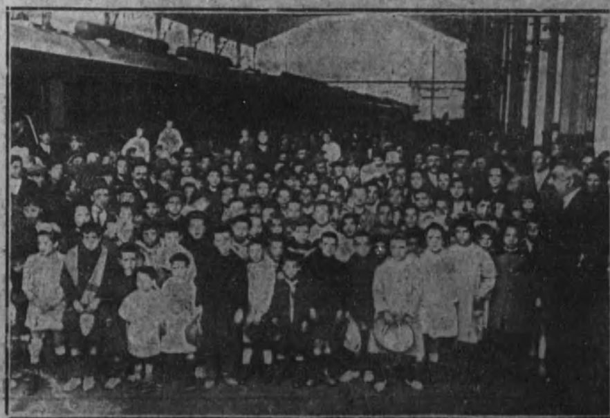
Niños de las Escuelas municipales que han salido para las colonias escolares