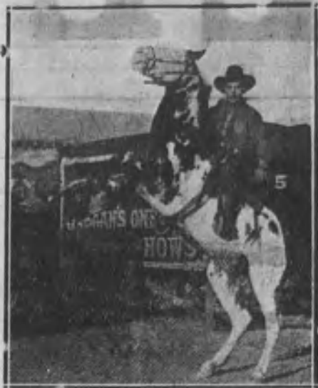
La fotografía representa al actor Antonio Moreno en su caballo Sullán , tan popular en Los Angeles.

Y mientras se aclara si Charlot es o no de Madrid, de éste, siempre que no salga por ahí alguien que le enmiende la fe de bautismo, podemos decir que es nacido en Madrid. Su nombre entero es Antonio Garrido. Monteagudo Moreno.