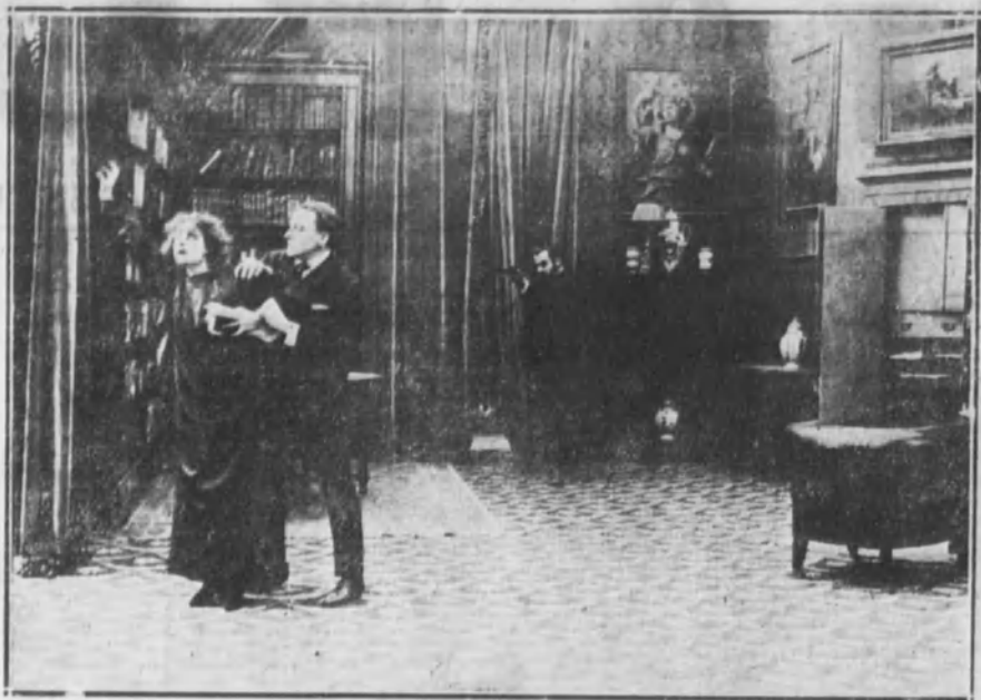
Una escena de la notable cinta que presenta la Casa J. Verdaguer, «La mujer de Claudio», inspirada en la célebre obra de Alejandro Dumas, hijo, y que próximamente se estrenará en Madrid.