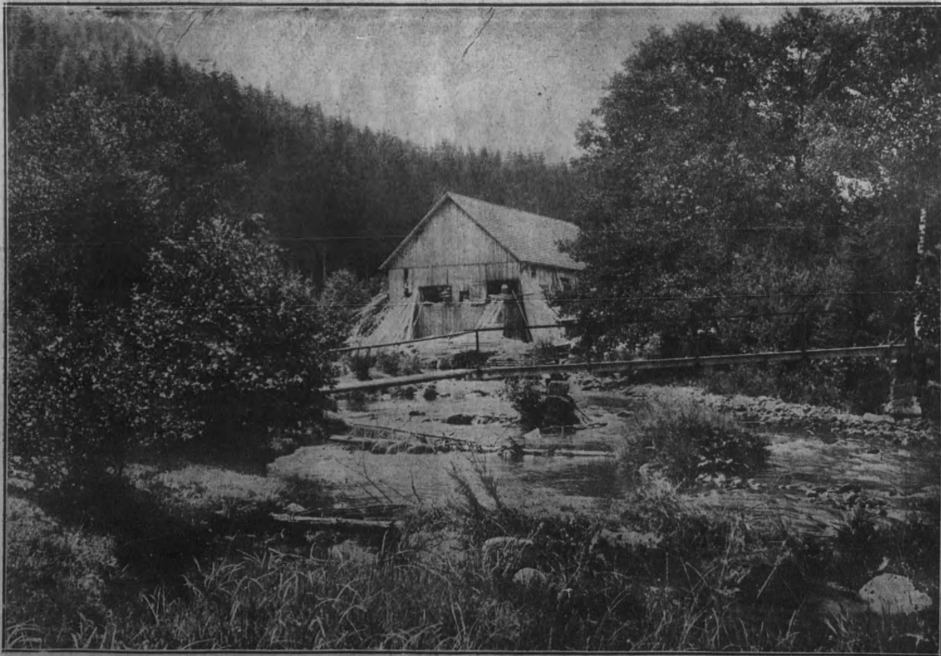
CALIFORNIA (E. U. A.).—Un almacén de aserrar maderas instalado en pleno bosque.