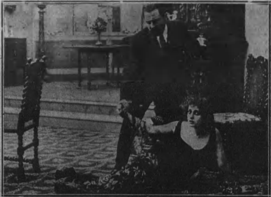
Otra escena de «La mujer de Claudio».

Auguramos—esto si se nos puede permitir—un éxito loco de arte y pesetas a las Empresas del Royalty e Ideal, en cuyos salones se estrena mañana lunes.