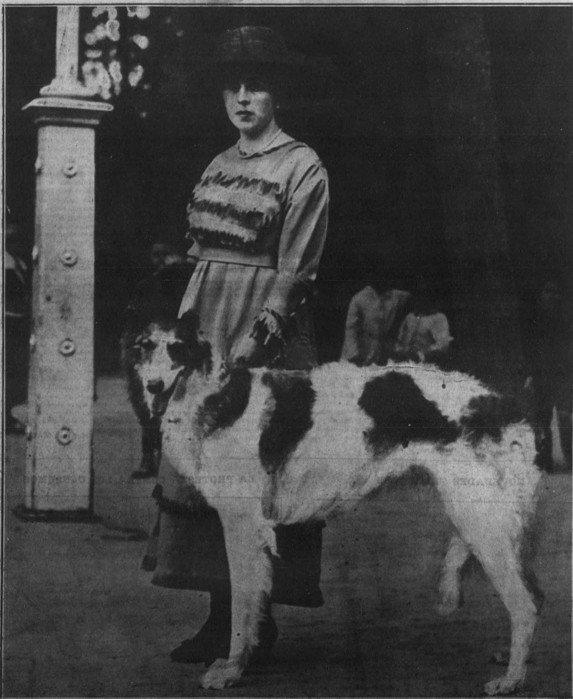
Una señorita con un precioso ejemplar de galgo ruso, que se exhibe en la Exposición.