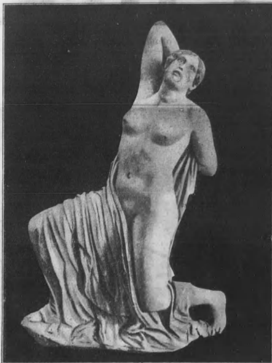
Famosa escultura de Niobe, disputada entre Milán y Roma. Esta bella figura, descubierta en el emplazamiento de los antiguos jardines de Salustio, formaba parte de uno de los cuatro grupos de Niobes que existían en la antigua Roma, cuando fué saqueada por los godos al mando de Alarico.

Apolo había nacido en Delos, una de las islas Cícladas, las dispuestas en círculo. Era hermoso. Gracioso rizo de oro le caían sobre las espaldas, y su cuerpo era toda una magnífica escultura. Contaba y tocaba la lira. Era, además, un dios valiente; con sus flechas mató a la serpiente Pitón, que perseguía a su madre. La poesía, la música, la elocuencia, las artes y la medicina eran por él dominadas. Esculapio, que sobresalía en la medicina, era hijo suyo. Lo tuvo de la