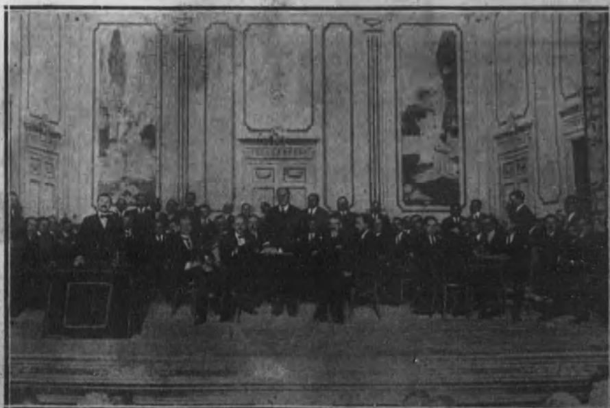
La presidencia del mitin celebrado ayer mañana en el teatro del Centro por el gremio de taberneros.