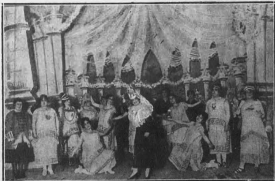
Una escena de la zarzuela «El fin de los caciques», estrenada en el teatro Martín.