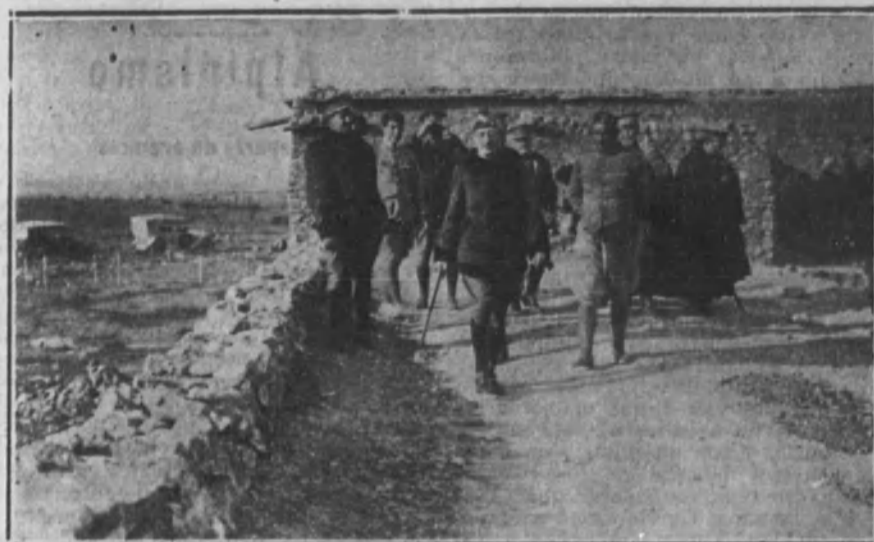
MELILLA.—El general Aizpuru recorriendo la Alcazaba de Hach Amar, acompañado de su Estado Mayor y de los oficiales de este nuevo puesto.