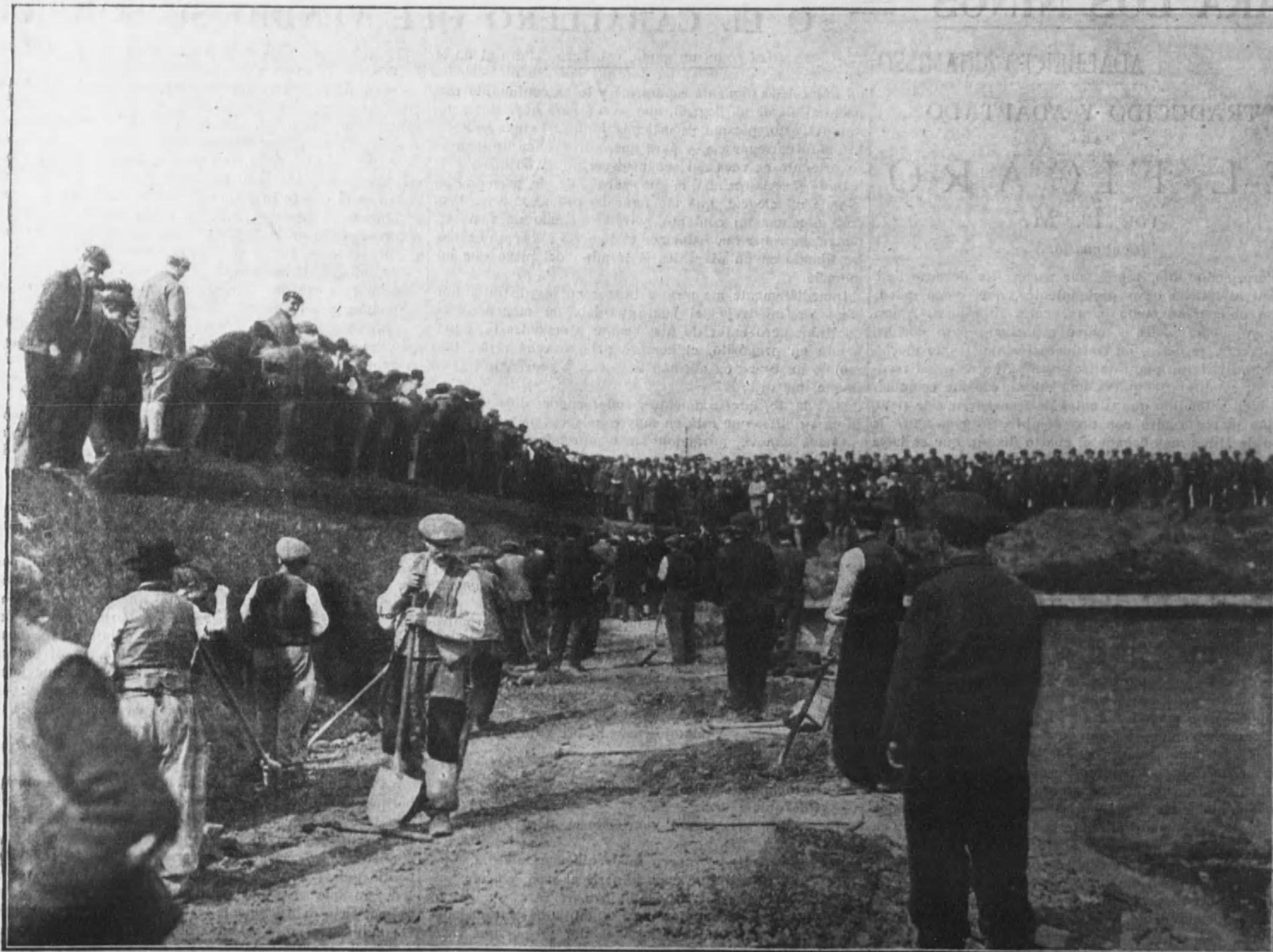
El público parisiense presenciando los trabajos de demolición de las fortificaciones del campo atrincherado de París, cuyas defensas fueron construidas durante el primer año de guerra.