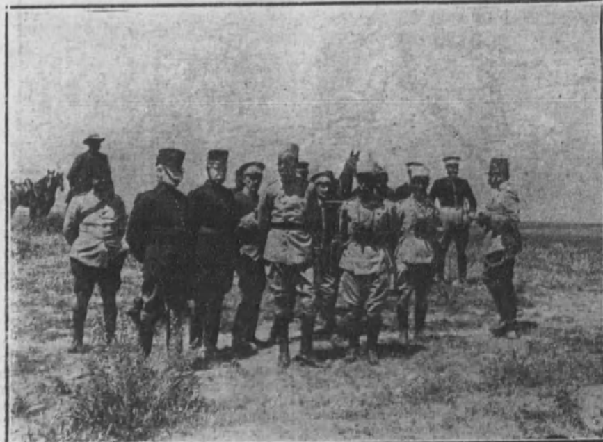
Su Majestad el Rey con su Estado mayor, presenciando el supuesto táctico.