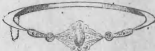
Núm. 3.215.—Zafiro, cuatro brillantes y diamantes rosas. 365 Ptas.