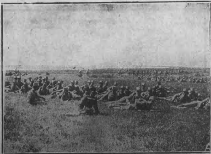
Un descanso en la retaguardia.