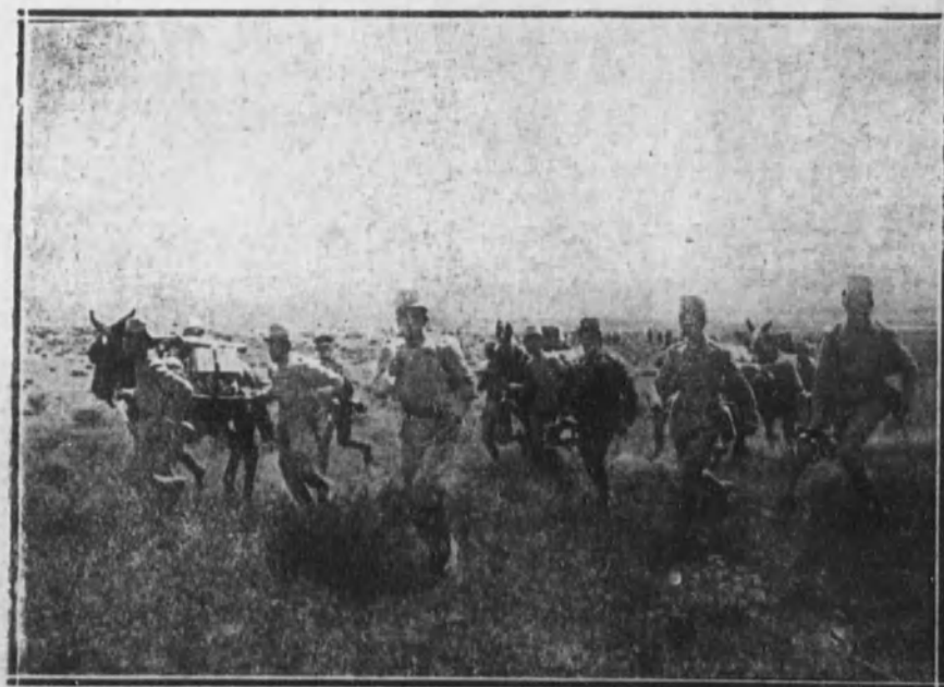
La sección de ametralladoras corriendo a emplazarse.