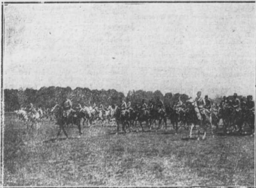
Avance de la caballería.