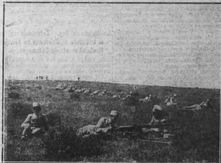
Línea de fuego de fusiles y ametralladoras.