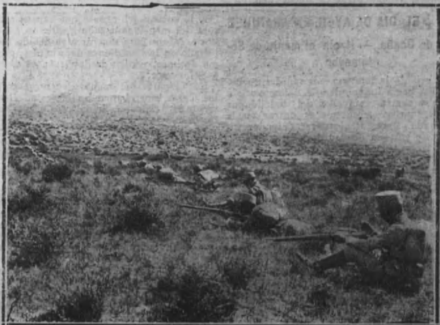
Guerrilla asparando cuerpo en tierra.