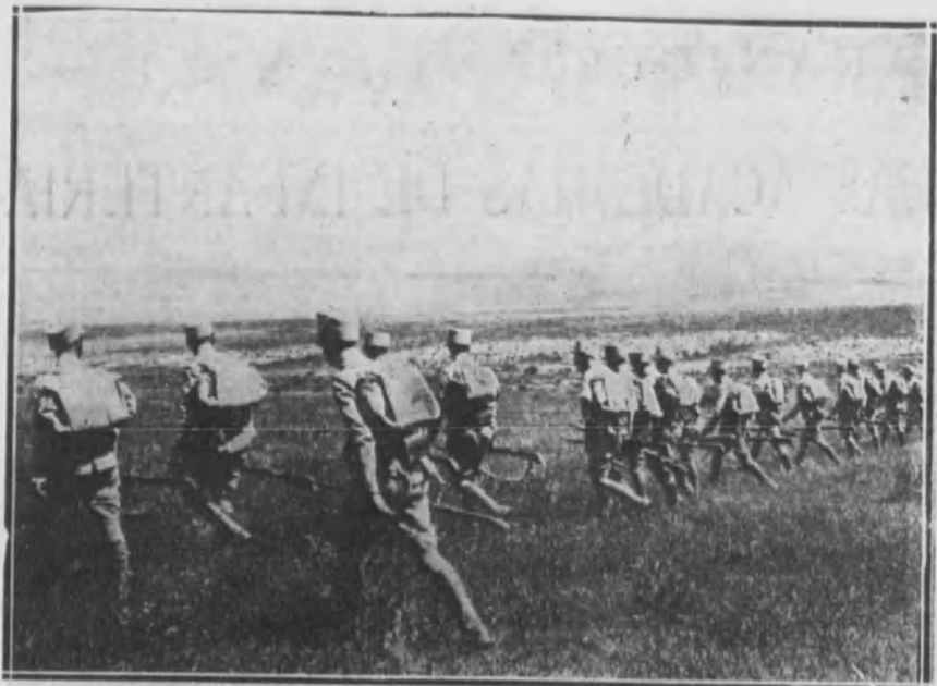
Avanzando en guerrilla.

Prácticas de la Academia de Infantería.- Llegada del Rey a Aranjuez.- Entusiasta recibimiento.- Hacia el monte de Sotomayor.- Las maniobras.- El almuerzo en los Jardines del Príncipe.- Desfilé de fuerzas.- Regreso del Rey.