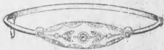
Núm. 3.159.—Tres brillantes y diamantes rosas. 360 Ptas.

JOYERIA, PLATERIA Y RELOJERIA J. HERNANDEZ Y G. A ADROVER (S. en C.) SUCESORES DE REDONDO Carretas, 39 — MADRID — ALHAJAS DE TODAS CLASES A PRECIOS MUY ECONÓMICOS