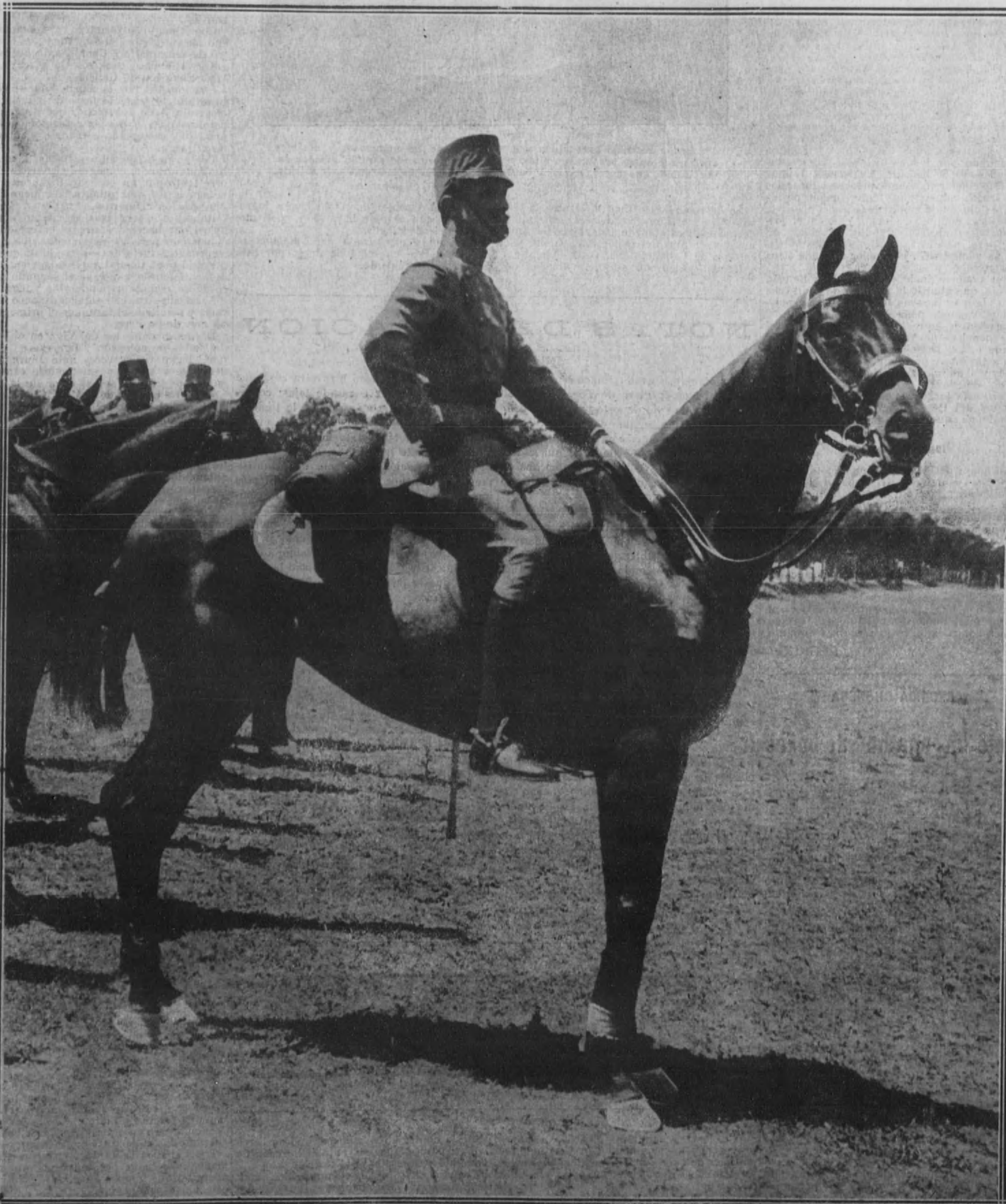
Su Majestad el Rey, montado en su yegua «Wynfield», presenciando las maniobras efectuadas por los alumnos de la Academia de Infantería.