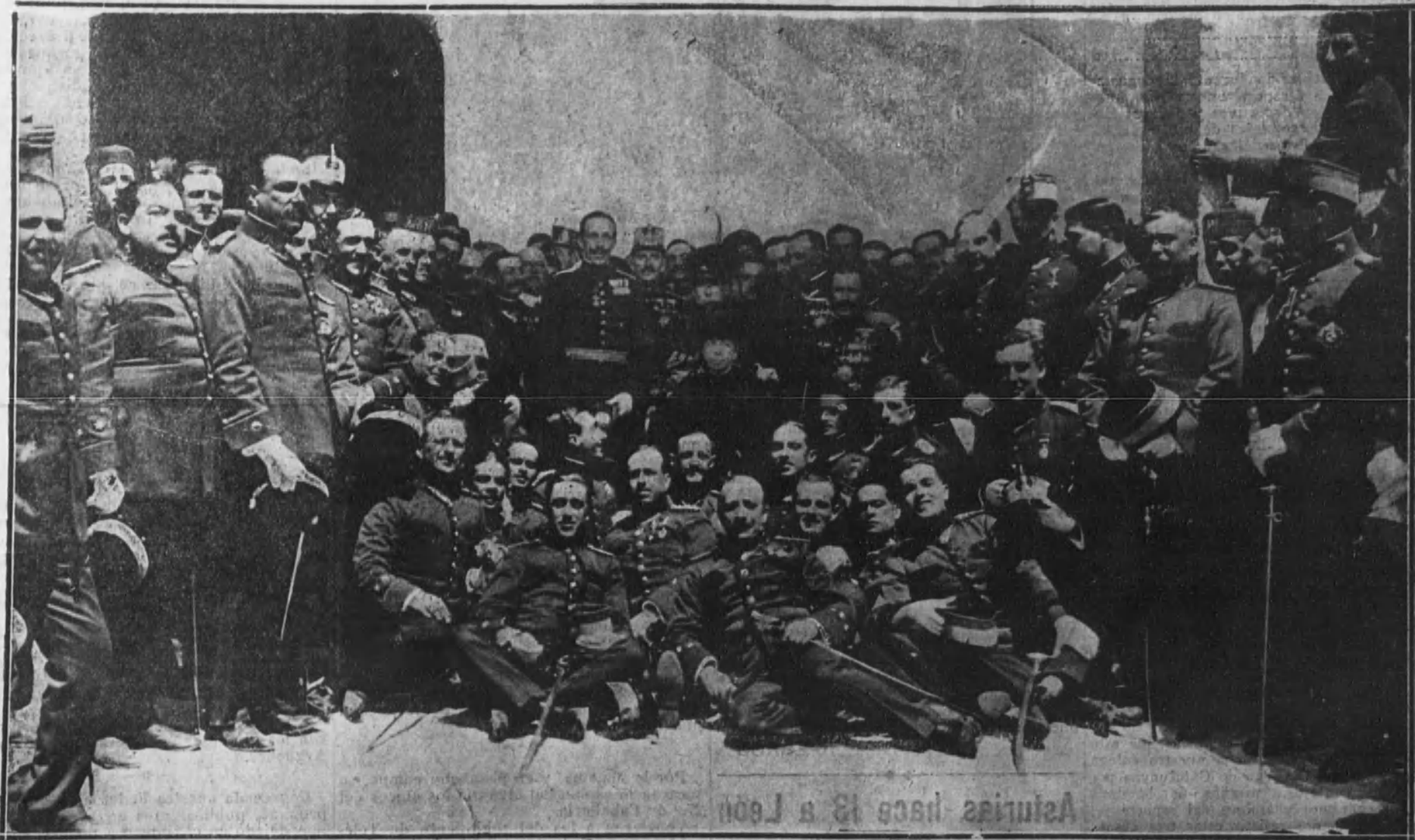
Su Majestad el Rey, la Reina doña Cristina y los Infantes, rodeados de los jefes y oficiales del regimiento de Covadonga, después de la ceremonia religiosa. En el cuartel de la Montaña se celebró ayer mañana la solemne ceremonia de bendecir la imagen de Nuestra Señora de Covadonga, que los marqueses de Carillejas regalaron al regimiento de Infantería de aquel nombre.