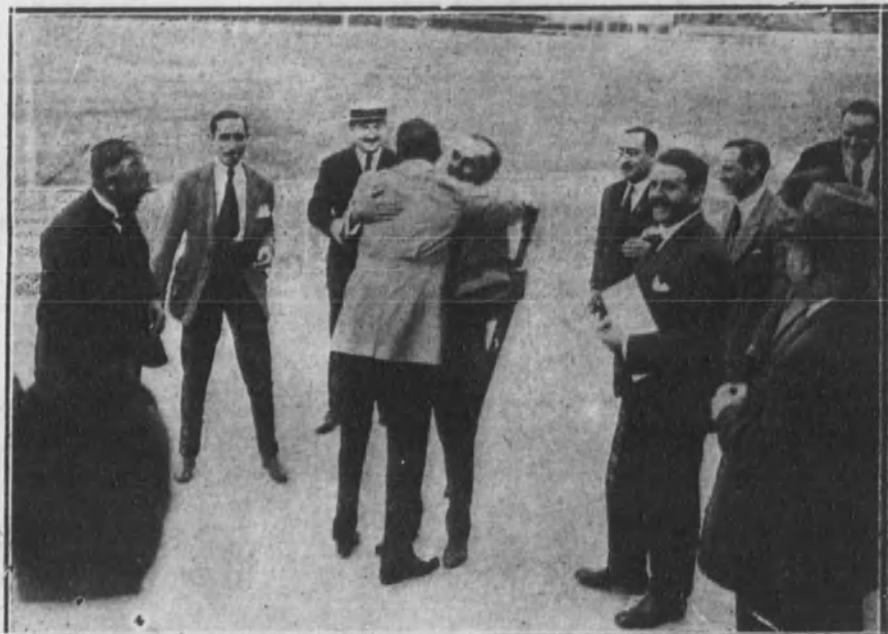
Su Majestad el Rey abrazando al ganador del «Gran Premio», al término del concurso de tiro.