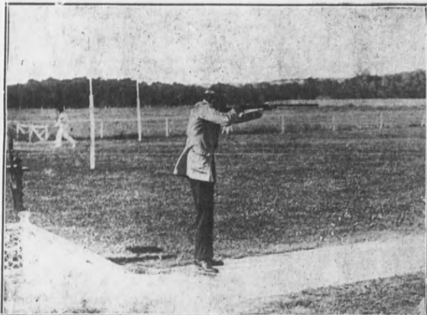
Su Majestad el Rey disputándose el «Gran Premio» en el Tiro de Pichón de la Casa de Campo.