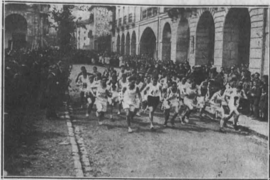
Momento de salir los corredores en el «cross-country» de la copa del Ayuntamiento de Zumárraga.