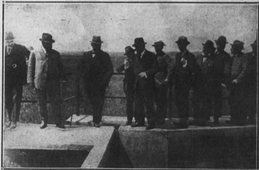
SEVILLA.—El ministro de Fomento y los directores generales de Agricultura y Obras públicas, visitando las obras de riego del valle interior del Guadalquivir.