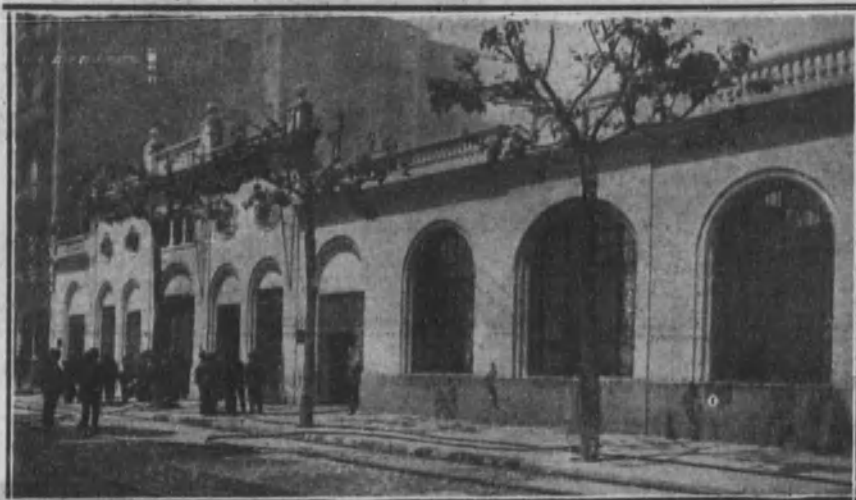
BARCELONA.—Bajos de la fachada de la fábrica de hilados Fabra-Coats, destruida por el incendio de la calle de la Diputación.