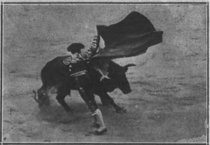
Nacional toreando de capa a su toro.