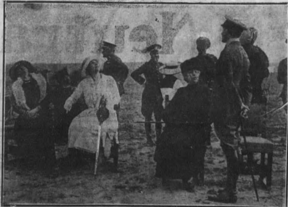
MADRID.—Sus Majestades las Reinas doña Victoria y doña María Cristina presenciando los vuelos del aparato gigante.