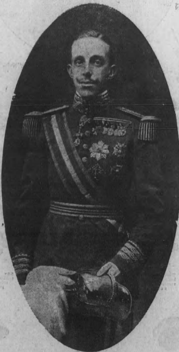
SU MAJESTAD EL REY DON ALFONSO XIII, que hoy celebra su cumpleaños.

canta y canta tu antigua melodía! Quiero cantar a España con sus valles, sus locos pasacalles; ya a la España gentil de pandereta, ya a la España inmortal del Roncesvalles; la España del guerrero y del poeta; la España agraria, en flor, arriando mulos por las ubres en flor de los senderos: España de soldados y de chulos,