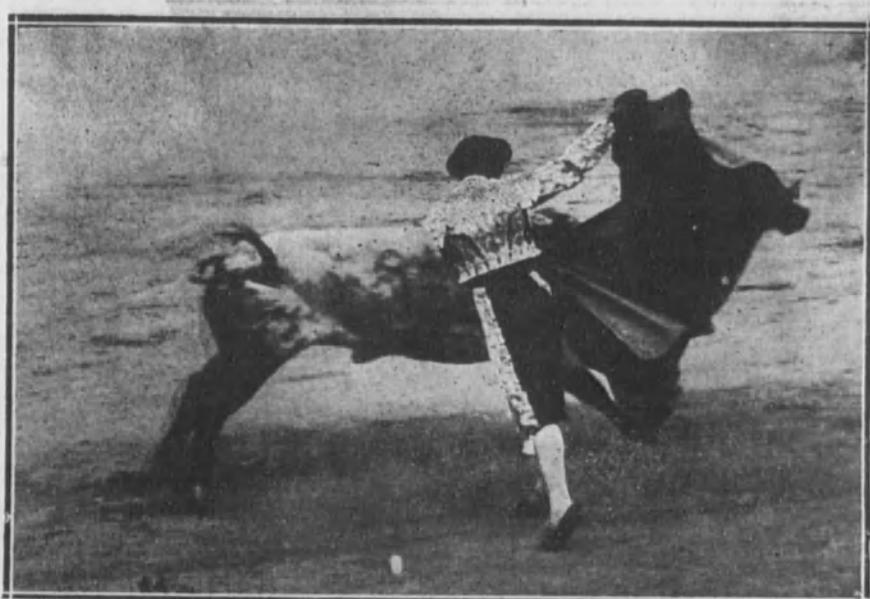
Belmonte toreando de capa a su toro.