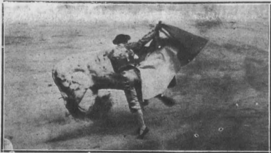
Gaona toreando de capa a su toro.