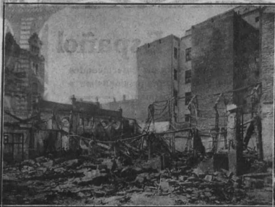
BARCELONA.—Estado en que quedaron los almacenes de la fábrica de hilados Fabra-Coats, después del incendio.