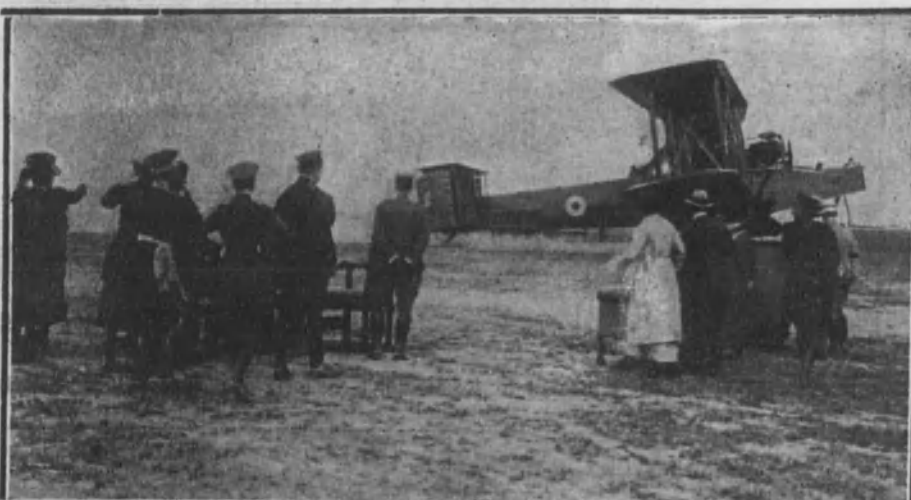
MADRID.—Salida del aparato gigante «Handley-Page», a presencia de Sus Majestades.